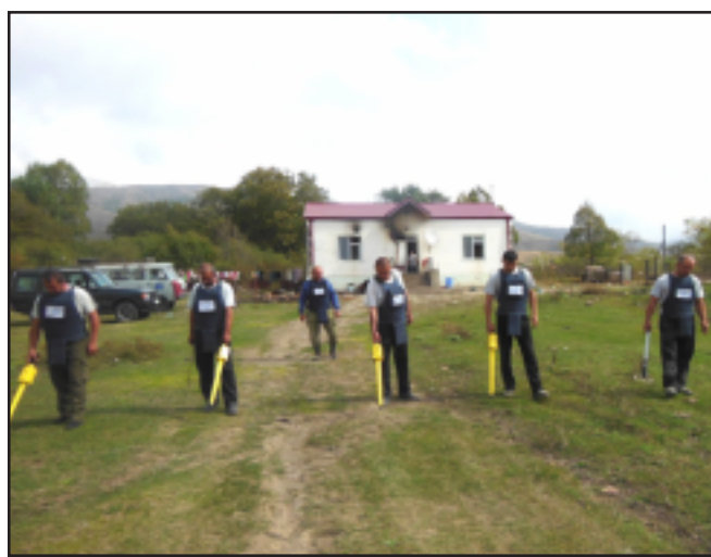
Virab's house in the background

Landmine Free Artsakh is a group of concerned Armenians who have