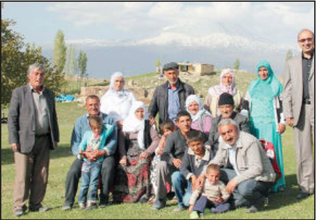
Արարատի ստորոտին բնակող՝ իրենց հիմնական իսլամացած հայեր

ցանկութիւնն այն է, որ տարիներ շարունակ որեւէ լուր չունեցած իրենց հարազատները գտնեն իրենց: