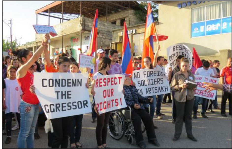
Ղարաբաղի բնակիչները բողոքի ցոյցով փակած են մանապառիք Մինսկի Խումբի համաձայնագահներուն առջեւ

Անցեալ շաբաթավերջին Ստեփանակերտ այցելած ԵԱՀԿ Մինսկի խումբի համանախագահները դիմաւորուեցան բողոքի ցոյցով: Փակելով մայրուղին՝ ուրկէ պէտք է անցնէր համանախագահներու մեքենաները շարափունը, բողոքի մասնակիցները պահանջեցին, մասնաւորապէս Ամերիկայի ներկայացուցիչ Ջէյմս Ուորլիքէն՝ լսել իրենց կարծիքները եւ նկատի առնել զանոնք: