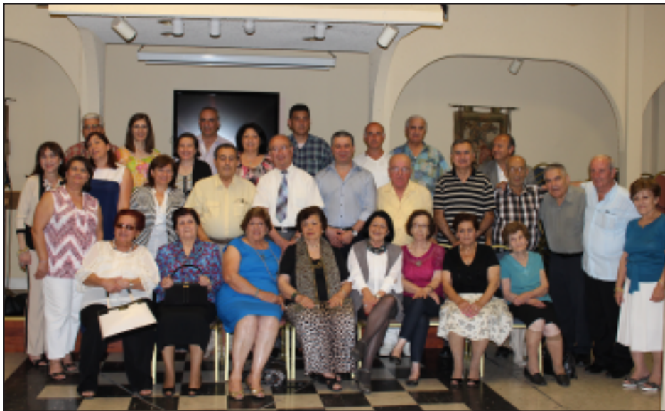
Հանդիսութեան անդամներն իմրանկար մը