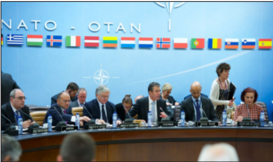
Էդուարդ Նալբանդեան եւ Սէյրան Օհանեան Հայաստան - ՆԱՌՕ համագործակցութեան մուտքուած ժողովի ընթացքին

Չորեքշաբթի, Մայիս 21-ին ՆԱՌՕ-ի Պրիւքսէլի կեդրոնատեղի-իէն ներս Հայաստանի արտաքին գործոց նախարար Էդուարդ Նալբանդեան եւ պաշտպանութեան նախարար Սէյրան Օհանեան մասնակցեցան Հայաստան - ՆԱՌՕ համագործակցութեան նուիրուած Հիւսիսատլանտեան խորհուրդի նիստին: