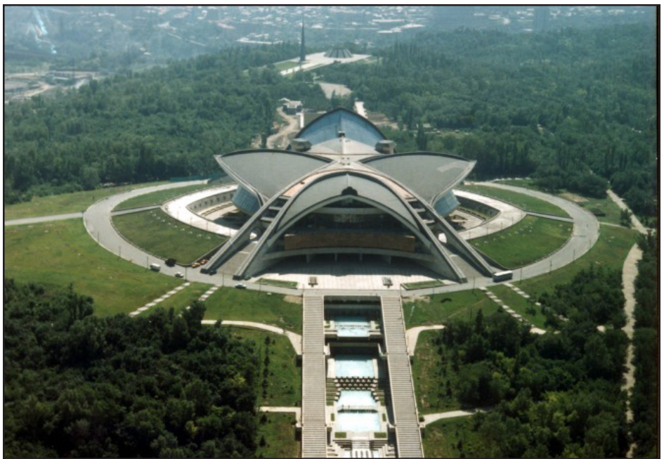
Կարէն Դեմիրբեանի անուան Մարզահամերգային համալիրի շէնքը

19 մլրդ 350 մլն դրամ նախնական գնով աճուրդի է հանուել Երեւանի Կարէն Դեմիրբեանի անուան Մարզահամերգային համալիրի շէնքը՝ յարակից տարածքներով հանդերձ: