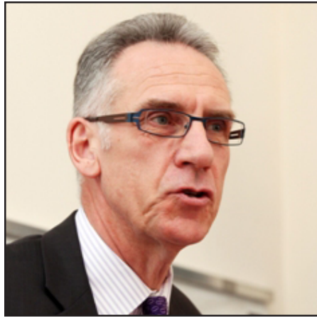
Ֆրանսիայի դեսպան Անրի Ռենո

Եկել է Հարավային Կովկասը խաղաղութեան, զարգացման եւ կայունութեան տարածաշրջանի վերածելու ժամանակը, Մայիսի 21-ին «Եւրամիութեան ընդլայնման 10-րդ տարեդարձ» խորագրով հանրային քննարկման շրջանակում լրագրողներին ասել է Հայաստանում Ֆրանսիայի արտակարգ եւ լիազօր դեսպան Անրի Ռենոն: