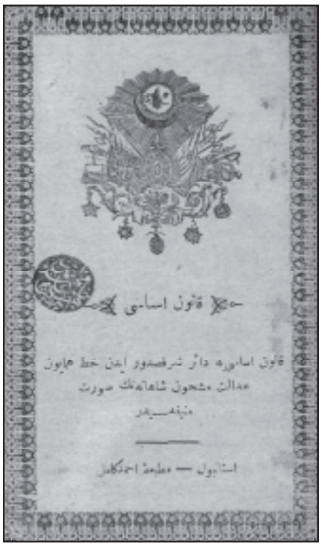
Միդիատեան կամ Օսմ. 1876 թուականի Սահմանադրութիւնը

Ի դէպ, այստեղ պիտի ուզենք ընդգծել, որ առկայ ուսումնասիրութիւնը պատրաստելու առթիւ մեր ուշադրութիւնը մասնաւորապէս կեդրոնացած է ընկերակարական այն թերթերուն[19] վրայ, որոնք ուղղակի անդրադարձած են 19-րդ դարու վերջին տասնամեակին եւ 20-րդ դարու սկիզբին Օսմանեան Կայսրութեան մէջ տեղի ունեցած քաղաքական կարեւոր եղելութիւններուն: Նշուած իրադար-