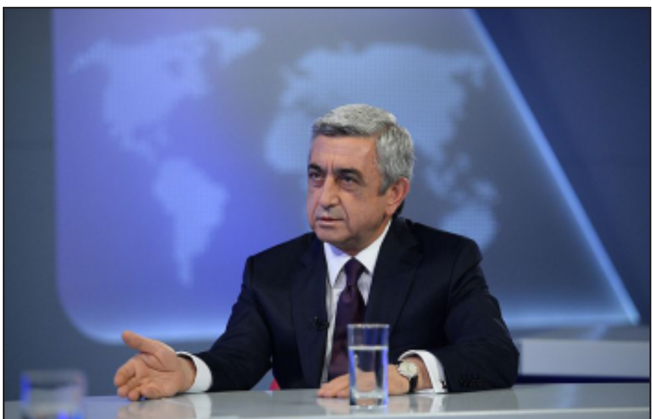
Սերժ Սարգսեան «Հանրային» հեռատեսիլի վրայու նեցած հարցազրոյցի ընթացքին

Հայաստանի նախագահ Սերժ Սարգսեանը հարցազրոյց տուաւ Հանրային հեռուստաընկերութեան եւ մօտ 40 վայրկեան տեւած հարց ու պատասխանի ընթացքին անդրադարձաւ Եւրասիական Միութեան մէջ Հայաստանի ապագային, երկրի ապահովութեան հարցերուն, ընդդիմութեան պահանջներուն, եւ նոյնիսկ՝ ֆուտպոլի աշխարհի բաժակին վերաբերեալ հարցերուն: «Այո, Հայաստանի Հանրապետութիւնը անդամակցելու է Մաքսային Միութեանը իր իսկ կողմից ճանաչած սահմաններով՝ այնպէս, ինչպէս Հայաստանի Հանրապետութիւնը այս 20, 22 տարիներէ, 23 տարիներէ ընթացքում անդամակցել է մնացած բոլոր միջազգային կառույցներին: Որեւէ մէկը կա՞յ, որ էստեղ հարց առաջացնի կամ ասի՝ էս մօտեցումը սխալ է: Վստահ