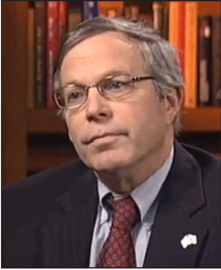
Միացեալ Նահանգներու դեսպան Զոն Հեֆերն

Հայաստանի մօտ Միացեալ Նահանգներու արտակարգ եւ լիազօր դեսպան Զոն Հեֆերն անդրադառնալով «Հանրային» հեռուստաընկերութեան «Հարցազրոյց» ծրագրէն ՀՀ նախագահ Սերժ Սարգսեանի տուած հարցազրոյցին, ուր ան նշած էր, թէ Լեւոնային Ղարաբաղի հարցի շուրջ ընթացող բանակցութիւնները դանդաղումը պայմանաւորուած է անով, որ ԵԱՀԿ Մինսկի Խումբի համանախագահները եւ Հայաստանը նոյն կերպ կը մեկնաբանեն համանախագահներու կողմէ առաջարկուած սկզբունքները, իսկ Ատրպէյճանը՝ այլ, ըսաւ.