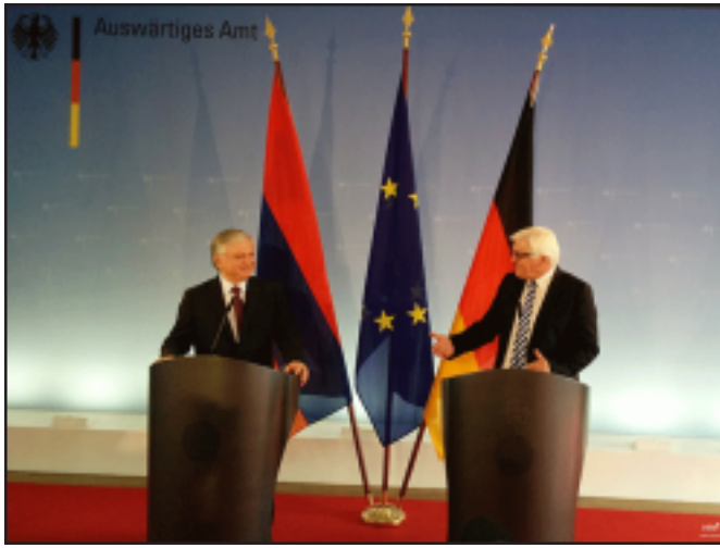
Հայաստանի եւ Գերմանիայի արտաքին գործերի նախարարներ Էդուարդ Նալբանդեանի եւ Ֆրանկ-Վալտեր Շտայնմայերի

Յունիս 16-ին Բեռլինում կայացել է Հայաստանի եւ Գերմանիայի արտաքին գործերի նախարարներ Էդուարդ Նալբանդեանի եւ Ֆրանկ-Վալտեր Շտայնմայերի հանդիպումը: