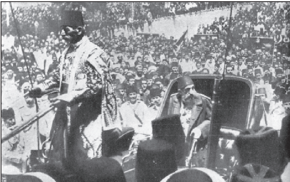
Ապտիլ Համիտ Բ. (1842-1918), Սուլթան Օսմ. Կայսրութեան (1876-1909), հրապարակային հագուադէպ ելոյթի մը առթիւ՝ 1908 թ.

խերին ու անոր կը յանձնէ, չիրաւի՛, պատմական ինդրագիր[7] մը: Սոյն փաստաթուղթը կը նկարագրէ Օսմանեան Կայսրութեան մէջ հայ ազգաբնակչութեան դէմ իրականացող հալածանքներն ու բռնութիւնները, հարիւր հազարաւոր հայերու՝ մանուկներու, կանանց, այդ մարդոց եւ ծերերու զագանաբարոյ վայրագութիւններով ջարդուիլը, հիմնադրական կործանումը հայաբնակ բազմաթիւ գիւղերու եւ ավաններու: Խնդրագիրը կու գայ միաժամանակ արտայայտելու գուրջերիացի ժողովուրդին զօրեղ կամ-