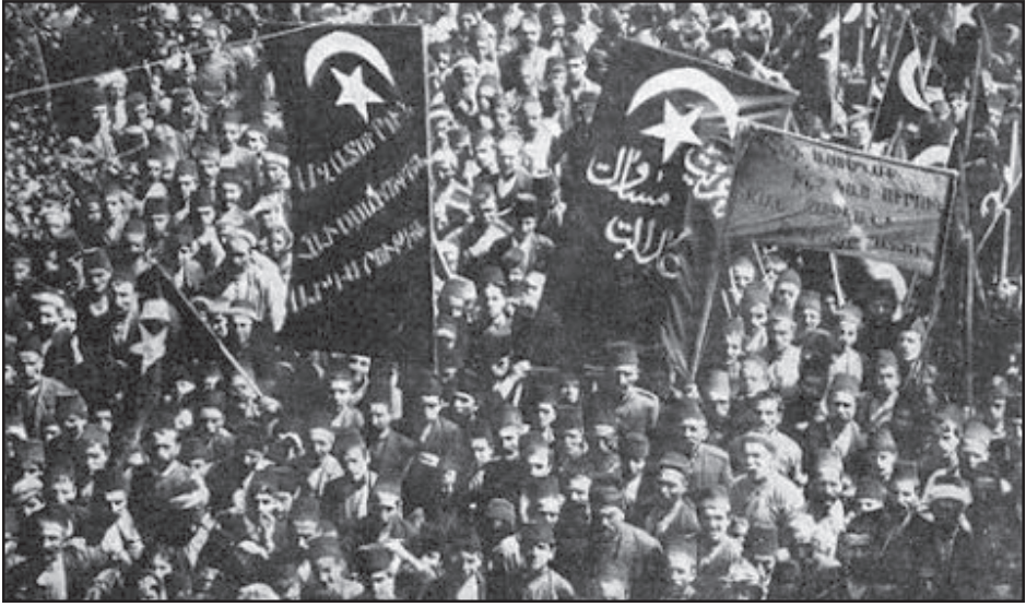
1908-ի յեղաշրջման խանդավառութիւնը նաեւ Հայոց համար: Բարձրացուած հայկական դրօշներուն վրայ կը կարդացուի՝ Ազատութիւն, Հաւասարութիւն, Արդարութիւն. Իսկ միւսին վրայ՝ Պէշկիթաշի ծանօթ տառապարհը՝ «Ընդ աւտեղօփէնէ կայ սիրուն՝ Բան գանձկալի եղբայր անունը»:

Այս ընթացքին, Զուլիջերիոյ մամուլը իր ուշադրութիւնը կը կեդրոնացնէ Օսմանեան Կայսրութեան հետզհետէ աւելի ակներեւ դարձող տկարացումին վրայ: Հրապարակուած իրարայջորդ յօդ-