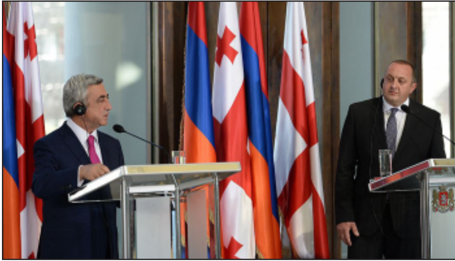
Serzh Sarkisian and Giorgi Margvelashvili during joint press conference in Tbilisi

TBILISI -- Armenian President Serzh Sarkisian concluded a two-day official trip to Georgia on June 19 by holding talks with Georgian Parliament speaker Davit Usupashvili and senior lawmakers.