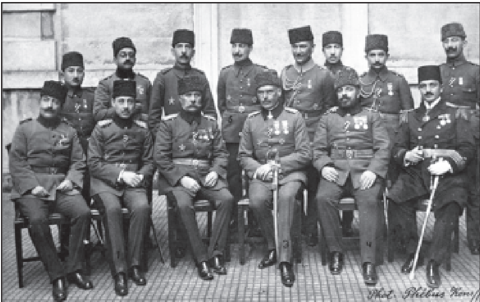
Օթթօ Լիւման Ֆօն Սանտերգ Փաշա՝ շրջապատուած իր վերապատրաստած թուրք սպաներով, 1914/1918 թթ.

Ժընեւի մէջ համախմբուած խումբ մը վրացի ընկերվարական-