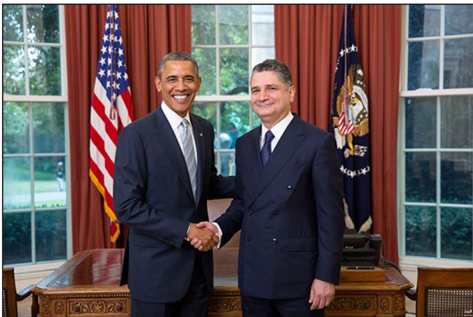
President Obama and Ambassador TSarkisian at the White House Ceremony

WASHINGTON, DC -- Armenia's former prime minister Tigran Sarkisian, who was appointed ambassador to the United States late last month, handed his credentials to President Barack Obama in a ceremony in Washington this week.