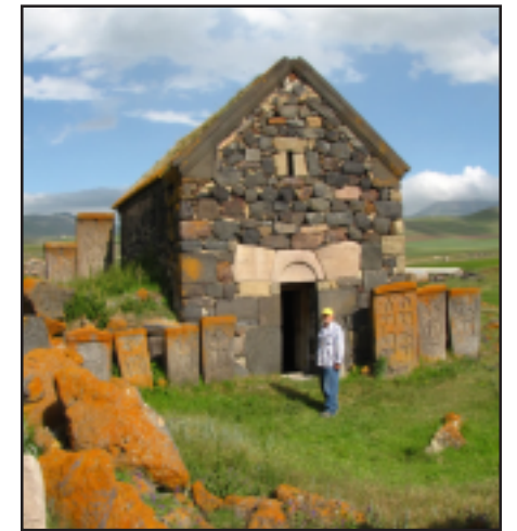
Ayrk, Soorp Gevorg church, 19th C

Turks settled in the area renaming the village Dashkert (meaning "stone built" - the same meaning as its previous Armenian name). Many, if not most, of the Armenians had left. After the Armenian Genocide some refugees from western Armenia resettled there, perhaps during the first Armenian Republic established in 1918. During the first republic and the subsequent Soviet era, though the village remained within Armenia's borders, it retained its Turkish name due to the presence