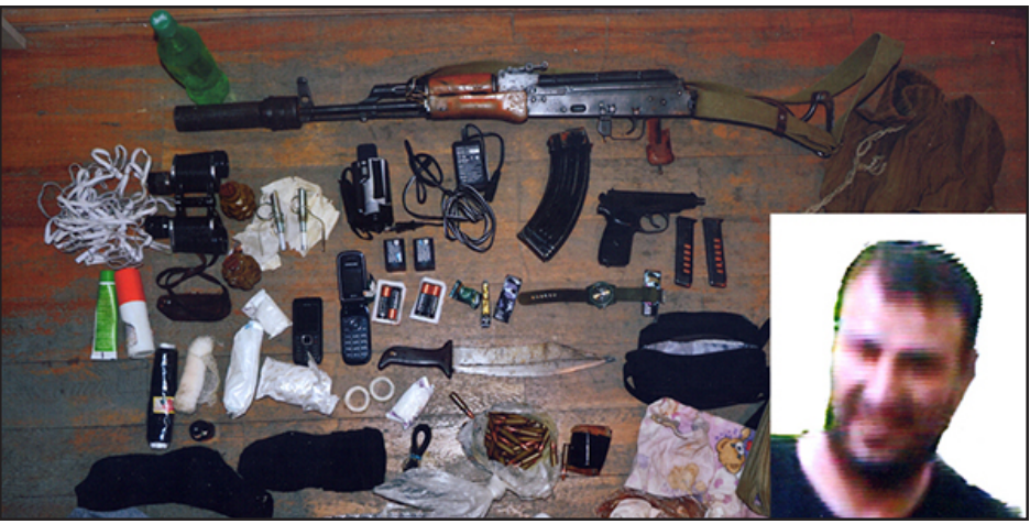
Գերի ինկած ատրպէյճանցի հետախոյզը եւ անոր մօտ գտնուած զինամթերքը

Լեւոնային Ղարաբաղի Հանրապետութեան ընդհանուր դատախազութիւնը հրապարակեց հաղորդագրութիւն մը, բացայայտելու համար Արցախի սահմանները ապօրինի միջոցներով հատած եւ հայկական ուժերուն մօտ գերի ինկած երկու ատրպէյճանցի հետախոյզներու ձերբակալման գործողութիւնը եւ անոնց մօտ գտնուած զէնքի ու զինամթերքի տեսակն ու քանակը: Հաղորդագրութեան համաձայն, ատրպէյճանցիները գիտնուած էին ինքնաձիգ զէնքերով եւ ատրճանակներով: Առաջին հետախոյզի ձերբակալութեանէն ետք, հայկական ուժերը վնասագրեծերծած են նաեւ երկրորդ ատրպէյճանցի մը, առանց զէնքի ուժի գործածութեան: Անոնց հետ սահմանները հատած երրորդ գիւնեալ մը ոչնչացուած է հայկական ուժերու գործողութիւններուն: