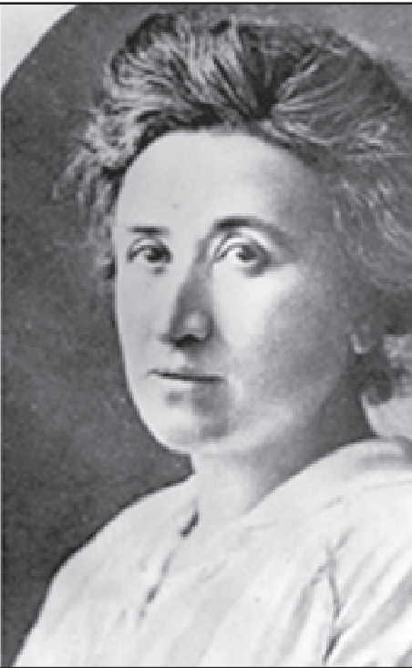
Սոցիալ-Դեմոկրատ հեղինակաւոր տեսաբաններ եւ գործիչներ՝ Քարլ Լիպքենիսթ եւ Ռոզա Լուքսեմպուրկ

տառապանքը մեղմացնելու համար: Պէտք է Գերմանիոյ Սոցիալ-Դեմոկրատիայի ազդեցութիւնը, քաղաքացիական խաղաղութեան պայմաններուն մէջ, բաւարար ըլլար, յառաջացնելու համար Գերմանիոյ կառավարութեան միջամտութիւնը: