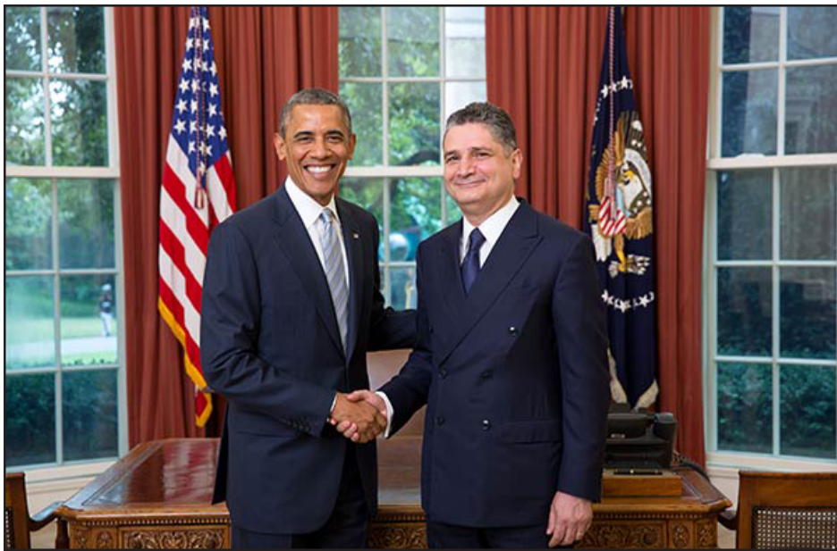
ՀՀ նորանշանակ դեսպան Տիգրան Սարգսեան Սպիտակ Տան մէջ նախագահ Պարաօպամային իր հաւատարմագիրը յանձնելու արարողութեան ընթացքին

Միացեալ Նահանգներու մօտ Հայաստանի Հանրապետութեան նորանշանակ դեսպան Տիգրան Սարգսեան Յուլիս 14-ին իր հաւատարմագիրը յանձնած է Նախագահ Պարաօպամային: Հաւատարմագիրը յանձնման պաշտօնական արարողութեան ընթացքին դեսպան Սարգսեան յայտնած է, որ հայ-ամերիկեան յարաբերութիւնները կ'առանձնան բարձր մակարդակով եւ արդիւնաւէտ համագործակցութեամբ: ՀՀ դեսպանը աւելցուցած է, որ երկու երկիրներու միջեւ առկայ է յարաբերութիւններու զարգացման մեծ ներուժ, եւ իր առաքելու-