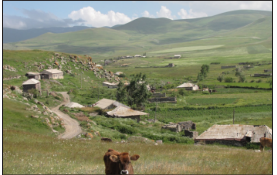
Village of Ayrk in the distance