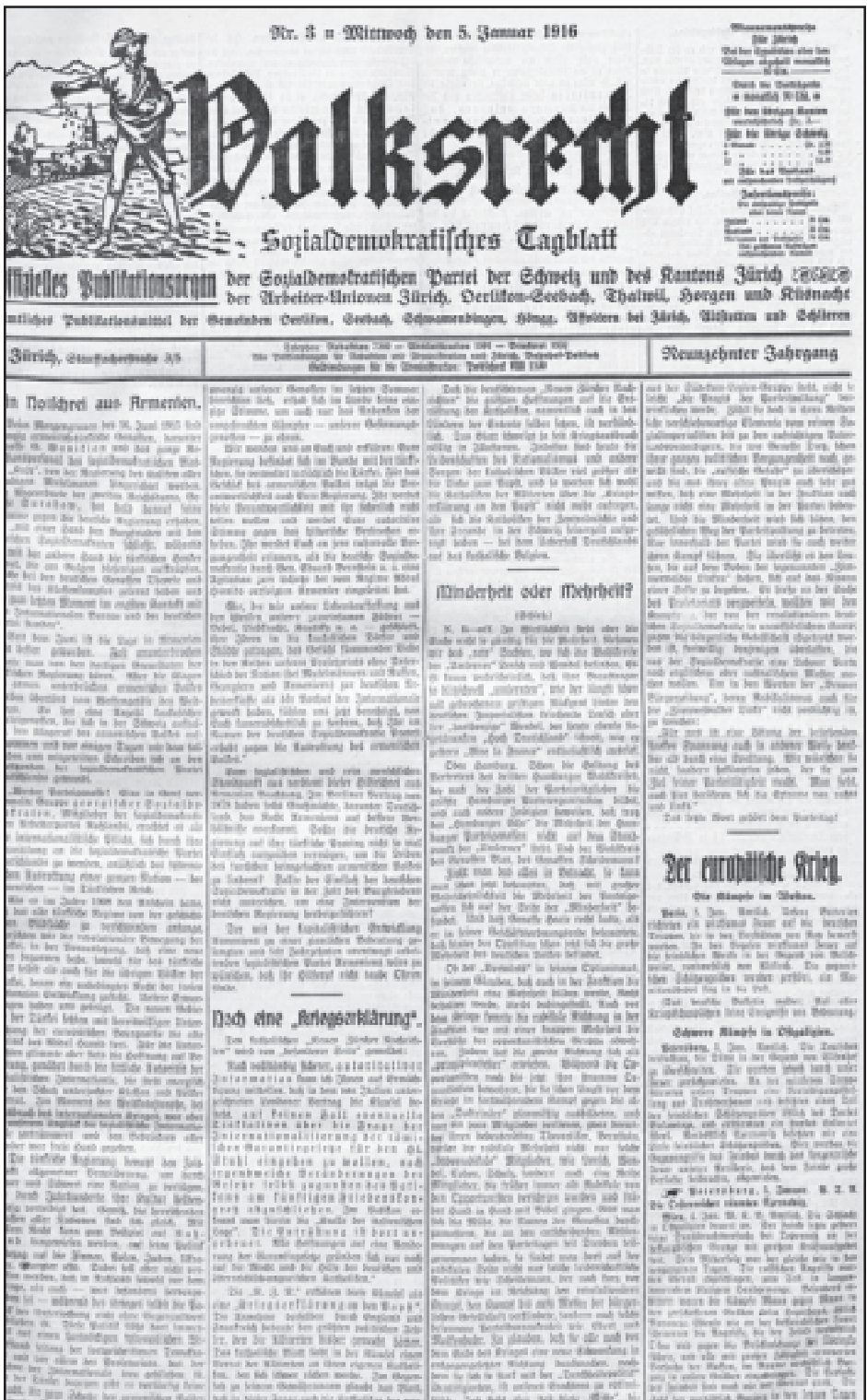
Ֆօլքսըրեխթ, 5 Յունուար 1916 - Օգնութեան Աղաղակ մը Հայաստանէն

ներ, որոնք անդամներ են Ռուսաստանի Ընկերվարական-Բանուորական Կուսակցութեան, իրենց միջազգային պարտականութիւնը կը համարեն դիմելու Գերմանիոյ Սոցիալ-Դեմոկրատական Կուսակցութեան, թրքական Կայսրութեան մէջ ամբողջ ազգի մը՝ հայ ժողովուրդի բնաջնջման առթիւ: Երբ 1908 տարին այն երեւոյթն ունէր թէ թրքական հին վարչակարգը պատմութեան երեսին անհետանալու սկսած էր, մենք