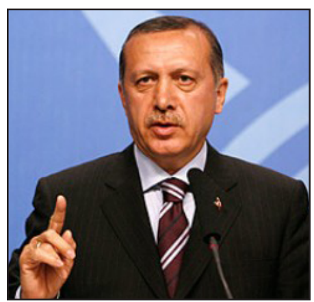
Թուրքիայի վարչապետ Ռեջեփ Թայյիփ Էրդողան

Նշում է նաեւ, որ ԱՄՆ նախագահ Բարաք Օբաման ամիսներով հրաժարուած է շփուել Էրդողանի հետ, իսկ վերջինս փորձում է