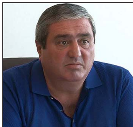
Armavir Mayor Ruben Khlgatian

The health conditions of Mayor Ruben Khlgatian and other two injured is assessed as serious, but stable. The