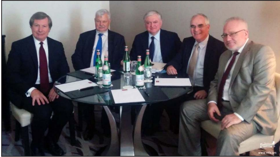
Foreign Minister Edward Nalbandian meeting with OSCE Minsk Group Co-Chairs

BRUSSELS -- Armenian Foreign Minister Edward Nalbandian drew the attention of international mediators to the 'intensified subversive activities' of Azerbaijan as he met with them to discuss further steps on settling the protracted Nagorno-Karabakh conflict on Tuesday.