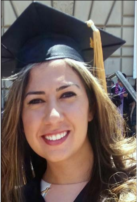
Յանողի սիրտը կ' ուրախացնի:

Արտը ամբողջ ոսկի կը դառնայ, Բերքը առատ հունձքի կը նստի, Գործն արդար արդիւնք կ'ունենայ, Գործն արդար արդիւնք կ'ունենայ,