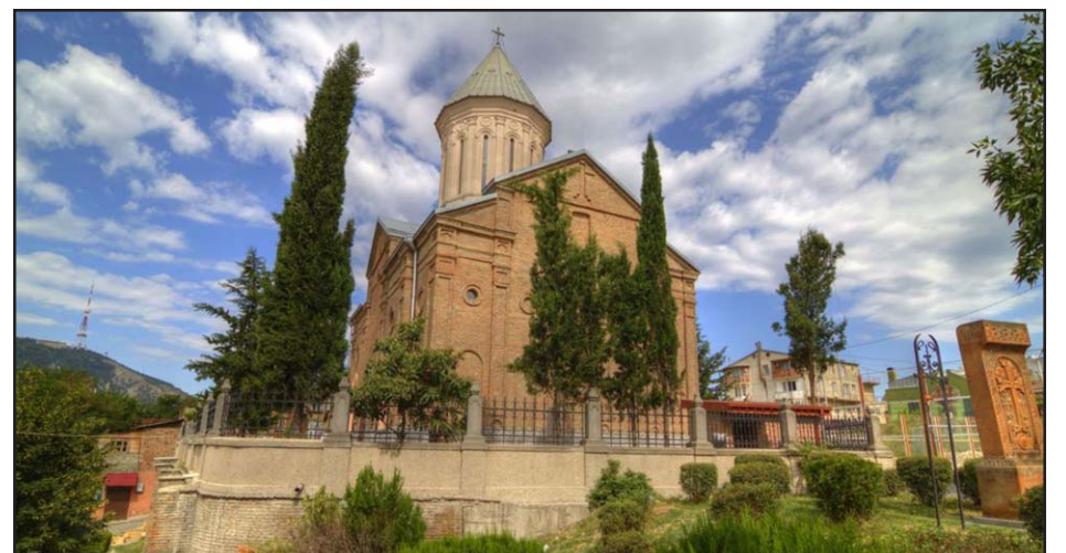
Surb Etchmiadzin Armenian Apostolic Church in Tbilisi

TBILISI — About 50 people physically attacked priests at an Armenian Church in Tbilisi on Saturday.