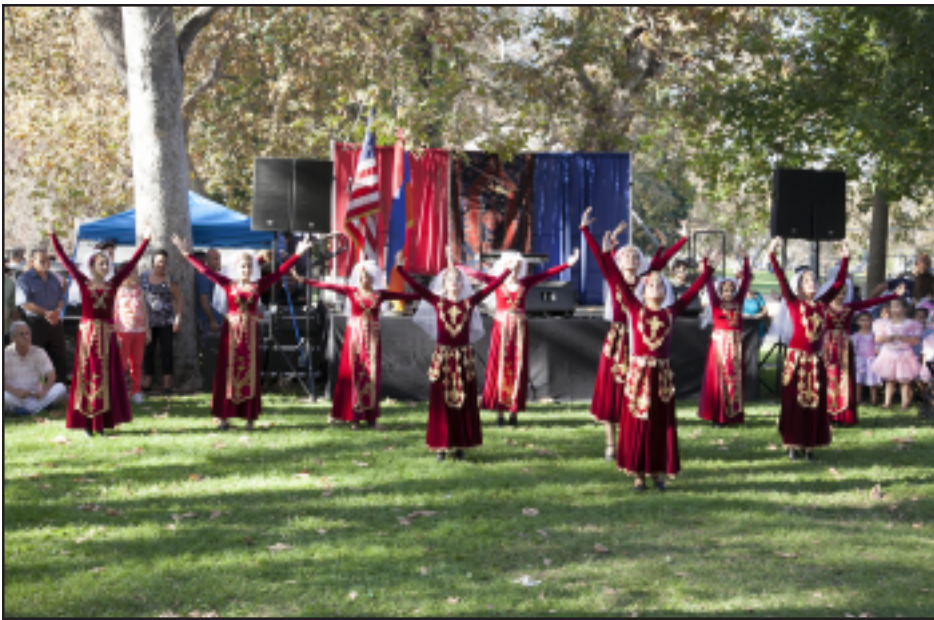
Փառատօնի ընթացքին ելույթ կ'ունենայ Նոր Սերունդ Մշակութային Միութեան պարախումբը

«Հայաստանը Ամէն Բանէ Վեր» Խորագրին տակ, Նոր Սերունդ Մշակութային Միութեան կազմակերպութեամբ, մեծ շուքով ու խանդավառութեամբ նշուեցաւ Հայաստանի անկախութեան 23-րդ տարեդարձը: