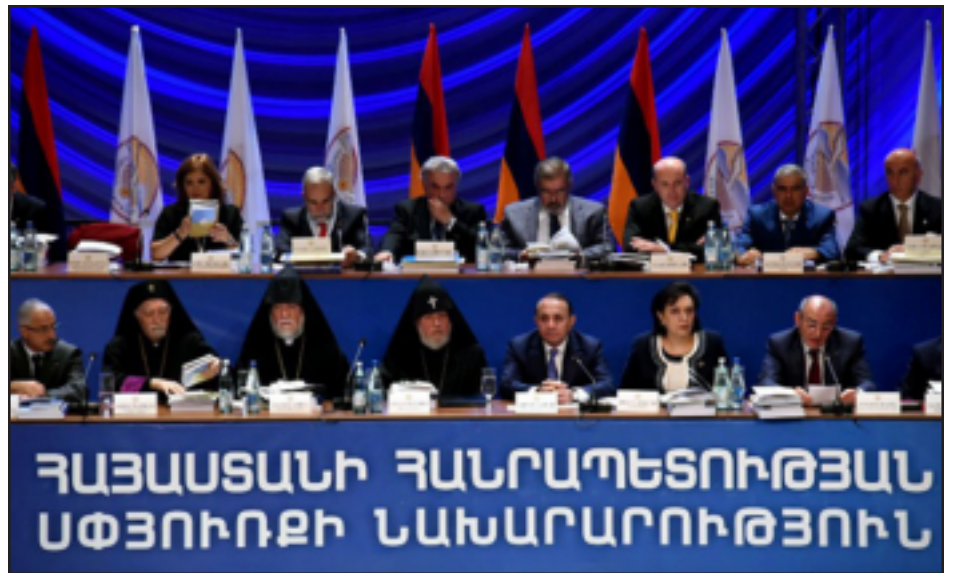
Հայաստան-Սփիւռք Համաժողովի բացման նիստի բեմը

Սեպտեմբեր 19-ին Երեւանի Օփերայի սրահին մէջ պաշտօնապէս բացուած կատարուեցաւ Հայաստան-Սփիւռք 5-րդ Համաժողովի: