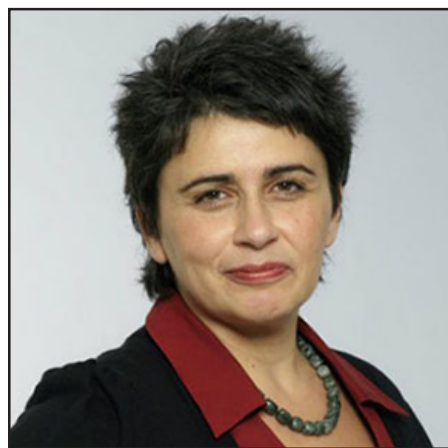
Esabelle Dingizian, third Vice-Speaker of the Swedish Riksdag

Esabelle Dingizian, born in Baghdad in 1962, has been a member of the Riksdag since 2006. She has been member of the Committee on Cultural Affairs and deputy mem-