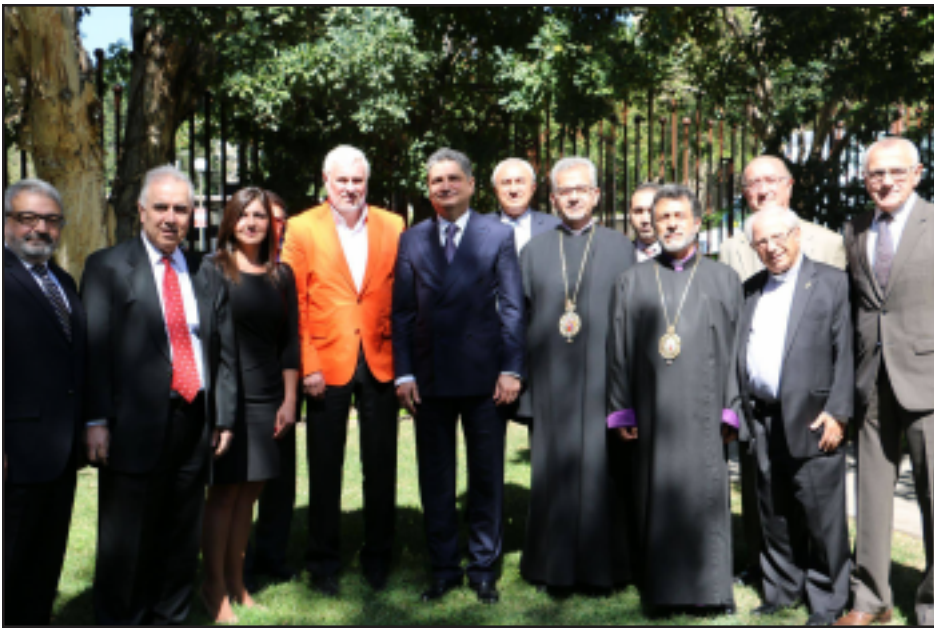
Լոս Անճելըսահայ համայնքի ներկայացուցիչներու հանդիպումը դեսպան Տիգրան Սարգսեանի հետ

Ամերիկայի Միացեալ Նահանգներու մօտ Հայաստանի նորանշանակ դեսպան, նախկին վարչապետ Տիգրան Սարգսեանի իր անդրանիկ այցելութիւնը տուաւ Հարաւային Գալիֆորնիոյ հայ գաղութին: Այս առիթով Երեքշաբթի, Սեպտեմբերի 30-ին, Կլենտէյլի Հայաստանի Հիւպատոսարանին մէջ տեղի ունեցաւ հանդիպում մը, որուն ներկայ էին գաղութի քաղաքական եւ կրօնական ղեկավարներ եւ հիւպատոս Պր. Սարգիսով: Խօսելով իր Ուաշինգթոն փոխադրուելուն եւ դեսպան նշանակուելուն մասին դեսպան Սարգիսեան ընդգծեց որ յատուկ առաքելութեամբ է որ ստանձնած է այս նոր պաշտօնը, գլխաւոր նպատակ ունենալով աւելի բարձր մակարդակներու հասցնել հայ-ամերիկեան փոխ յարաբերութիւնները տարբեր մակարդակներու վրայ,