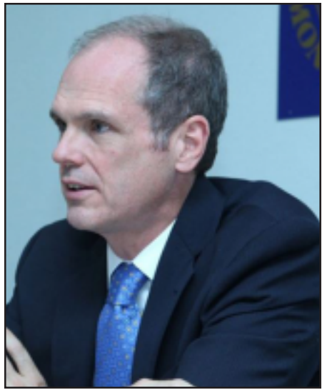
ԱՄՀ հայաստանեան առաքելութեան ղեկավար Մարք Հորթը

Արժութային Միջազգային Հիմնադրամի (ԱՄՀ) հայաստանեան առաքելութեան ղեկավար Մարք Հորթըն Երեւանի մէջ յայտարարեց, որ Հայաստանի տնտեսութեան կը սպասեն դժուարին ժամանակներ: Ան ըսաւ, որ հիմնադրամը կ'որոշէ իջեցուցած է Հայաստանի այս տարուայ տնտեսական աճի իր կանխատեսումը՝ զայն հասցնելով 2.6 տոկոսի: Մէկ տարի առաջ ԱՄՀ կանխատեսած էր որ, Հայաստան 2014 թուականը կը փակէ 4.8 տոկոս տնտեսական աճով: Յովիկ Աբրահամեանի կառավարութիւնը այս տարուայ համար կ'ակնկալէ 4 տոկոս տնտեսական աճ: