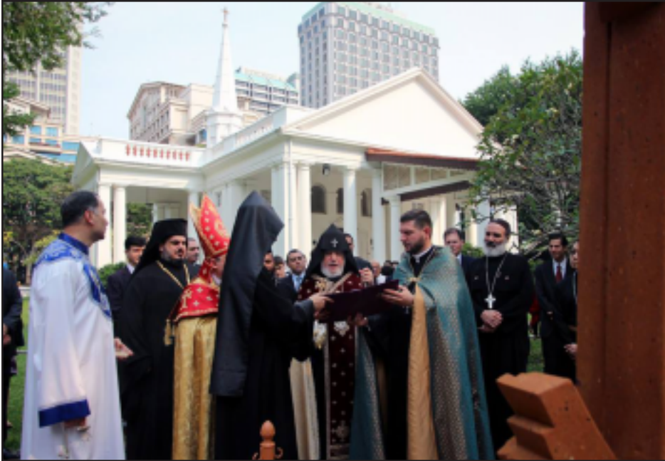
Cross-stones blessings at St. Gregory the Illuminator church of Singapore

SINGAPORE — His Holiness Karekin II, the Supreme Patriarch and Catholicos of All Armenians, started his pontifical visit to Singapore on September 28