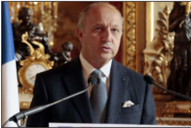
French FM Laurent Fabius

“Syrian and Iraqi heritage, including religious, is at risk. The failure to protect cultural heritage constitutes a war crime, and those responsible are amenable to the international criminal court. In cooperation with the United