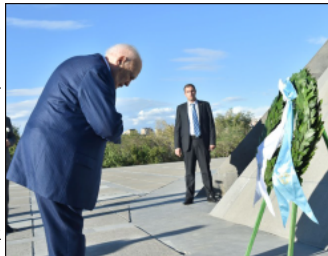
Greek president Karolos Papoulias honoring Armenian Genocide Victims at Tsitsernakaberd

The Armenian president particularly praised the “constructive dialogue established between the defense ministries of the two states.” “We, of course,