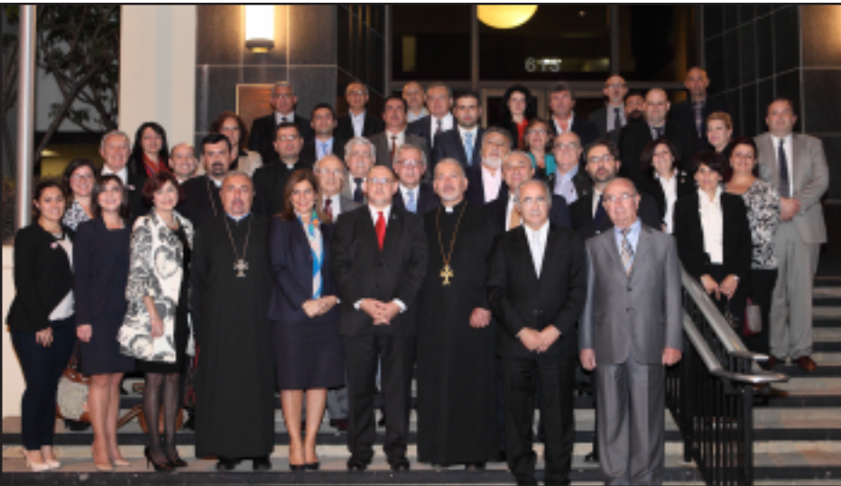
Հայկական կազմակերպութիւններու ներկայացուցիչները Կլէնտէլի Քաղաքապետարանի շէնքին առջեւ

Նոյեմբեր 4-ի իր շաբաթական նիստի ընթացքին, Կլէնտէլի Քաղաքապետական Խորհուրդը միաձայնութեամբ որոշեց բանակցութիւններ սկսիլ Հայկական Յեղասպանութեան 100-ամեակի Յանձնախումբին հետ թանգարան, կրթական կեդրոն եւ յուշարձան կառուցելու նպատակով: