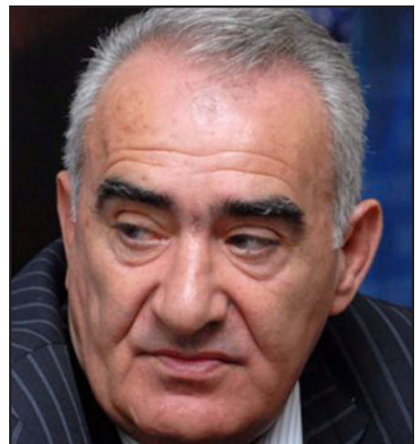
Հայաստանի խորհրդարանի նախագահ Գալուստ Սահակեան

Պատասխանելով հարցին, թէ ինչպէս է վերաբերւում նրան, որ եռեակը մտադիր է հասնել արտահերթ ընտրութիւնների անցկացման: Սահակեանը չի տեսնում Հայաստանում նախագահական եւ խորհրդարանական ընտրութիւնների անցկացման նախադրեալներ ի պատասխան հարցին, թէ