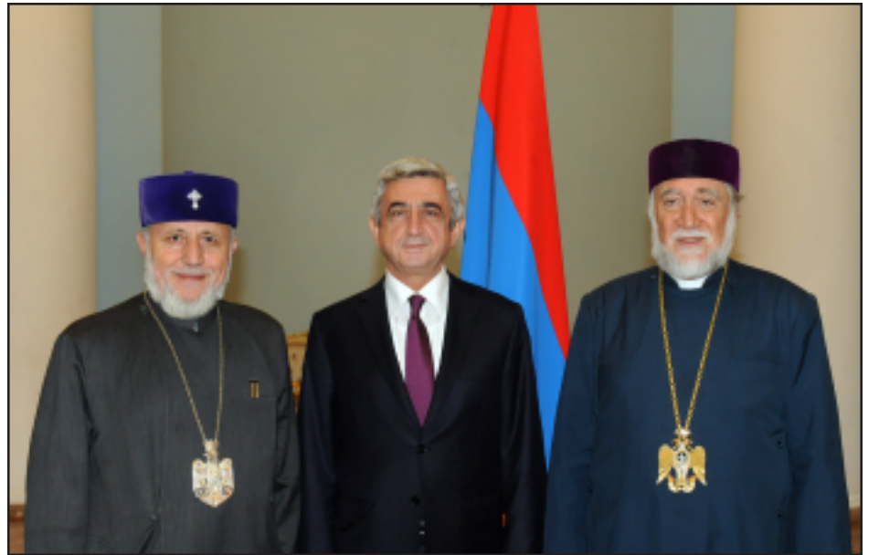
Նախագահ Սերժ Սարգսեանն Գարեգին Բ. Ամենայն Հայոց Կաթողիկոսի եւ Արամ Ա. Մեծի Տանն Կիլիկիոյ Կաթողիկոսի հետ:

Նախագահ Սերժ Սարգսեանն հանդիպում է ունեցել Ն.Ս.Օ.Տ.Տ. Գարեգին Բ. Ծայրագոյն Պատրիարք եւ Ամենայն Հայոց Կաթողիկոսի եւ Ն.Ս.Օ.Տ.Տ. Արամ Ա. Մեծի Տանն Կիլիկիոյ Կաթողիկոսի հետ: