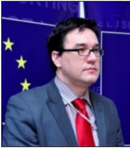
Եւրամիութեան դեսպան Տրեան Հրիսթեան

Հայաստանի եւ Եւրամիութեան միջեւ համագործակցութիւնը շատ արդիւնաւէտ էր, չնայած որ որոշակի խնդիրներ ծագեցին Ասոցացման համաձայնագրի հետ կապուած: Այս մասին Նոյեմբերի 11-ին Հայաստանում Եւրամիութեան խորհրդատուական խմբի 16-րդ նիստի ժամանակ յայտարարել է ՀՀ-ում Եւրամիութեան պատուիրակութեան ղեկավար, դեսպան Տրեան Հրիսթեան: