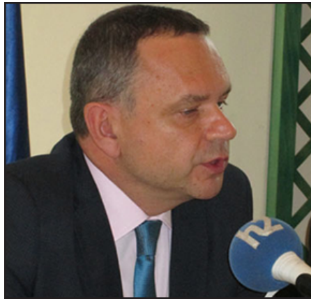
Հայաստանի մօտ Ֆրանսայի նորանշանակ ղեկավար Ժան-Ֆրանսուա Շարպանտիէ

«Ֆրանսիայի նախագահի ցուցմունքով աշխատանքներ կը տարուին նոր օրինագիծի մշակման ուղղութեամբ, որոնք պէտք է անպայման հաշուի առնեն Սահմանադրական խորհուրդի կատարած դիտողութիւնները: Իմիջիայնոց, իրողութիւնը այն է, որ անցած տարուայ Ապրիլին, երբ Փարիզի մէջ կ'ոգեկոչուէր Հայոց ցեղասպանու-