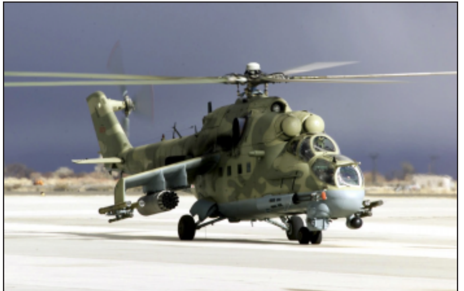
Ատրայէճանի կողմէ յարձակման ենթարկուած Ղարաբաղեան ռազմաօդային ուժերի միջուկը

Նոյեմբեր 12-ին, Ղարաբաղատրայէճան սահմանի արեւելեան հատուածի օդային տարածքին մօտ վարժական թռիչքի ժամանակ ատրայէճանական ուժերը խախտելով զինադադար, կրակած են Լեռնային Ղարաբաղի ռազմաօդային ուժերու Մի-24 ուղղաթիռի վրայ, իլեղով երեք զոհեր: