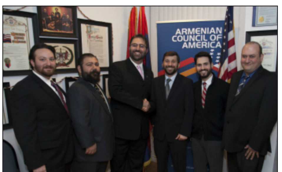
ACA Hosts Annual Holiday Celebration and Open House Տօնական Օրերուն Առթիւ ՀԱԽ-ի կազմակերպած Ընդունելութիւնը