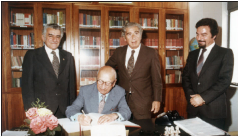
Նախագահ Մանուկեան կը ստորագրէ Նարեկի այցելումներու տոմարին մէջ (1981): Իր կողքին՝ ճանաչում եւ գորակցութիւն ստացանք նաեւ Կրթութեան նախարարութեան արտօնագիրը: Արդարեւ՝ ճանաչում եւ գորակցութիւն ստացանք նաեւ Կրթութեան նախարարութեան արտօնագիրը: Արդարեւ՝ ճանաչում եւ գորակցութիւն ստացանք նաեւ Կրթութեան նախարարութեան արտօնագիրը:

Եօթնամյակեան թուականներու սկիզբը, երբ ուսողութեան ուսուցիչ էի Մելգոնեան Կրթական Հաստատութեան մէջ, ուսուցիչներու իրաւունքներուն պաշտպանութեան գծով նախաձեռնութիւնը ստանձնեցինք հիմնելու ՄԿՀ Ուսուցչա-Պաշտօնագրական Միութիւնը: Պետական օրէնքին հետեւելով պատրաստեցինք մեր ուրոյն Ծրագիր-Կանոնագիրը, երբ լեզուներով (Յունարէն, Հայերէն, Անգլերէն) եւ պաշտօնագրական ճիշդագիտութեան հարցերու վերաբերեալ անհատական կարծիքներ տրուեցին: Արդարեւ ճանաչում եւ գորակցութիւն ստացանք նաեւ Կրթութեան նախարարութեան արտօնագիրը: Արդարեւ՝ ճանաչում եւ գորակցութիւն ստացանք նաեւ Կրթութեան նախարարութեան արտօնագիրը: Արդարեւ՝ ճանաչում եւ գորակցութիւն ստացանք նաեւ Կրթութեան նախարարութեան արտօնագիրը: Արդարեւ՝ ճանաչում եւ գորակցութիւն ստացանք նաեւ Կրթութեան նախարարութեան արտօնագիրը: Արդարեւ՝ ճանաչում եւ գորակցութիւն ստացանք նաեւ Կրթութեան նախարարութեան արտօնագիրը: