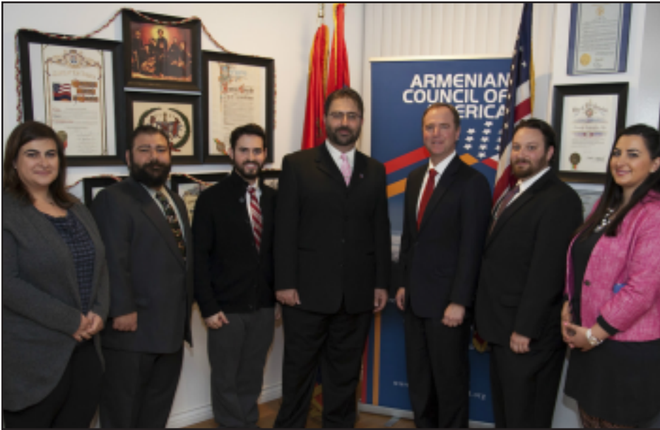
Ընդունելութեան ընթացքին ՀԱՆ-ի վարչութեան անդամները գոնկրէսական Ատամ Շիֆի հետ

Կիրակի, Դեկտեմբեր 14-ին, տօնական օրերու առթիւ, ՄԴՀԿ Հայ Ամերիկեան Խորհուրդը կազմակերպած էր ընդունելութիւն, Կլէնտոնի իր գրասենեակէն ներս: «Բաց դռներու» ընդունելութեան առթիւ ՀԱՆ-ի գրասենեակը այցելեցին շարք մը Ամերիկացի եւ Հայ քաղաքական անձնաւորութիւններ, որոնց շարքին գոնկրէսական Ատամ Շիֆ: