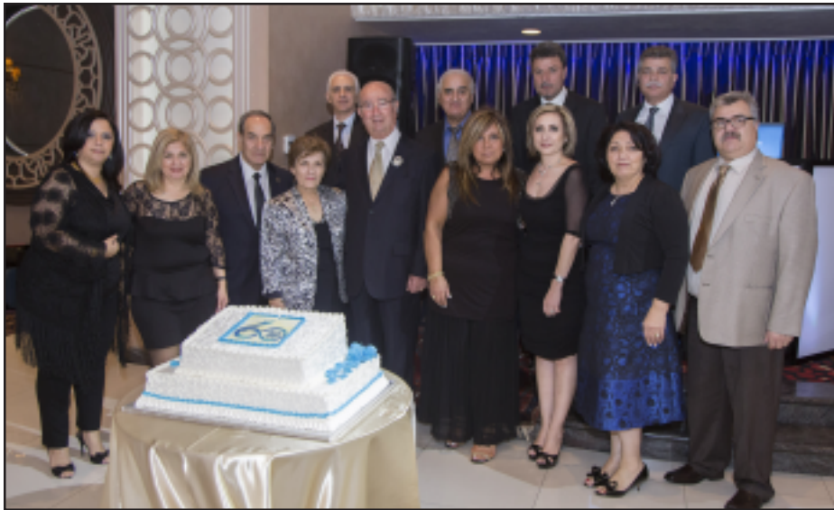
«Նոր Սերունդի» վարչութեան անդամներն ու պատուի արժանացողները

Անցեալ Շաբաթ, Մարտ 7ին, 2015, Կրեմլի «Տրիմ Փալաս» շքեղ հանդիսասրահին մէջ հանդիսաւոր կերպով նշուեցաւ Նոր Սերունդ Մշակութային Միութեան հիմնադրութեան 60 ամեակը եւ հարակալին Գալիֆորնիոյ ՆՍՄՄ-ի մասնաճիւղի կազմաւորման 35րդ տարեդարձը: