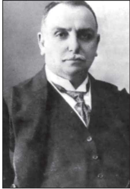
նորդներից եւ հայկական սփիւռքի մշակութային զարգացման առումով ստեղծեց մի այնպիսի բաց, որ շարունակում է մինչեւ օրս:

Պարոն Քասսեսեանը ընդգծեց, որ հայոց ցեղասպանութեան հեց սկիզբից այդ սերնդի ֆիզիքական ոչնչացումը, բռնագաղթի ենթարկուած սփիւռքահայութեանը գրկեց իր մտաւորական առաջ-