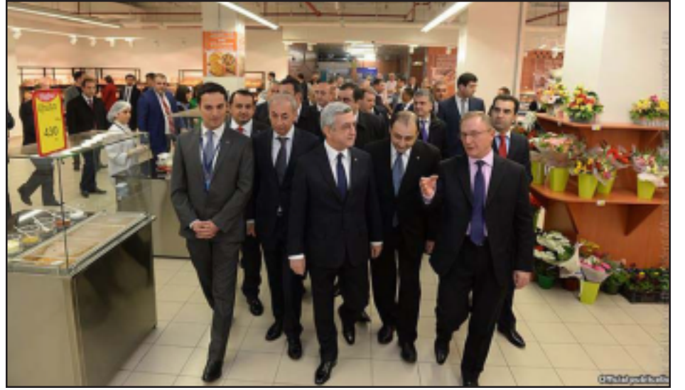
Սերժ Սարգսեան «Քարֆուրի» բացման առթիւ կը շրջի շուկայի տարբեր մասերը

«Երեւան Մոլ»-ում, վերջապէս, պաշտօնապէս բացուեց երկար սպասուած ֆրանսիական Carrefour առեւտրային ցանցի հայաստանեան հիպերմարկետը: ՀՀ նախագահ Սերժ Սարգսեանը ներկայ է գտնուել Carrefour-ի պաշտօնական բացման արարողութեանը: Հիպերմարկետի տարածքի նախնական վարձակալութեան պայմանագիրը Carrefour-ի եւ «Երեւան Մոլ»-ի միջեւ ստորագրուել էր դեռեւս 2014թ. Մայիսի 13-ին, Սերժ Սարգսեանի եւ Ֆրանսիայի Հանրապետութեան Նախագահ Ֆրանսուա Օլանդի ներկայութեամբ՝ Ֆրանսիայի Նախագահի Հայաստան պետական այցի շրջանակներում: