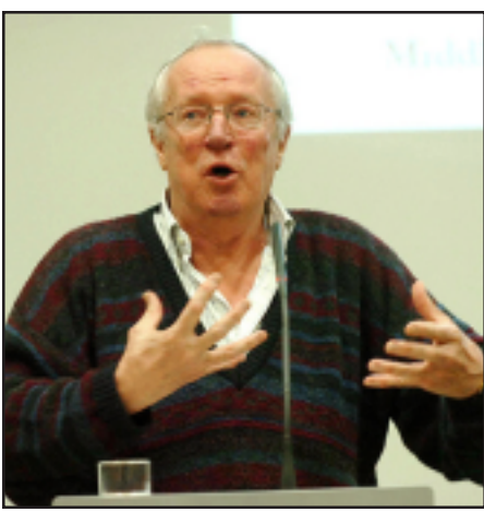
հեղինակաւոր լրագրող Ռոբերթ Ֆիլպ

Բրիտանական The Independent-ը հրատարակել է Մերձավոր Արևելքում իր թղթակից, հեղինակաւոր լրագրող Ռոբերթ Ֆիլպի յօդուածը, որում հեղինակն ուսումնասիրում է Մերձավոր Արևելքում իսլամական պետութեան ստեղծած այժմեան իրավիճակի արմատներն ու զուգահեռներ տանում նրա եւ Հայոց ցեղասպանութեան միջեւ: Յօդուածը որոշ կրճատումներով ներկայացնում ենք ստորեւ.