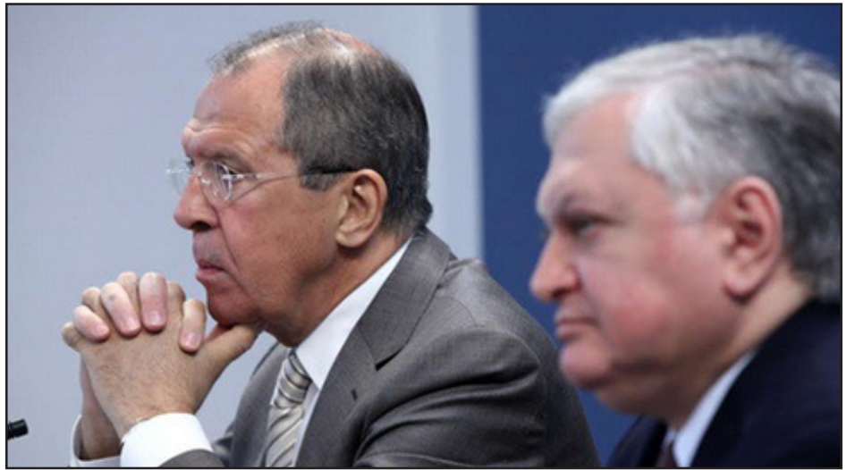
Սերգէյ Լաւրով եւ էդուարդ Նալբանդեան Մոսկուայի մէջ կայացած միատեղ մամուլային ընթացքին

«Ոչ ոք չուզեր, որ հակամարտութիւնը Ղարաբաղի մէջ անցնի տաք փուլի», Ապրիլ 8-ին յայտարարած է Ռուսաստանի արտաքին գործոց նախարար Սերգէյ Լաւրով, Հայաստանի իր պաշտօնակից էդուարդ Նալբանդեանի հետ բանակցութիւններուն յաջորդած մամուլային ասուլիսի ընթացքին: