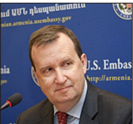
ԱՄՆ դեսպան Ռիչարդ Միլզ

«Շարունակուելու են մշակութային, կրթական ոլորտներում իրականացուող ծրագրերը՝ նպատակ ունենալով զարգացնել միջմշակութային կապերը, որոնք, վերջապէս, կը յանգեցնեն յարաբերութիւնների բարելաւմանը: Մենք շարունակելու ենք ուշադրութիւն դարձնել այդ ուղղութիւններին, պարզապէս կրճատուելու է իրականացուող ծրագրերի թիւը», - յաւելեց Ռիչարդ Միլզը: