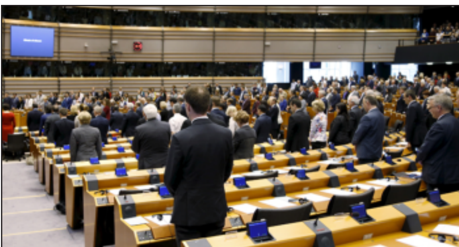
Members of the European Parliament observe a minute of silence as they commemorate the 100th anniversary of Armenian Genocide

BRUSSELS -- The European Parliament on April 15 overwhelmingly passed a Resolution on the Armenian Genocide centennial.