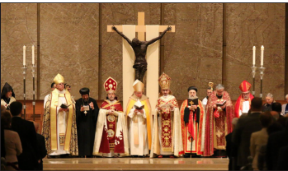
Տեսարան մը Լոս Անճելըսի միջ-համայնքային ոգեկոչումէն

Երեքշաբթի, Ապրիլի 14ին, Լոս Անճելըսի «Հրեշտակներու Թագուհի» Կաթողիկէ տաճարին մէջ, 3000 հոգիի ներկայութեան տեղի ունեցաւ Հայոց ցեղասպանութեան Միջ-Համայնքային ոգեկոչման հանդիսութիւնն ու հոգեհանգիստը: Սոյն միջոցառումին ներկայ էին 16 եպիսկոպոսներ եւ տասնեակ մը քաղաքական, դիւանագիտական, կրօնական եւ այլ անձնակերպութիւններ: