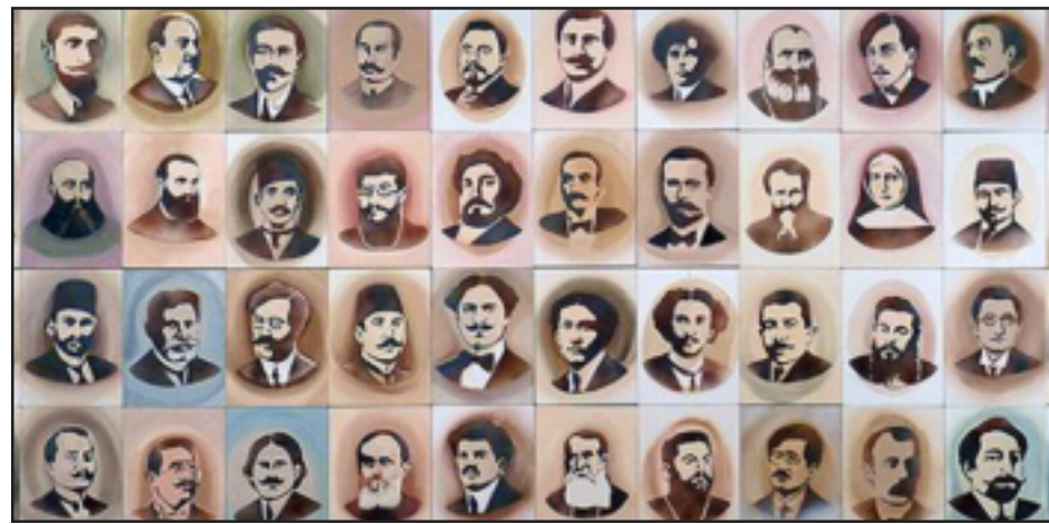
This is a segment from a collection of portraits by artist Nalan Yirtmaç of 100 Ottoman Armenian intellectuals who were arrested and taken to concentration camps on April 24, 1915, created for the exhibition "Without knowing where we are headed..."

ISTANBUL — A new exhibition at the Depo art and culture center in Istanbul by artists Nalan Yirtmaç and Anti-Pop points a finger at the brutality experienced by Armenian people living in the Ottoman Empire and in Turkey, Today's Zaman reports.