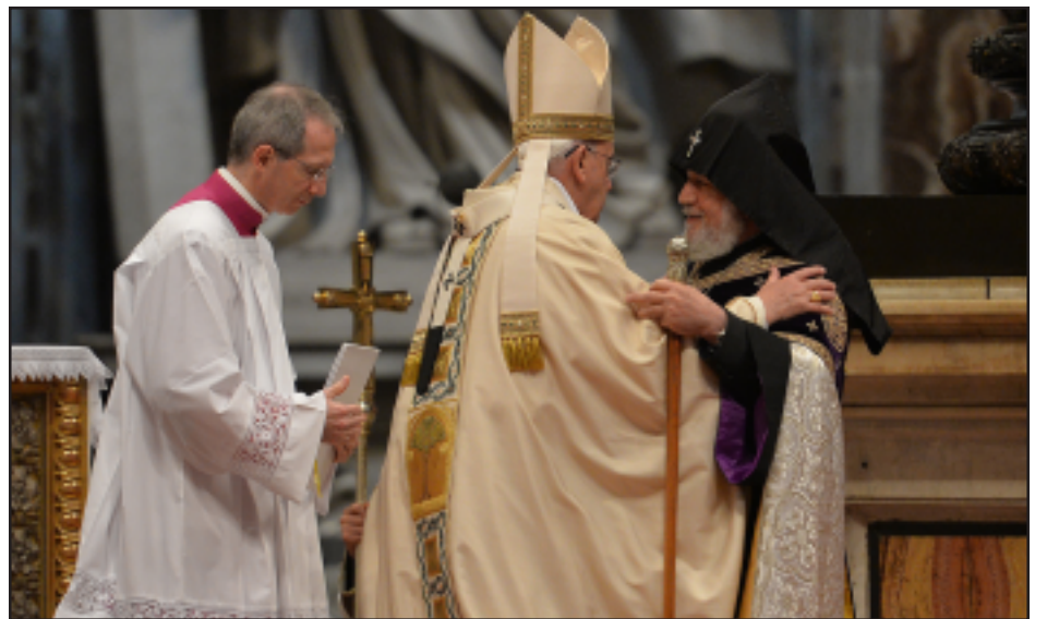
Սուրբ Պետրոս տաճարէն ներս կ'ողջագործուին Ֆրանչիսկոս Պապը եւ Գարեգին Բ. Կաթողիկոսը

Այս յայտարարութիւնը խիստ զայրացուցած է թրքական իշխանութիւններուն, ու անոնք ամենէն բարձր մակարդակով կը բողոքեն Պապի յայտարարութիւններուն դէմ: Թուրքիոյ նախագահ Ռէճեփ Էրտողան այնքան առաջ գնաց, որ հանդիմանական ոճով մը զգուշա-