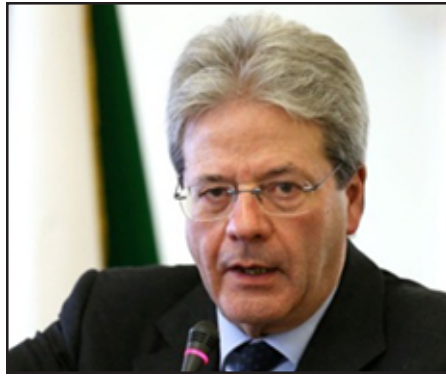
Իտալիոյ ԱԳ նախարար Պաոլո Զենտիլոնի

Հայոց Յեղասպանութեան զոհերի յիշատակին նուիրուած պատարագի ժամանակ Հռոմի Ֆրանչիսկոս Պապի ելույթի վերաբերեալ թուրքական իշխանութիւնները արձագանգն ու կոշտ արտայայտութիւններն արդարացուած չեն: Ապրիլի 13-ին նման տեսակէտ է յայտնել Իտալիայի ԱԳ նախարար Պաոլո Զենտիլոնին, հաղորդում է ՏԱՍՍ-ը: