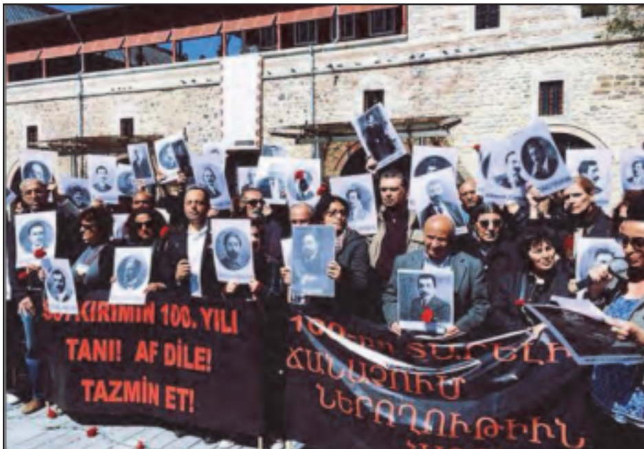
Պոլսոյ մէջ թուրք ծուցարարները՝ հայ նահատակներու լուսանկարները պարզած

Պոլսոյ մէջ Ապրիլ 24-ին տեղի ունեցան բազմաթիւ ձեռնարկներ: Առաւօտեան, գործիչներ եւ քաղաքացիներ այցելեցին այն տունները, ուր ժամանակին