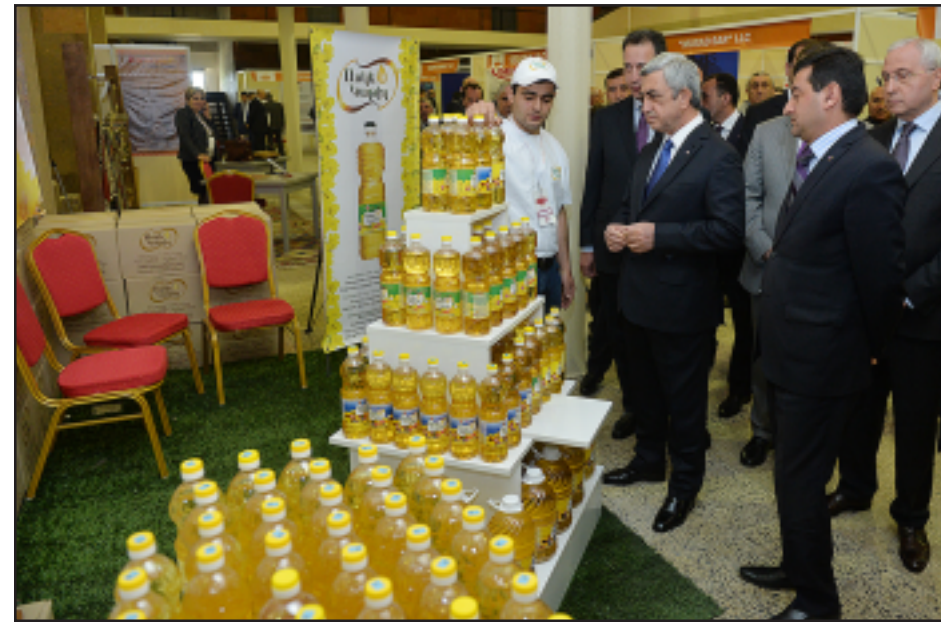
Սերժ Սարգսեան «Արտադրուած է Հայաստանում» ցուցահանդէսի տաղաւարներէն մէկում առջեւ

Նախագահ Սերժ Սարգսեանն Ապրիլ 28-ին այցելել է «Մերիդիան» ցուցահանդէսային կենտրոնում Ապրիլի 26-28-ը անցկացուող «Արտադրուած է Հայաստանում» ցուցահանդէս, որի նպատակն է՝ ներկայացնել Հայաստանի արդիւնաբերութեան առկայ ներուժը, արդիւնաբերութեան զարգացման հնարաւորութիւնները, ինչպէս նաեւ աջակցել հայաստանեան ընկերութիւնների հետագայ զարգացմանն ու արտահանման խթանմանը: