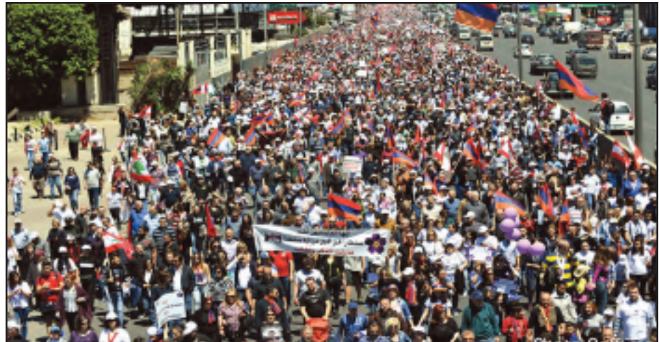
Լիբանանահայութեան ցոյցը՝ Պէյրութի փողոցներով

Հարիւրամեակի ոգեկոչման Լիբանանի կեդրոնական մարմնի, քաղաքական կուսակցութիւններու, միութիւններու, ոչ հայ լիբանանցի քաղաքական գործիչներու ձեռամբ ծաղկեպսակներու գետեղումէն ետք, հայկական միութիւններ