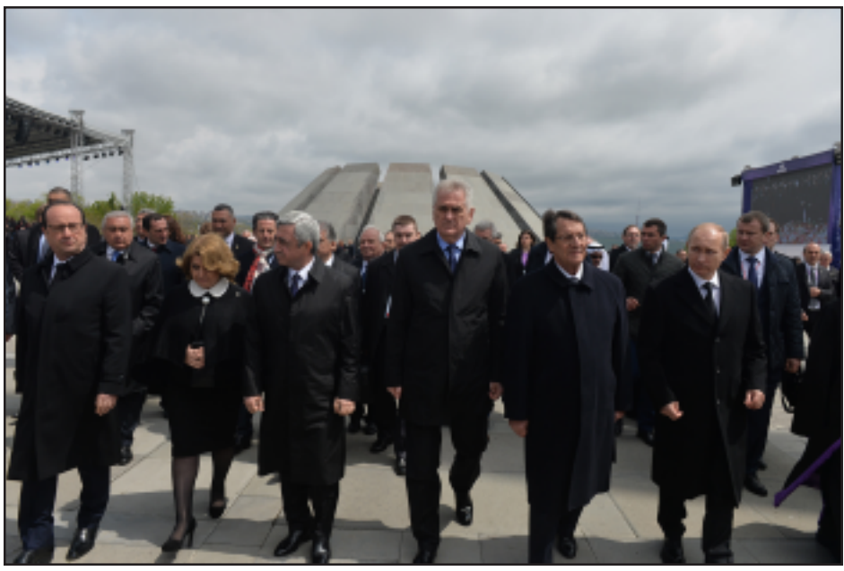
Ֆրանսայի, Հայաստանի, Սերպիոյ, Կիպրոսի եւ Ռուսաստանի նախագահները Միջոցառման ժամանակ

ԵՐԵՎԱՆ Ապրիլ 24-ի առաւօտեան, ներկայութեամբ Ռուսիոյ, Ֆրանսայի,