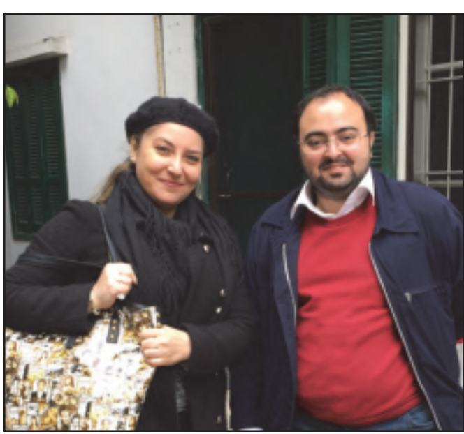
Գաղափարները Թուրքիոյ մէջ գործելու ունեցած են 1920էն կամ Քեմալիզմէն շատ առաջ: Ճիշդ է, մենք Սոցիալ Դեմոկրատ Հնչակեան կուսակցութեան անդամ չենք, սակայն մեր ապրած հողերուն վրայ սոցիալիզմի առաջին քայլերը նետողները մեր մշակութի մէկ անբաժան քաղաքացիներն են եւ Փարամագն ու Քսան կախաղանները մեր, սոցիալիստներու եւ աշխարհի համայն յեղափոխականներու հերոսներն են, հետեւաբար մենք անոնց գաղափարախօսութեան ջահակիրներն ենք, եւ անոր համար ալ անոր նահատակութիւնը կ'ոգեկոչենք ամէն տարի: Մեզ կը համախմբէ Փարամագներու եւ Քսաններու գաղափարները, մտածելակերպը, պայքարը, աշխարհամտածելակերպը:

կը մասնակցին, այլեւ մեզի կ'աջակցին միւս համայնքներէն: Մենք Թուրքիոյ «Ազգերու Ժողովրդավարութիւն» կուսակցութեան, սոցիալիստներու կողմէ հիմնադրուած HDPի անդամ ենք: Մեզի կը կոչեն սոցիալիստ հայեր: Սակայն մենք բոլորին՝ քաղաքական շրջանակներուն թէ ապահովական մարմիններուն սորվեցուցած ենք գէթ երկու բառ՝ «Նոր Զարթօնք»: Պէտք է նաեւ ազնիւ ըլլանք եւ խոստովանինք որ Հրանդ Տինքի սպանութենէն ետք ինչպէս կ'ընէ ասացուածքը՝ «Հովը մեր կռնակէն կը փչէ» հետեւաբար մեզի կը մնայ միայն առաջատունը բանալ եւ սլանալ: Հ. Խօսեցաք հրատարակութիւններու մասին, որոնցմէ յատկանշական է Հայկեան Քսան կախաղաններէն Փարամագիճ Ուիլիամսոնը: Կարելի՞ է մանրամասնել: Պ. Փարամագիճ նուիրուած այս հատորը գրած է Քատրը Աքրն, որ հիմնադիրներէն մէկն է HDPի: Ան միայն վերջերս սկսած էր հետաքրքրուիլ Փարամագով, այսինքն՝ հազիւ երկու տարի: 2007ին՝ երբ «Նոր Զարթօնք» շարժումը հիմնադրուեցաւ, Թուրք ձախակողմեան շարժումներուն դիմելով անոնց նկատել տուինք որ սոցիալիստական եւ յեղափոխական