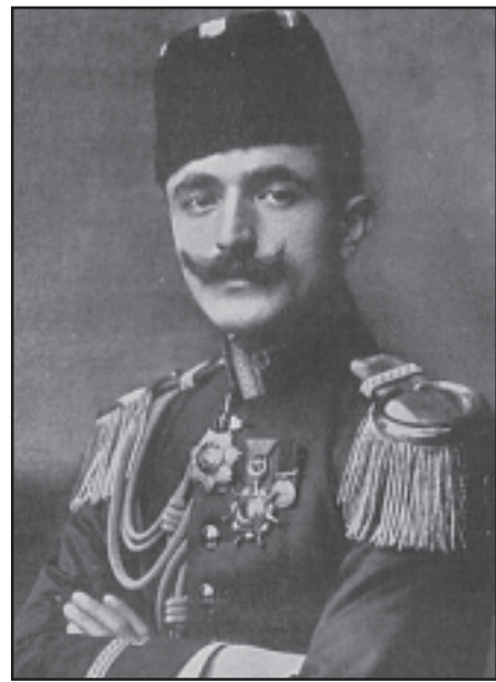
«ԷՆՎԷՐ ՀԱՅԿԱԿԱՆ ՀԱՐՑԻ ՄԱՍԻՆ»

«Ես Հայկական հարցը լուծելու համար երբեք ամսուան մէջ աւելի գործ տեսայ, քան Ապտիւլ Համիտ 30 տարուան մէջ»: