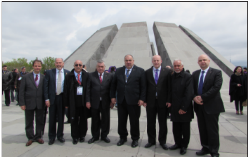
ՄԴՉԿ պատուիրակութիւնը մասնակցել է Ետֆ Միծեռնակաբերդի պաշտօնական արարողութեան

Այնթէպ քաղաքին մէջ քրտական ժողովուրդներու Դեմոկրատական կուսակցութեան անդամները 1915-ի Հայոց Ցեղասպանութեան գոհերուն յիշատակին հա-