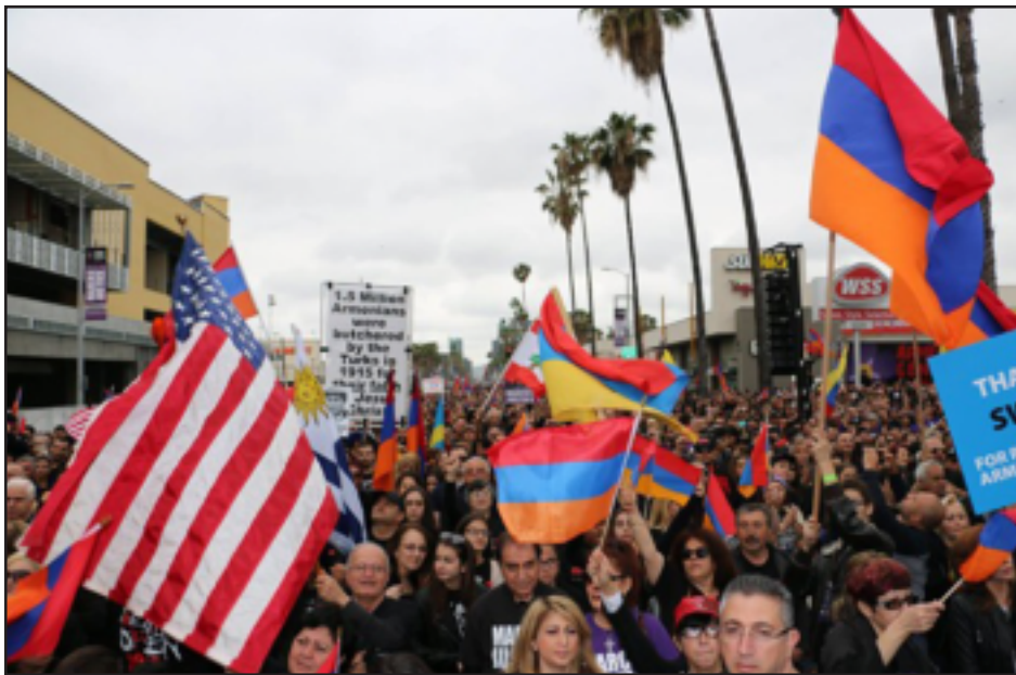
Լոսանճելոսի քաղաքացիները կը տոգանցեն Հոլիվուտի պողոտաներով

Լոս Անճելոսի քաղաքացիները կարսեթի եւ ուրիշներ: