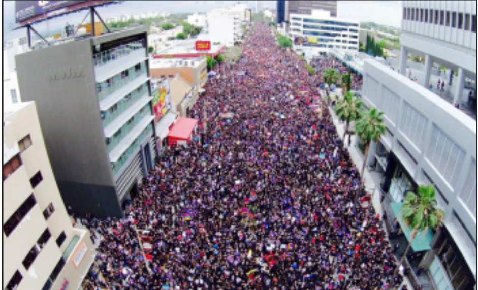
Մոնթրէալի քաղաքացիները Հայոց Ցեղասպանութեան խիտ շարքերը՝ Լոս Անճելըսի «Ռիշըր» պողոտային վրայ

Սերպիոյ եւ Կիպրոսի նախագահներուն, Միջոցառման ժամանակ մէջ տեղի ունեցաւ հարիւրամեակի յիշատակի կեդրոնական հանդիսութիւնը: Նախագահները եւ պաշտօնական հիւրերը նախ ծաղիկներ զետեղեցին, ապա նախագահ Սերժ Սարգսեան արտասանեց ուղերձ մը: