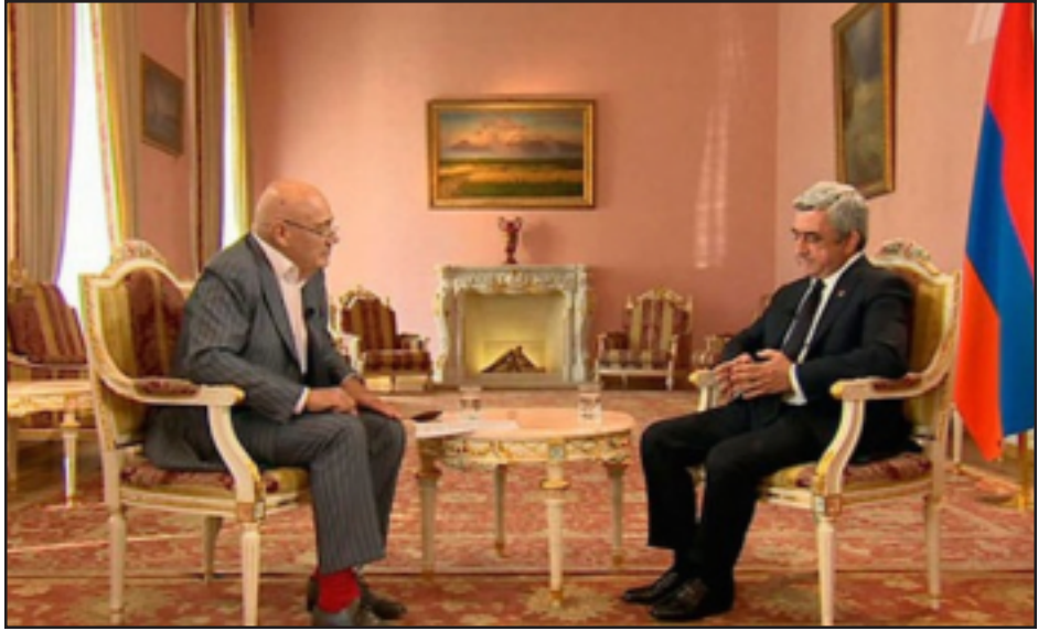
Ռուս յայտնի լրագրող Վլադիմիր Պոզներ հարցազրոյց կ'ունենայ Սերժ Սարգսեանի հետ

Ռուս յայտնի լրագրող Վլադիմիր Պոզներ Ռուսաստանեան ալիքով իր հեռատեսիլի հաղորդման ընթացքում հիւրընկալել է Հայաստանի նախագահ Սերժ Սարգսեանին: