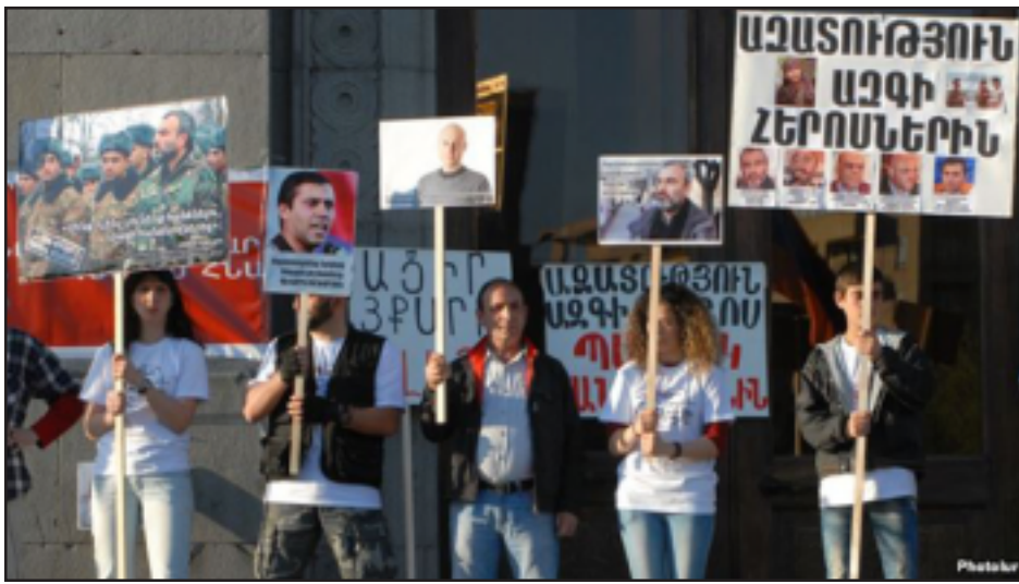
Հիւմնադիր Խորհրդարանի կալանաւորուած անդամներու ազատ արձակման պահանջով ցոյց երեւանի մէջ

Հիւմնադիր Խորհրդարան (ՀԽ) ընդդիմադիր կառույցը ներկայացնող մի խումբ երիտասարդներ պատասխանատու ու կոչերով եղան մի քանի եւրոպական դեսպանատներ, Ազգային ժողովի, գլխաւոր դատախազութեան եւ վերջում ՄԱԿ-ի գրասենեակի առջեւ: