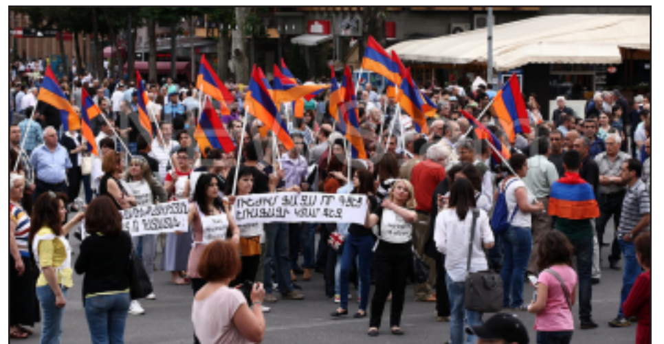
Երեւանի մէջ հազարաւոր ցուցարարներ կը բողոքէն Ելեքստրական հոսանքի գինի բարձրացման դէմ

«Առանց այդ էլ էլեկտրաէներգիայի ներկայիս գինը խիստ անհիմն է, եւ անցած տարուէ մենք զգացել ենք դրա բացասական ազդեցութիւնը երկրի տնտեսութեան վրայ», - ըսաւ ակտիւստը՝ կարծիք յայտնելով, որ հոսանքի հեր-