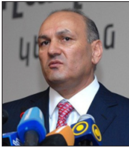
Ֆինանսների նախարար Գազիկ Խաչատրեան

Լրագրողների հետ հանդիպման ամենակարգ ֆինանսների նախարար Գազիկ Խաչատրեանը դեռ քրտնած չէր: Յետոյ նա ձեռք վերցրեց թաշկինակը: Հնչող հարցերը նրա ընտանիքին պատկանող բիզնեսների մասին էին. «Դուք էլ հարցը կտաք էն իմ ընտանիքի անդամներին, ովքեր դրանով զբաղվում են»: