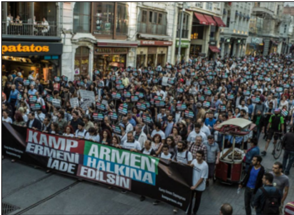
Պոլսոյ մէջ հայերու կողմէ բողոքի ցոյց՝ «Քեմալ Արմէնի» քանդումի դէմ

Թրքահայերը լուրջ յաջողութեան հասան ու կարողացան կանխել Պոլսոյ Թուրքա թաղամասին վրայ գտնուող «Հայկական ճամբարի» քանդումը: