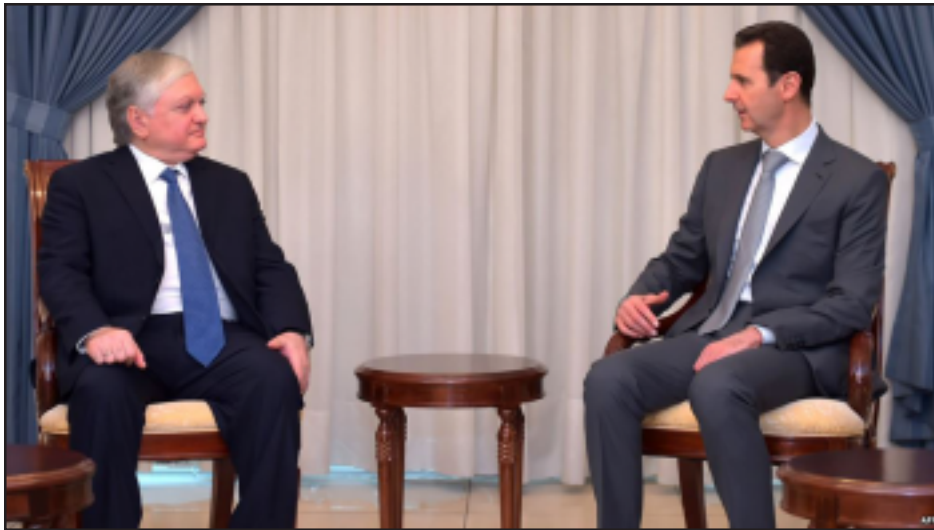
Armenian FM Edward Nalbandian meeting with Syrian President Bashar al-Assad

DAMASCUS -- Armenian Foreign Minister Edward Nalbandian visited Damascus on Wednesday where he met with Syrian leaders. Speaking at a joint press conference with his counterpart Walid al-Moallem, Nalbandian expressed serious concern at the plight of ethnic Armenians remaining in Syria. “We are deeply concerned about the ongoing clashes in Syria, the humanitarian crisis and the disasters resulting from the terrorists’ operations here,” Nalbandian said.