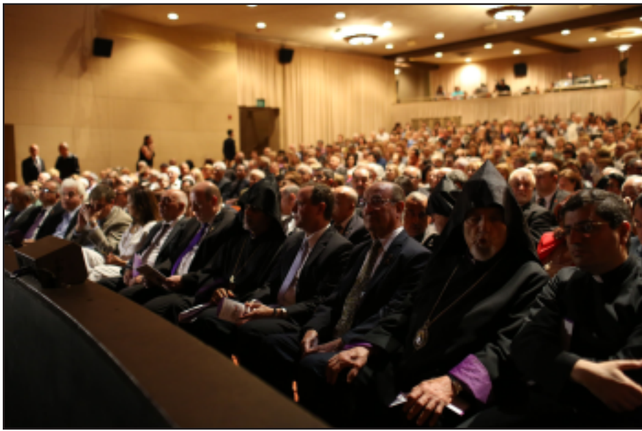
Տեսարան մը հանդիսասրահէն