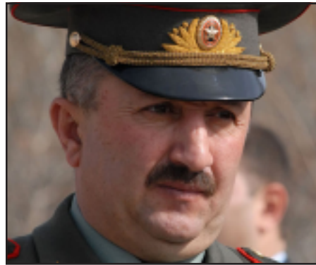
ՀՀ Ջինուած ուժերի Գլխաւոր շտաբի պետի տեղակալ նշանակուած Մոլվսե 3ակոբեան

Հարցին՝ այս փոփոխութիւնը կարո՞ղ է ազդել ԼՂ Ջինուած ուժերի մարտունակութեան վրայ, Գ. Կարապետեանը պատասխանեց, թէ կարծում է՝ ազդեցութիւնը շատ քիչ կը լինի. «Սկզբնական