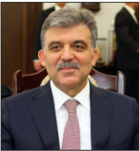
Թուրքիայի նախկին նախագահ Աբդուլահ Գիւլ

«Այս գործընթացը բացեց դէպի արձանագրութիւններ տանող ճանապարհ», - նշել է նա: Ըստ Սեւերի Գիւլի համար կարեւորա-