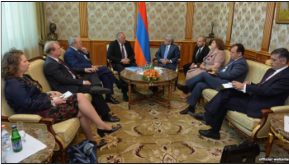
ԵՆԽՍՎ Հայաստանի հարցով համագեկուցողներ ու հանդիպումը Սերժ Սարգսեանի հետ

Հայաստանում սահմանադրական բարեփոխումների հիմնական նպատակը պետք է լինի քաղաքական բազմակարծություն, Ազգային ժողովի առջև կառավարությունից պատասխանատվության ու վերջնական արդիւնքում՝ քաղաքական համակարգի նկատմամբ հասարակության վստահության ամրապնդումը: Անցած շաբաթ երեւան կատարած այցից յետոյ, այս մասին յայտարարել են Եւրոպայի խորհրդի նորհարանական վեհաժողովի (ԵՆԽՍՎ) Հայաստանի հարցով համագեկուցողներ Աքսել Ֆիշերն ու Ալան Միլլը: Ողջունելով համակարգային թերութիւնները սահմանադրական բարեփոխումների միջոցով շտկելու Հայաստանի իշխանութիւնների ցանկութիւնը՝ ԵՆԽՍՎ-ի մոնիթորինգի յանձնաժողովի համագեկուցողները միաժամանակ ընդգծում են, որ քաղաքական ուժերը տրամագծորէն հակառակ տեսակէտներ ունեն այս բարեփոխումների, յատկապէս կառավարման համակարգի փոփոխութեան՝ կիսանախագահականից խորհրդարանականի անցնելու շուրջ: