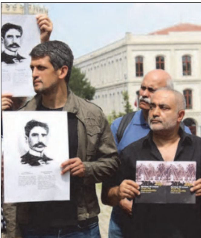
MP Garo Paylan Commemorating the Martyrdom of Paramaz at Sultan Beyazid square in 2013

Paylan stated to Agos daily that the HDP's victory had come as a result of 4 years of hard work, and said, "We