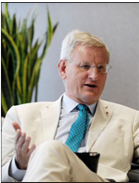
Շուէդիայի նախկին վարչապետ, ԱԳ նախկին նախարար Կառվ Քիլդու

«Այսօր Մոսկուայի քաղաքային դատարանում վերաքննիչ բողոքի քննման ժամանակ ես եւ իմ պաշտպանելը ներում շնորհելու միջնորդութիւն ենք ներկայացրել: Դատարանը բաւարարել է միջնորդութիւնը, եւ Միրզոյեանը