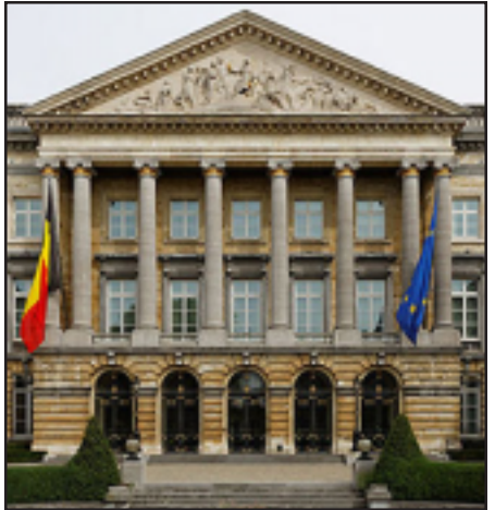
Եւ «Ֆլամանդական շահ» կուսակցութիւնը:

Սակայն բանաձեւի իրենց նախագծերն են ներկայացրել նաեւ «Մարդասիրական ժողովրդավարական կենտրոն» կուսակցութիւնը, Սոցիալիստական կուսակցութիւնը