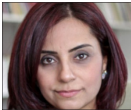
Թուրքիոյ խորհրդարանի անդամ Սելինա Տողան

«Անգարայի Միտքի Ազատութեան» նախաձեռնութեան կողմէ յայտարարութիւն մը տարածուած է, որ խիստ քննադատութիւն կը հնչեցնէ վերջին շրջանին «Ազգայ-