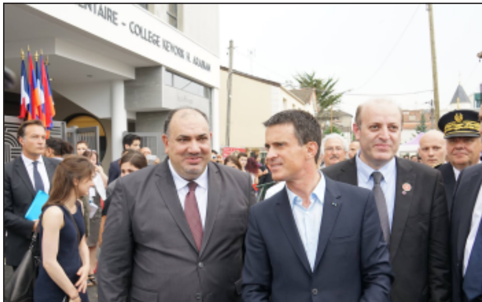
Երեսփոխան Սեպուհ Գալսիաբեան, Ֆրանսայի վարչապետ Մանուէլ Վալս եւ Ա.Գ.Հ.Կ.-ի առեւտրային Յակոբ Տիգրանեան

Օճախը եւս մէկ անգամ կ'ազ դարարէ, որ մեր ժողովուրդի բնաջնջումը ծրագրած Օսմանեան կայսրութեան քաղաքականութիւնը ի դերեւ եղած է, որ հայերը կ'ապրին եւ կ'արարեն անկախ բնակչութեան վայրէ: Մեր հայրենակիցները Ֆրանսայի մէջ կրցած են ընդելուզուիլ, դառնալ այս երկրի օրինապաշտ քաղաքացիներ, աշխատիլ եւ ստեղծագործել՝ ի բարօրութիւն իրենց երկրորդ հայրենիքի: Միաժամանակ, դուք ամուր կառչած մնացած