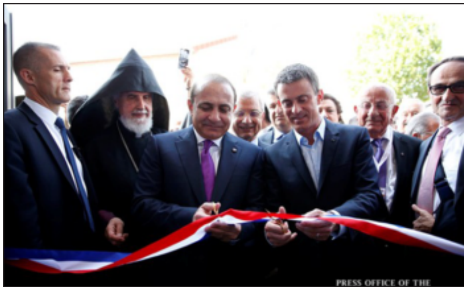
Հայաստանի եւ Ֆրանսայի վարչապետները կը կատարեն վարժարանի բացումը

Յուլիս 4-ին Ալֆորվիլ քաղաքին մէջ Հայաստանի եւ Ֆրանսայի վարչապետներ Յովիկ Աբրահամեանի եւ Մանուէլ Վալսի մասնակցութեամբ տեղի ունեցած է հայկական վարժարանի բացման արարողութիւնը, կը հաղորդէ ՀՀ կառավարութեան մամուլի եւ հասարակութեան հետ կապի վարչութիւնը: