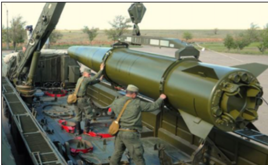
«Իսկանտեր-Մ» տեսակի հրթիռներու մէկ օրինակը

Ռուսաստանի Հայաստանի հետ բանակցութիւններ կը վարէ «Իսկանտեր-Մ» տեսակի հրթիռային համակարգեր մատակարարելու շուրջ, բայց պայմանագիրը տակաւին ստորագրուած չէ: Այս մասին ռուսական պետական ԹԱՍՍ լրատուական գործակալութեան յայտնած է Ռուսաստանի ռազմական արտադրութեան բնագաւառի մէկ աղբիւրը՝ շեշտելով, որ նման համաձայնագրերու վերաբերեալ ամբողջ տեղեկատուութիւնը զաղտնիք է: