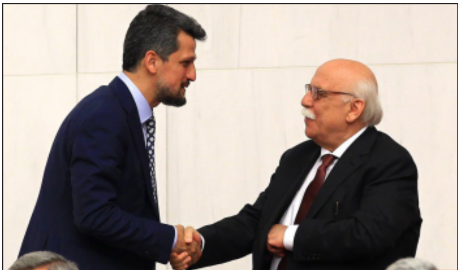
Երեսփոխան Կարո Փայլան եւ Կրթութեան նախարար Նապի Ավնըյի

Ակօսի 1000-րդ համարին գուգադիպող բարեփոխումներէն մէկն է դպրոցներու արձանագրման ընթացքին գործադրուած ցեղային գաղտնագիրի վերացումը: Կրթութեան նախարար Նապի Ավնըյի ստորագրութեամբ հրատարակուած շրջաբերականը վերջ տուաւ քրիստոնեաներու դպրոցներէ ներս խտրականութիւն տածող ցեղային գաղտնագիրի գործադրութեան: Այսուհետեւ արձանագրութեան լիազօրութիւնը յանձնուած է դպրոցներու տնօրէնութեան: Բացի այդ, թրքերէնով դասաւանդուած աւարկաներու ուսուցիչներուն պաշտօնավարման տեսողութիւնն ալ պիտի ճշդուի տնօրէնութեան կողմէ: