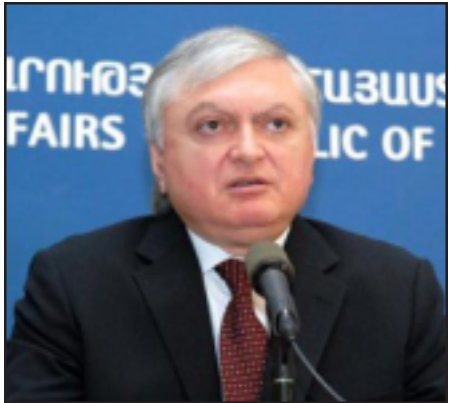
Հայաստանի արտգործնախարար Էդուարդ Նալբանդեան

Խօսելով սիրիահայերի գաղթի մասին՝ ԱԳ նախարարը նկատել է. «Այսօր մենք Հայաստանում ունենք մօտ 14 հազար սիրիահայ: