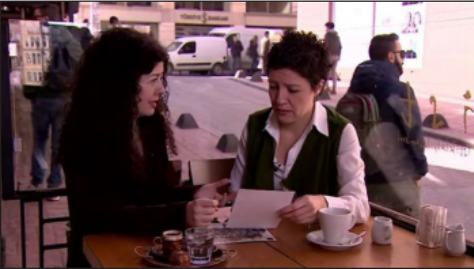
«Յիշելով Հայկական Ջարդերը» ֆիլմի հեղինակները Լարա Պետրոսեան եւ Ռենջին Արսլան

Երեւանի Մեդիա նախաձեռնությունների կենտրոնում կայացավ BBC-ի լրագրող Լարա Պետրոսեանի նկարահանած «Յիշելով Հայկական Ջարդերը» (Remembering the Armenian Massacres) վաւերագրական ֆիլմի ցուցադրությունը: