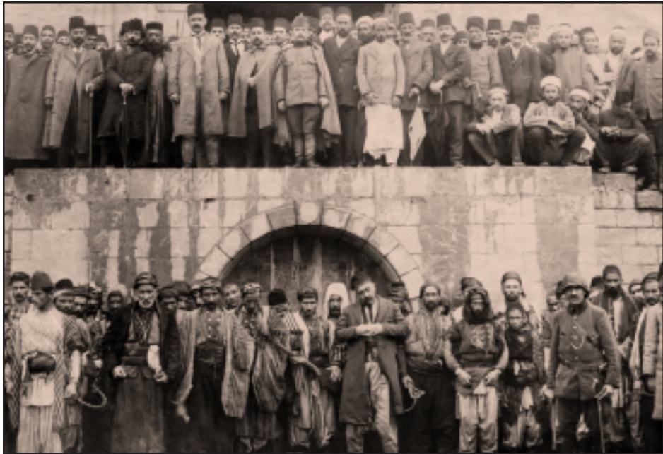
Վերելու. Օսմանեան նահանգապետ Հայրաբ փաշան իր զինուորացիներին, մերթնու. հայերը կոտորածից առաջ, 1915 թ. Ապրիլ

Հայոց ցեղասպանութեան փառապանակը իրապէս պատմաբանները յաճախ ուշադրութիւնից դուրս են մնում՝ տեղի գիշերով բարոյական եւ զգացմունքային ընկալումներին: Սպանացի յօդուածագիր Մարիօ Դուրանը, անդրադարձ կատարելով Ցեղասպանութեան իրագործման պատմաբաններին, խօսում է այս հանգամանքների մասին՝ նշելով թուրք Էլիտայի գործունէութիւնը, ինչպէս նաեւ թուրքերի՝ որպէս ժողովուրդ եւ պետութիւն գոյութեան պայմանը: Ստորեւ ներկայացնում ենք Դուրանի՝ drugstormag.es կայքում տեղադրուած յօդուածը: