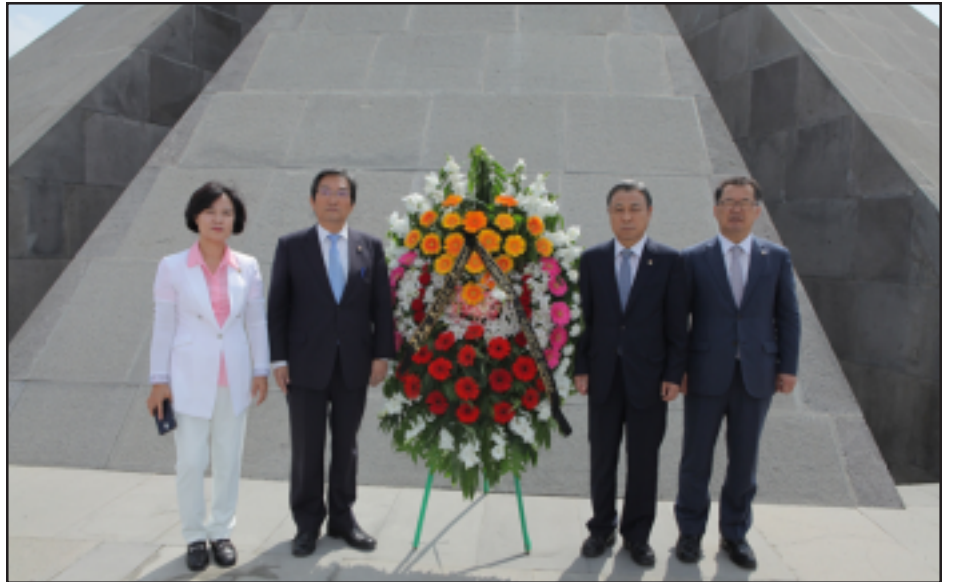
Քորիացի խորհրդարանականները կը յարգեն Հայոց Յեղասպանութեան գոհերը

Պաշտօնական այցով Հայաստանում գտնուող՝ Հայաստան-Քորիա բարեկամութեան միջխորհրդարանական խմբի պատուիրակութիւնը՝ համանախագահ Նո Յոնգ Մինի գլխաւորութեամբ, Յուլիսի 17-ին Միծեռնակաբերդում շարժանքի տուրք է մատուցել Հայոց Յեղասպանութեան գոհերի յիշատակին: Պատուիրակութեան անդամները նաեւ այցելել են Հայոց Յեղասպանութեան թանգարան-ինստիտուտ, ծանօթացել Հայոց մեծ եղեռնը հաւաստող փաստաթղթերին ու վաւերագրերին, դիտել լուսանկարներն ու ցուցանմուշները, գրառումներ կատարել յուշամատեանում, տեղեկացնում է ՀՀ Աժ տեղեկատուութեան եւ հասարակայ-