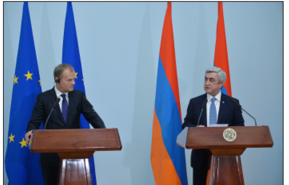
Տոնալտ Թուսքի եւ Սերժ Սարգսեան Երեւանի մէջ կայացած միատեղ ասուլիսի ժամանակ

Երեւան այցելութեան ընթացքին նախագահ Սերժ Սարգսեանի հետ միատեղ ասուլիսի ժամանակ Եւրոպական խորհուրդի նախագահ Տոնալտ Թուսք յայտարարեց, որ Հայաստանն ու Եւրոպական Միութիւնը աւարտած են նոր եւ համապարփակ համաձայնագրի նախնական բանակցութիւնները: