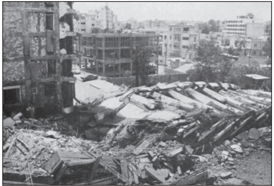
«Աթիլլա» գործողութեան հետեւանք

Կիպրոսի մէջ 1955-էն բռնկած հակազաղութատիրական պայքարը ժողովուրդին կուռքը համարուող Մաքարիոս Գ. Արքեպիսկոպոսին գլխաւորութեամբ յանգեցաւ կղզիին անկախութեան: Կիպրոս որպէս անկախ պետութիւն միացաւ միջազգային մեծ ընտանիքին, սակայն Լոնտոն միշտ ալ իր թաթը պահպանեց կղզիին վրայ՝ որպէս կարանթէօր կողմ Յունաստանի եւ Թուրքիոյ կողքին: Աւելին, ցայսօր Կիպրոսի մէջ անվարձահատոյց կերպով հաստատուած են անգլիական ռազմապահները,