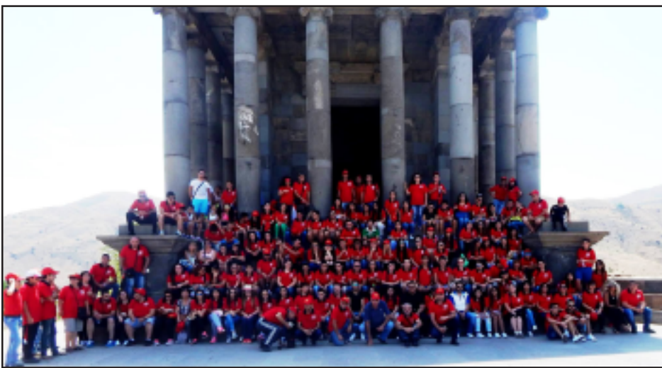
Բանակումի մասնակիցները Գառնի տաճարի մուտքին

Օգոստոս 9-ի առաւօտեան կանուխ ժամերէն իսկ, Մաղկաձորի լեռներուն վրայ թառած «Արի Տուն» ծրագրի յատուկ ճամբարային շէնքը կը վիտար իւրաքանչեւ աշխուժութեամբ: