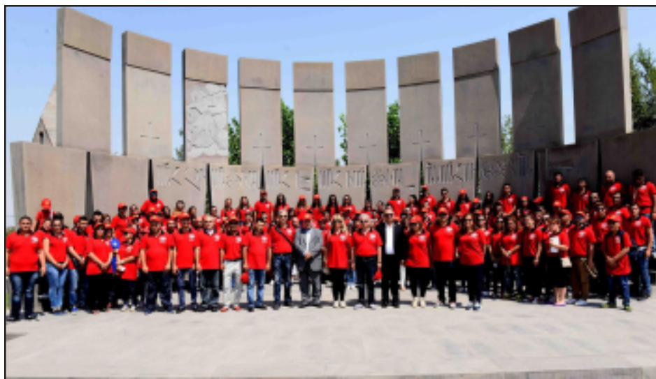
Հնչակեան Երիտասարդներու այցելութիւնը Ետարուր