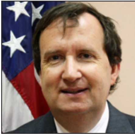
ԱՄՆ դեսպան Ռիչըրտ Միլս

ԱՄՆ-ն պատրաստ է Հայաստանի կառավարութեանն օգնել կոռուպցիայի դեմ պայքարում: Այս մասին Օգոստոսի 25-ին, «114 սոցիալական թէժ գիծ» ծառայութեան 3-ամեայ աշխատանքի արդիւնքներին նուիրուած միջոցառման ժամանակ լրագրողների հետ զրոյցում ասաց Հայաստանում ԱՄՆ դեսպան Ռիչըրտ Միլսը: