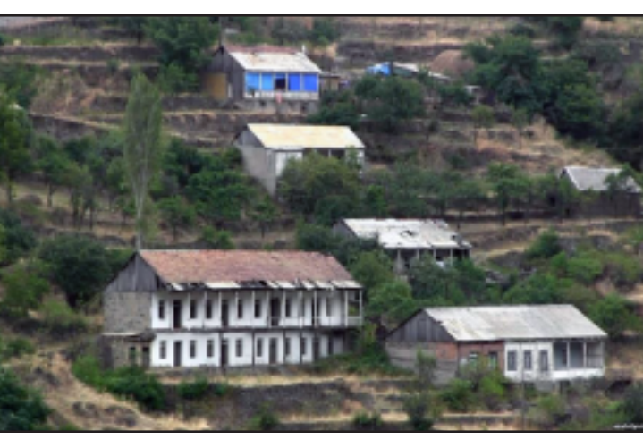
Տեսարան Լոռու մարզի յունաբնակ Մադան գիւղէն

Լ ո ո ո ւ մարզի առաւելապէս յունաբնակ Մադան գիւղի երբեմնի ե ո ա յ ա ը կ դպրոցի շէնքից այժմ միայն մի պատ է մնացել: Դատարկուած գիւղում միայնակ մնացած յուն ծերունիներն ափսոսանքով պատմում են, որ տարիներ առաջ քաղաքներից «մեծաւորներն են եկել», հակա չէնքը շինանիւթի վերածելու վաճառել: