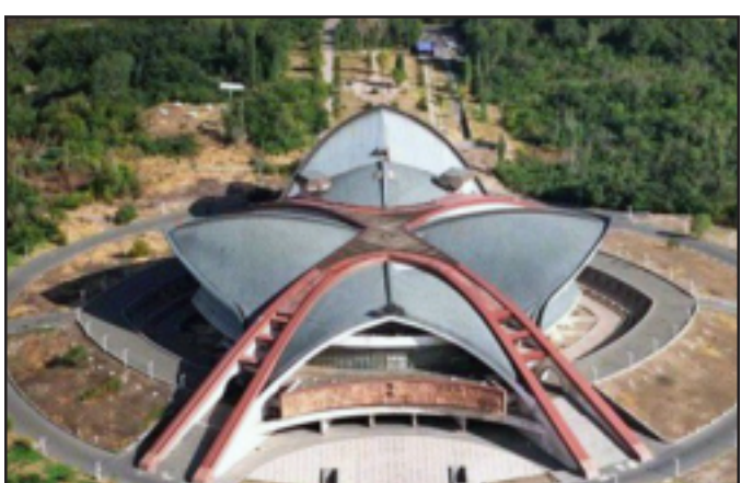
Մարզահամերգային համալիրը Երեւանի մէջ