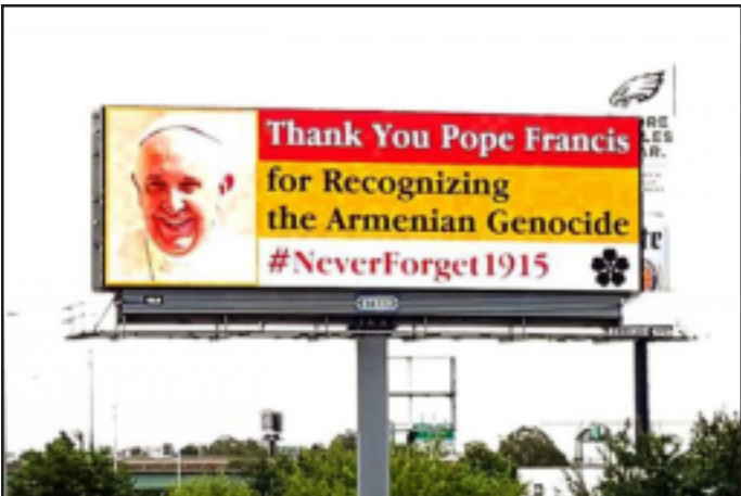
Ֆիլատելիոյ մայրուղիներուն վրայ յայտնուած ցուցատախտակներէն մին

Սեպտեմբեր 22-ին, Հռոմի Ֆրանչիսկոս Պապը հովուապետական այցելութեամբ Ժամանեց Միացեալ Նահանգներ, ուր Սպիտակ Տունէն ներս պաշտօնական ընդունելութեան արժանացաւ նախագահ Պարաք Օպամայի կողմէ: