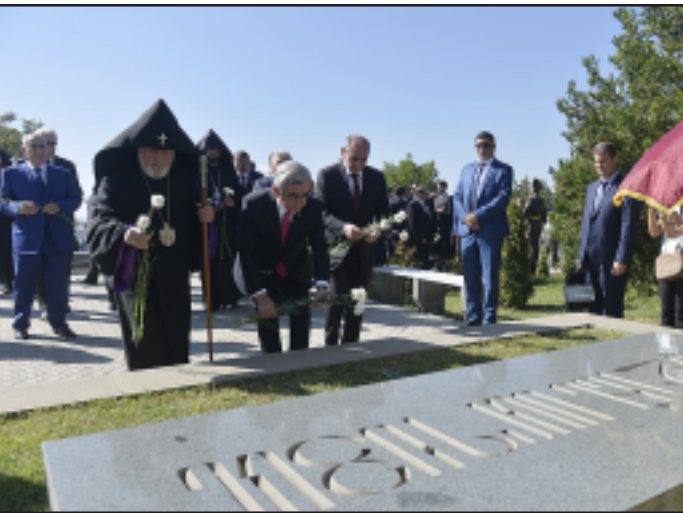
Գարեգին Ա., Սերժ Սարգսեան եւ Բակո Սահակեան Երազուրի այցելութեան ընթացքին

Հայաստանի Հանրապետութեան անկախութեան 24-րդ տարեդարձին առթիւ, նախագահ Սերժ Սարգսեան, ԼՂՀ նախագահ Բակո Սահակեան, Ամենայն Հայոց Կաթողիկոս Գարեգին Ա. եւ բարձրաստիճան աջակցողներ Սեպտեմբեր 21-ին այցելեցին Երազուրի պանթէոն, ուր յարգանքի տուրք մատուցեցին հայրենիքի ազատութեան համար զոհուած հայորդիներու յիշատակին: