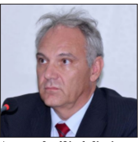
Հայաստանում Գերմանիայի նորանշանակ դեսպան Մաթիաս Քլինգենբերգ

Եւրամիութեան դռներն, իհարկէ, Հայաստանի համար փակ չեն: Այս մասին «Ազատութիւն» ռատիոկայանի հետ զրոյցում նշել է Հայաստանում Գերմանիայի նորանշանակ դեսպան Մաթիաս Քլինգենբերգը: Նրա խօսքով՝ պէտք է ուսումնասիրուեն բոլոր հնարաւորութիւնները՝ «Հայաստանի եւ Եւրամիութեան միջեւ յարաբերութիւններն աւելի սերտ դարձնելու համար»: