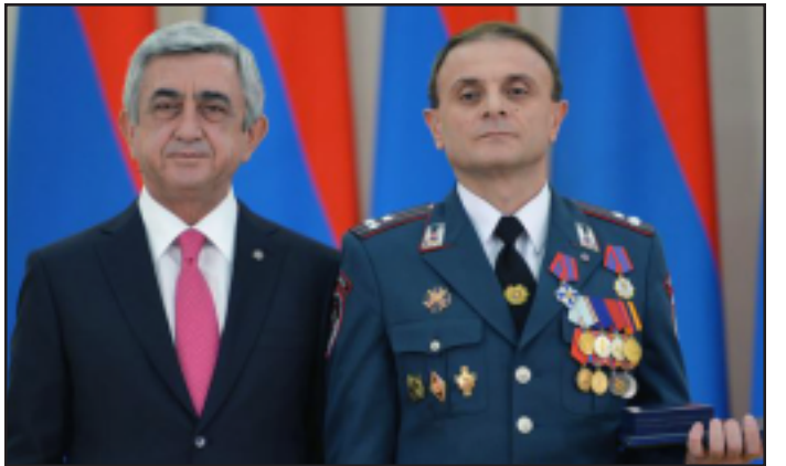
Սերժ Սարգսեան եւ Վալերի Օսիպեան պարգևատրում են

Երեւանի փոխստիկանապետ Վալերի Օսիպեանը պարգևատրուեց «Հայրենիքին մատուցած ծառայութիւնների համար» երկրորդ աստիճանի մեդալով, Քննչական կոմիտէի նախագահի տեղակալ, «Մարտի 1»-ի գործով քննչական խմբի նախկին ղեկավար Վահագն Յարութիւնեանին էլ շնորհուեց արդարադատութեան գեներալ-մայորի կոչում: