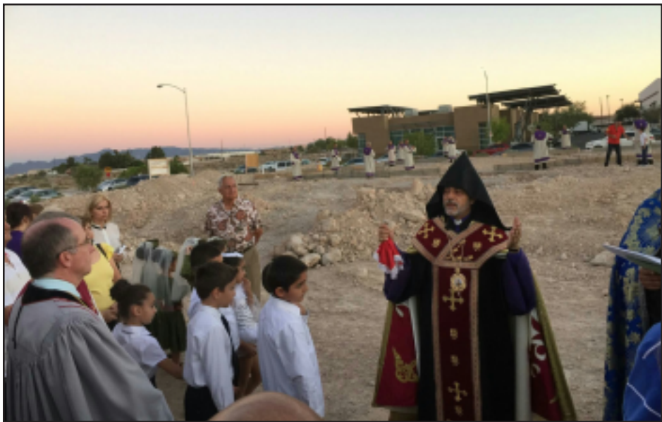
Տեսարան եկեղեցւոյ հիմնարկէփ արարողութենէ