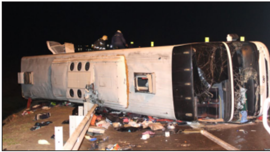
Մոսկուա - Երեւան մանապահին վրայ շրջուած մարդատարը

Նոյեմբեր 3-ի գիշերը Մոսկուա - Երեւան երթուղիի վրայ, Տուլայի մարզի մօտ տեղի ունեցած մարդատարի արկած հետեւանքով զոհուեցան ութը հայ ճամբորդներ, որոնց թիւը կրնայ բարձրանալ, նկատի առնելով որ կան նաեւ ծանր վիրաւորներ: