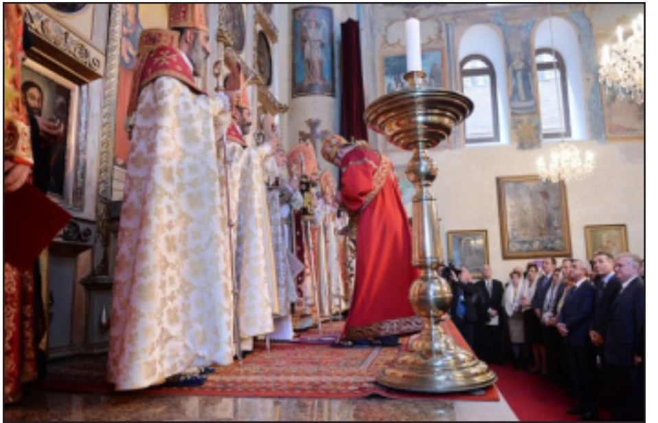
Գարեգին Բ. Ամենայն Հայոց Կաթողիկոսի ձեռամբ կը կատարուի եկեղեցւոյ օծումը

Նախագահ Սերժ Սարգսեանը եւ տիկին Ռիտա Սարգսեանը Ն.Ս.Օ.Տ.Տ. Գարեգին Բ. Ամենայն Հայոց Կաթողիկոսի, Վիրահայոց թեմի առաջնորդ Վազգէն եպիսկոպոս Միրզախանեանի, եկեղեցու վերականգնման ծրագրի դռնօրները, բազմաթիւ հիւրերի եւ Վիրահայոց թեմի հաւատացեալների մասնակցութեամբ ներկայ են գտնուել Թբիլիսիի հնագոյն եկեղեցիներից մէկի՝ հայկական Սուրբ Գեորգ առաջնորդանիստ եկեղեցու վերածման արարողութեանը, որը վա-