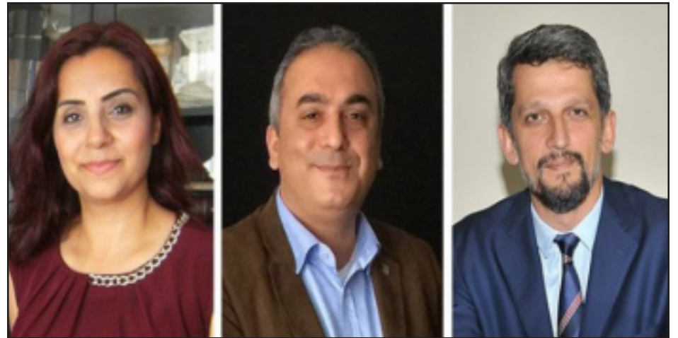
Selina Dogan Markar Esayan and Garo Paylan

ANKARA -- Three Armenians have been reelected to the Turkish Parliament as a result of the Sunday's preterm parliamentary election. They are HDP Istanbul MP Garo Paylan, CHP Istanbul MP Selina Dogan and AKP Istanbul MP Markar Esayan were re-elected to the parliament.