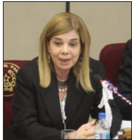
Պարագվայի սենատի անդամ Դեզիրէ Մասին

Պարագվայի խորհրդարանի կողմից Հայոց ցեղասպանութեան ճանաչումը կրնալ յանձնարարական գործընթացը եւ կօգնի փրկել պատմական յիշողութիւնը: Այդ մասին արժանթիւնական Agencia Prensa Armenia արժանթիւնական պարբերականին յայտնել է Պարագվայի սենատի անդամ Դեզիրէ Մասին, որը Պարագվայի Գոնկրէտում ներկայացրել էր Հայոց ցեղասպանութեան ճանաչման վերաբերեալ նախագիծը: