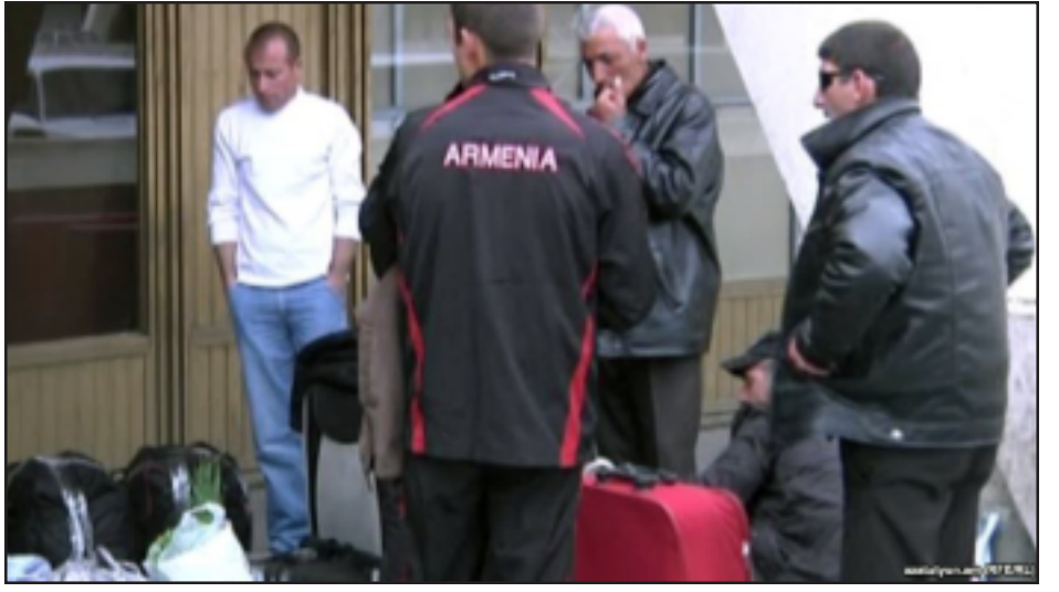
Հայաստանի Բաղաձայններ կը պատրաստուին մեկնել իրենց հայրենիքն. (Արխիւային նկար)

Պաշտօնական տուեալներով, ամէն տարի Հայաստանի բնակիչների թիւն առնուազն 30 հազարով նուազում է: Ընդ որում, վիճակագրութեան համաձայն, 2014 թուականին 2013 թուականի համեմատ Հայաստանից անվերադարձ հեռացողների թիւը 10 հազարով աւելի՝ 41 հազար է եղել: