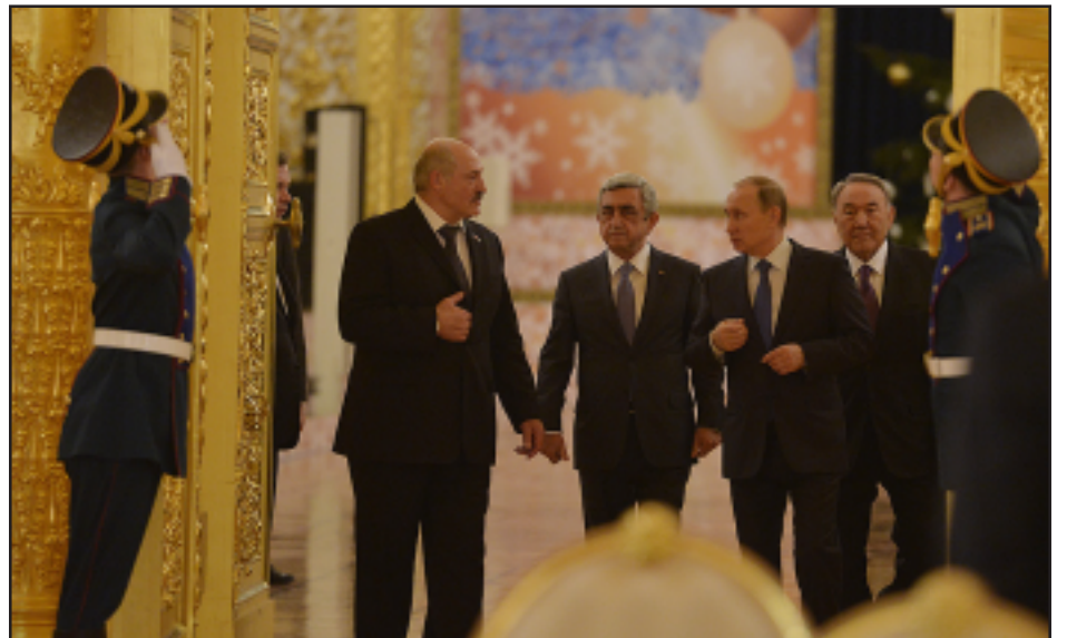
ՀԱՊԿ-ի եւ ԵՏՄ-ի նիստերուն մասնակցող երկիրներու դեկավարները Քրեմլինի մէջ

Ըստ Սարգսեանի, իւրաքանչիւր երկիր ունի իր շահերը, իր առաջնահերթութիւնները, բայց անոնք պէտք չէ հակադրուին մեր ընդհանուր շահերուն եւ փոխադարձ պարտաւորութիւններուն: «Ամէն անգամ, երբ Ատրպէյճանի զինուած ուժերը Հայաստանի Հանրապետութեան դէմ կիրառում են աւտոմատներ, սկանաւետներ եւ հրետանային սարքաւորումներ, նրանք կրակում են Աստանայի, Դուշանպէի եւ Բիշկէկի, Մոսկուայի եւ Մինսկի ուղղութեամբ: Յիշեցնեմ, որ մենք կանոնադրութեան մէջ ունենք համապատասխան յօդուած: Եւ եթէ մենք ոչ միայն չենք կիրառում այդ յօդուածը, չենք քննարկում ստեղծուած իրավիճակը, հարկ չենք համարում վերցնել լսափողը եւ հետաքրքրուել՝ ինչ է կատարում