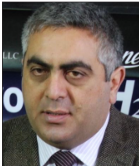
Հայաստանի պաշտպանութեան նախարարի խօսնակ Արծրուն Յովհաննիսեան

«Ինչի՞ ինքը տրամաչափը հասցրեց D-30-ի կամ տանկի՞ որովհետեւ նախորդ բոլոր միջոցներով խոցելուց յետոյ մէկ գինուոր, երկու գինուոր՝ մահացաւ հայկական կողմից, ինքը ստացաւ աւելի հուժկու հակահարուած, կամ թոյլ չտուեցինք, որ դրանից աւել ինքը աներ, դրան գումարած՝ ինքն իրա ընդհանուր խնդիրը տապալեց՝ իր