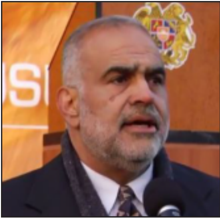
«Ժառանգութիւն» կուսակցութեան առաջնորդ Բաֆֆի Յովհաննիսեան

«Ժառանգութեան» առաջնորդը եւս մէկ անգամ կոչ արեց իրաւապահ համակարգի ղեկավարութեանը քրէական պատասխանատուութեան ենթարկել Դեկտեմբերի