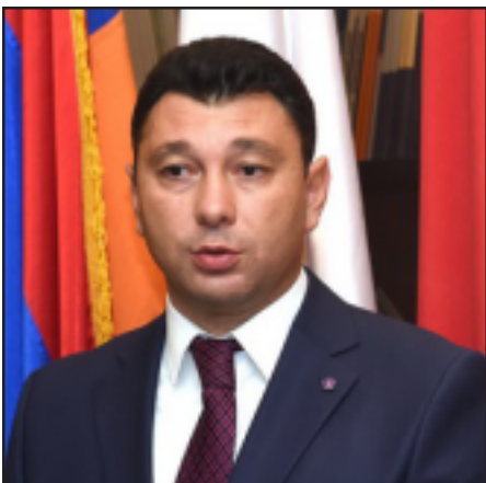
Ազգային ժողովի փոխնախագահ Էդուարդ Շարմազանով

Դիտարկմանը, թէ մեծամասնական ընտրակարգին հրաժեշտ ենք տալիս, բայց մարդիկ սովոր են իրենց տարածքից պատգամաւոր ընտրել, եւ հարցին, թէ մարդկանց զրկելու են այդ հնարաւորութիւնից, ՀՀԿ խօսնակը պատասխանեց. - «Նոր խորհրդարանը չի լինելու Երեւանի խորհր-