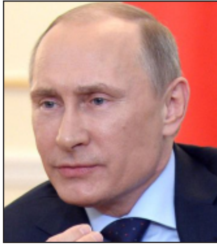
Ռուսաստանի Դաշնութեան նախագահ Վլադիմիր Պուտին

Նշենք, որ ըստ 60-ից աւելի երկրներում իրականացրած հարցման՝ ԱՄՆ նախագահին դրական է գնահատում հարցուածների 59