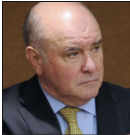
Ռուսաստանի արտաքին գործոց փոխնախարար Գրիգորի Կարասին

Ռուս Դիւանագէտը յայտնած է, որ Ռուսաստան կը հանդիսանայ հակամարտութեան կարգաւորմամբ զբաղուող միջազգային կառույցի՝ ԵԱՀԿ Մինսկի խումբի երեք համանախագահներէն մէկը եւ ակտիւ