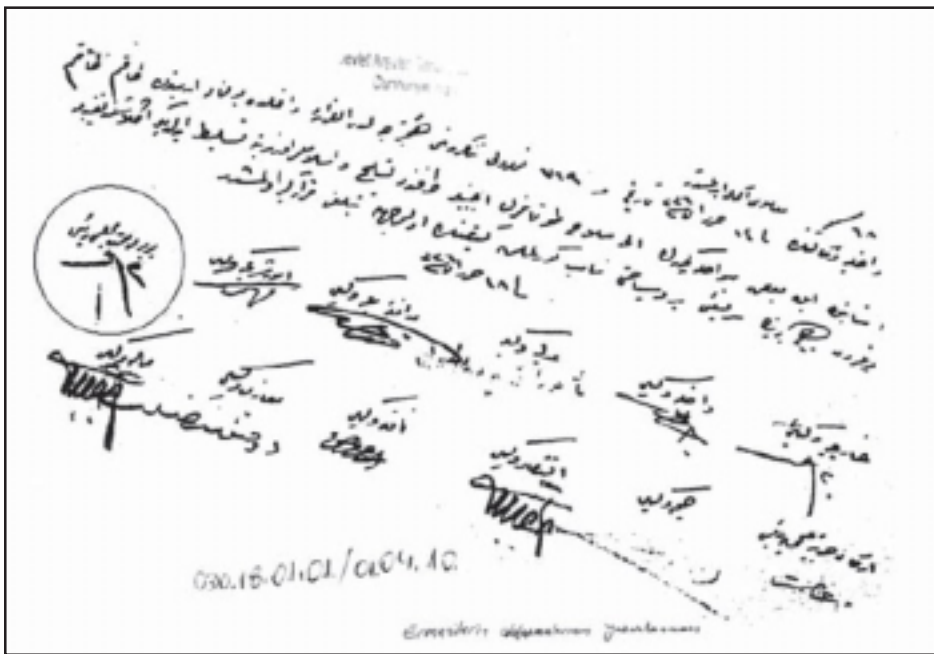
Document of a decision made by Ankara government, banning the Armenians' return (Mustafa Kemal's signature is encircled)

Y E R E V A N (ArmenianGenocide100.org) -- Numerous documents published by Turkish researches reveal that not only Young Turks but also founders of the Turkish republic have committed major crimes against Armenians.