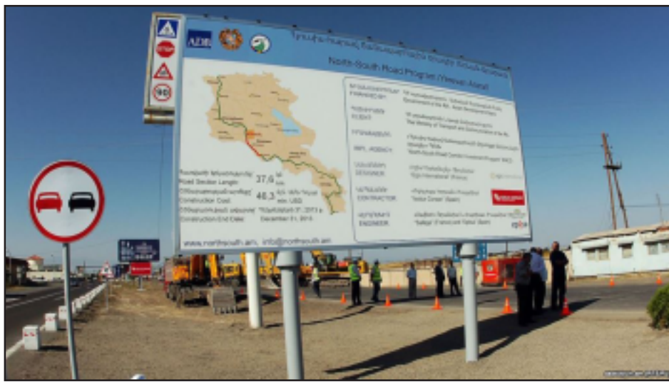
«Հիւսիս-հարաւ» նախագրի շինութեան հրապարակներէն մին

Մինչ իշխանութիւնները մեծ շուքով յանձնուած են «Հիւսիս-հարաւ» ավտոճանապարհի Երեւան-Արտաշատ, Երեւան-Աշտարակ հատուածները, ծրագիրը մշտադիտարկողները պնդում են՝ Հայաստանը դրա շրջանակում շարունակում է աւելացնել արդէն իսկ 1 միլիարդ դոլարի հասած պարտքը: