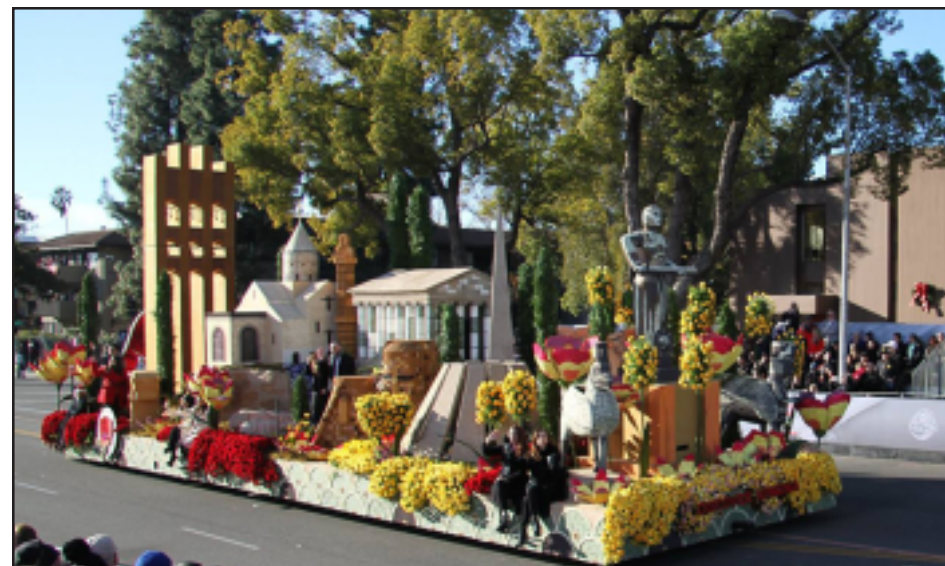
Հայկական ծաղկասայլը կը տողանցէ Փասատինայի Գոլոթրատօ պողոտային վրայ

Յունուար 1-ին, Փասատինայի Գոլոթրատօ պողոտային վրայ տեղի ունեցաւ վարդերու 127-րդ փառատօնը, որուն ընթացքին տողանցեցին մի քանի տասնեակ ծաղկասայլեր, ինչ նաեւ դպրոցական փողերախումբեր: