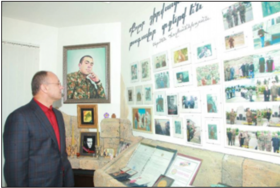
Տօնական օրերուն առթիւ Սէյրան Օհանեան կ'այցելէ գոհուած մարտիկներուն հարազատներուն

Հայաստանի պաշտպանութեան նախարար Սէյրան Օհանեանը ամառնորեայ ուղերձ է յղել, որում «առողջութիւն, երջանկութիւն եւ ամենախաղաղ խաղաղութիւն» մարտիկները գինձառայողներին, «արցախեան ազատամարտի գինակիցներին» ու գոհուած մարտիկներին հարազատներին, նշում է՝