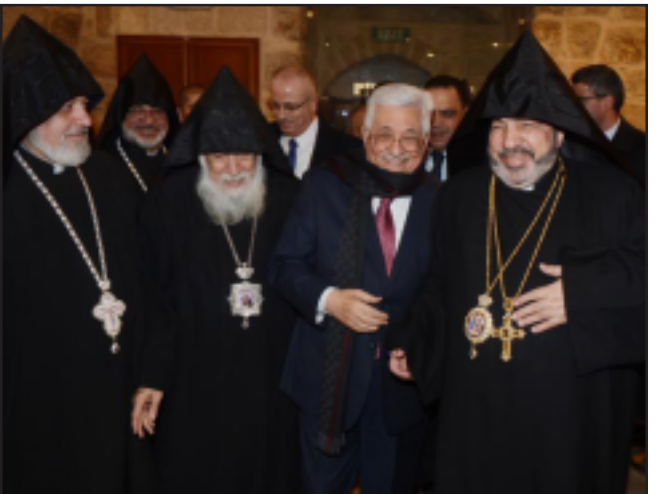
Նախագահ Ապպաս շրջապատուած հայ եկեղեցականներով

Եկեղեցական պատարագին յաջորդած պաշտօնական ընդունելութեան ընթացքին, Պաղեստինի նախագահը ելոյթ ունենալով ըսաւ, որ անոնք որոնք կոչ կ'ընեն Քրիստոնեաները եւ յատկապէս հայերը հեռացնելու մասին, պիտի չհասնին իրենց նպատակին: Հայերը միշտ պիտի մնան Երուսաղէմի, Բեթ-Նեղէմի եւ Ռամալլայի