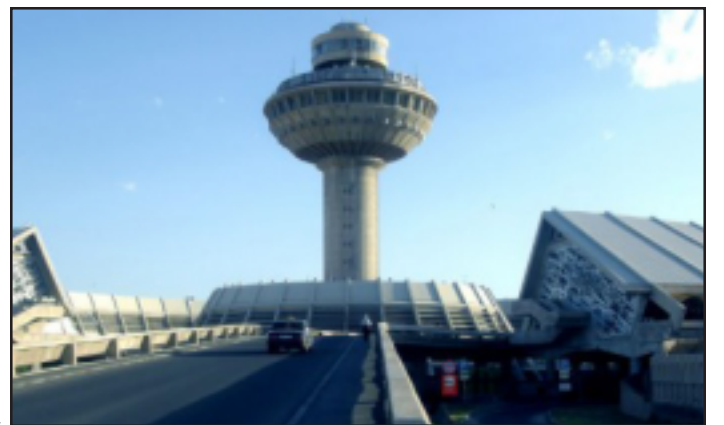
Երեւանի «Ձուարթնոց» օդանաւակայանի հին մասնաշէնքը

«Ձուարթնոց» օդանաւակայանի հին մասնաշէնքը վերջին շրջանի ճարտարապետութեան լաւագոյն կոթողներից մէկն է, մնայուն արժէք, որը դարձել է Հայաստանի դէմքը. լրագրողների հետ հանդիպման ժամանակ, խօսելով «Ձուարթնոցի» հին մասնաշէնքը