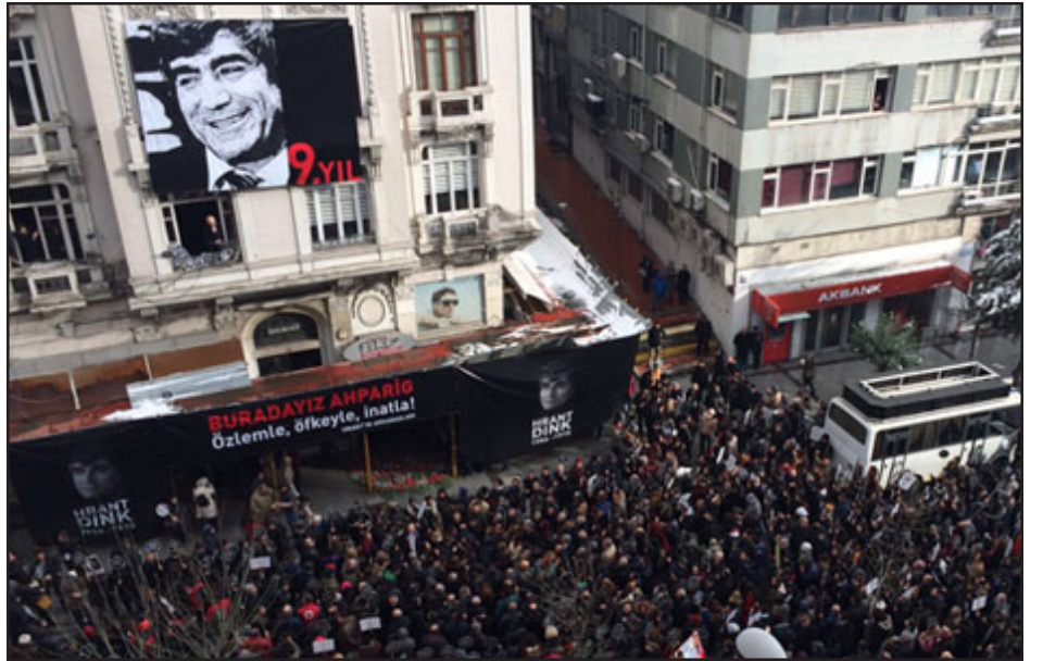
Թուրքիոյ հազարաւոր հաղափաքիներ հաւաքուած են Լիւնդոն Հրանդ Տիմրի Լահատակութեան 9-րդ տարելիցը

Պոլսահայ մտաւորական Հրանդ Տիմրի սպանութեան 9-րդ տարելիցին առթիւ, Յունուար 19-ին, հազարաւոր քաղաքացիներ հաւաքուած են Իսթանպուլի Շիրիթի թաղամասին մէջ գտնուող «Ակօս» թերթի նախկին խմբագրատան առջեւ, ուր տեղի ունեցած էր ոճրագործութիւնը: