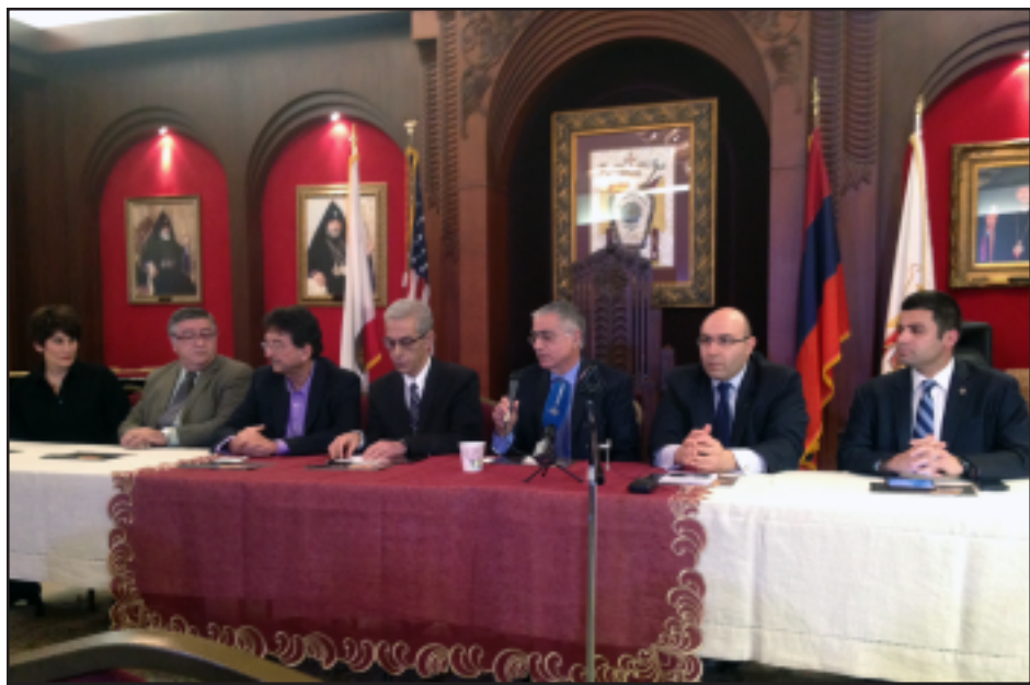
Տեսարան Սուրիահայութեան ի նպաստ տեղի ունեցող թելթոնի առթիւ կազմակերպուած մամուլայաժողովէն

Փետրուար 21-ին, Սուրիահայութեան ի նպաստ կայանալիք դրամահաւաք-թելթոնի առիթով, Լոս Անճելոսի մէջ տեղի ունեցաւ մամուլային ասուլիս մը, ներկայութեամբ հայկական թերթերու եւ հեռատեսիլի ընկերութիւններու ներկայացուցիչներուն եւ Սուրիահայութեան Օժանդակութեան Հիմնադրամի (ՍԱՐՖ) վարչութեան անդամներուն: