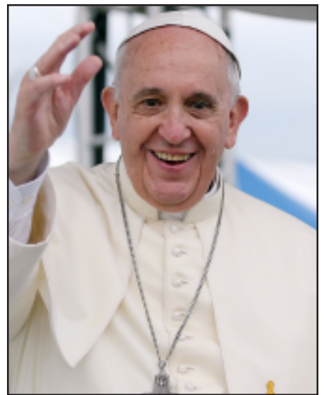
Հռոմի Պապ Ֆրանցիսկոս

Ֆրանցիսկոս Պապը նոյնպէս 2014 թուականի Նոյեմբերին ասել էր, որ Հայ եկեղեցու երեք պատրիարքներին խոստացել է այցելել