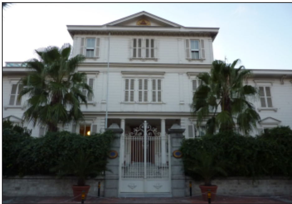
Պոլսոյ Հայոց Պատրիարքարանը

Սուլթան Մէհմէտ Բ. մասնաւոր ֆէրմանով մը (հրովարտակ) Հայոց Պատրիարքութեան իրաւա-