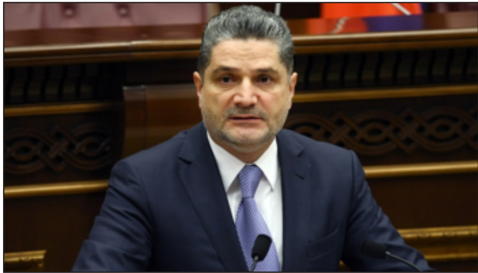
Հայաստանի նախկին վարչապետ Տիգրան Սարգսեան

Հայաստանի նախկին վարչապետ Տիգրան Սարգսեանը անցել է Եւրասիական տնտեսական յանձնաժողովի նախագահի պարտականութիւնների կատարմանը: Սարգսեանի թեկնածութիւնն այդ պաշտօնում հաստատուել էր 2015թ. Դեկտեմբերին Եւրասիական բարձրագոյն տնտեսական խորհրդի նիստում ԵՏՄ նախագահների կողմից: Սարգսեանը փոխարինել է ՌԴ ներկայացուցիչ Վիկտոր Խրիստենկոյին: Բացի այդ, փոխուել է նաեւ Յանձնաժողովի կազմը: Եթէ նախ-