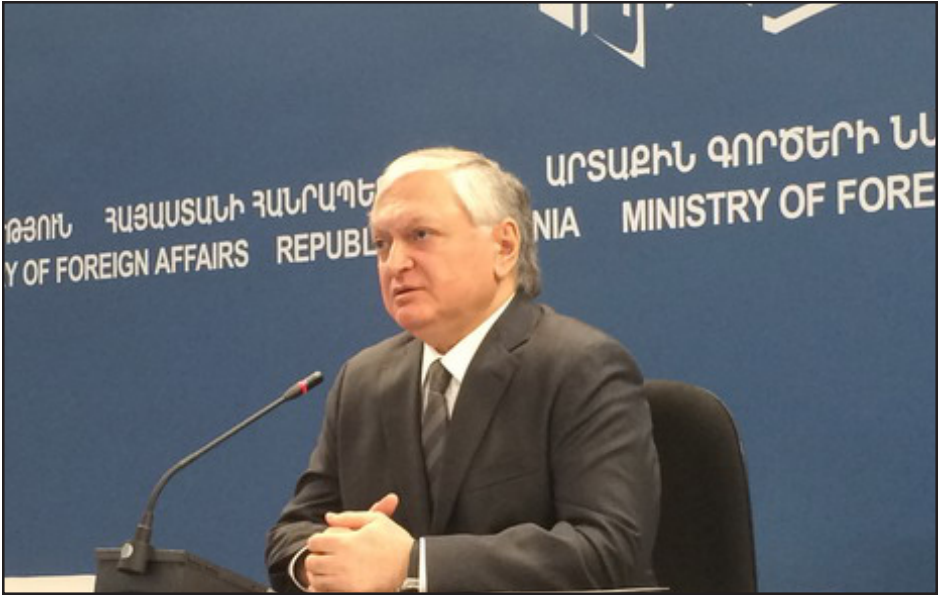
Էդուարդ Նալբանդեան 2015 թուականի հաշուետու մամուլային ասուլիսի ընթացքին

Փետրուար 2-ին Երեւանի մէջ կայացած՝ 2015 թուականի հաշուետու մամուլային ասուլիսի ընթացքին, Հայաստանի արտաքին գործոց նախարարը Էդուարդ Նալբանդեան անդրադարձաւ Հայ-Թուրք յարաբերութիւններուն, շեշտելով որ, Թուրքիոյ ապակառուցողական դիրքորոշման պատճառով Հայ-Թուրքական յարաբերութիւններուն մէջ որեւէ դրական տեղաշարժ չէ արձանագրուած: