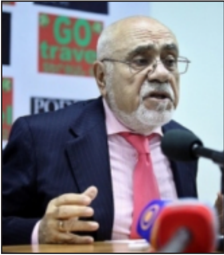
Արտակարգ եւ լիազօր դեսպան Արման Նաւասարդեան

Ատրպեյճանի եւ Թուրքիայի քաղաքականութիւնն ուղղուած է ԵԱՀԿ Մինսկի խմբի դէմ: Այս մասին NEWS.am-ի թղթակցի հետ զրոյցում ասել է արտակարգ եւ լիազօր դեսպան Արման Նաւասարդեանը: