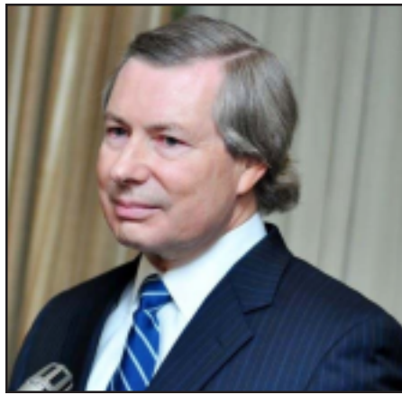
Մինսկի խումբի ամերիկացի համանախագահ Ջեյմս Ուորլիք

«Երկարաժամկէտ կարգաւորման հասնելու համար մեր բանակցութիւնները հիմնուած են միջազգային իրաւունքի՝ ՄԱԿ կանոնակարգի, Հելսինկիի եզրափակիչ