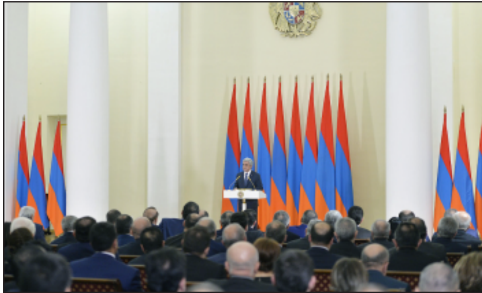
Սերժ Սարգսեան ելոյթ կ'ունենայ իշխանական վերնախաւին առջեւ

Հայաստանի Նախագահ Սերժ Սարգսեանը անցեալ շաբաթ իր նստավայրէն ներս հիւրընկալած է օրէնադիր, գործադիր եւ դատական իշխանութիւններու, տարածքային կառավարման եւ տեղական ինքնակառավարման մարմիններու ղեկավար կազմի ներկայացուցիչները: Այս առթիւ իր ունեցած ելոյթին մէջ Սարգսեան խօսած է սահմանադրութեան փոփոխութիւններու կենսագործման մասին, անդրադարձ կատարելով Հայաստանի տնտեսական, արտաքին եւ