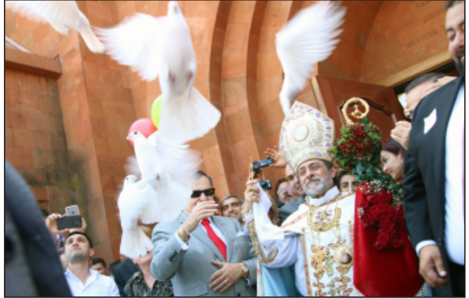
Եկեղեցական արարողութեան անարտիւն, Սրբազան Հայրը կ'արձակէ իրադադրութեան սպիտակ աղաւնի