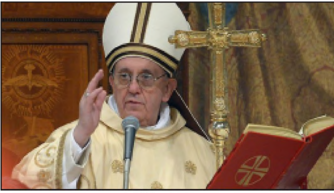
Հռոմի Ֆրանցիսկոս Պապը

Հռոմի Պապի այցը Ծիծեռնակաբերդի յուշահամալիր կարող է լարուած դարձնել վատիկանի եւ Թուրքիայի միջեւ դիւանագիտական յարաբերութիւնները: Այս մասին գրում է «religionnews.com»-ի թղթակից Ռոզի Սքեմելը: