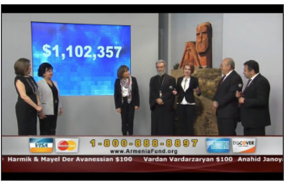
Թելեթոնի աւարտին կը յայտարարուի հանգանակութեան արդիւնքը

Շաբաթ, Մայիս 14-ին Լոս Անճելըսի մէջ տեղի ունեցաւ «Հայաստան» համահայկական հիմնադրամի յատուկ թելեթոնը: Վեց ժամ տեւած հանգանակութեան ընթացքին Արցախի օգնութեան համար հաւաքուեցաւ 1.1 միլիոն տոլար: Թելեթոնի անձամբ ներկայ եղաւ Արցախի Թեմի առաջնորդ Պարգեւ Արք. Մարտիրոսեանը: