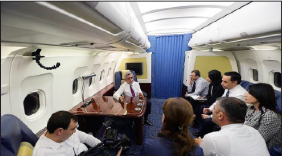
Նախագահ Սերժ Սարգսեան օդանաւին մէջ հարցազրոյց կ'ունենայ իր լրագրողներու հետ

Միաժամանակ, Սերժ Սարգսեանը հաստատած է տարածքային կորուստները չիշելով յստակ թիւեր: «Հայկական ուժերը, որոնք որպէս անվտանգութեան գօտի ունէին 800 հազար հեկտար, կորցրել են 800 հեկտարի չափ, դա մէկ հազարերորդն էլ չկայ, ռազմավարական կամ մարտավարական առումով այդ տարածքները որեւէ նշանակութիւն չունեն, գուտ հոգեբանական առումով, այո՛, ատրպէյճանցիները կարող են իրենց ժողովրդին համոզել, որ ինչ-որ մի արդիւնքի հասել