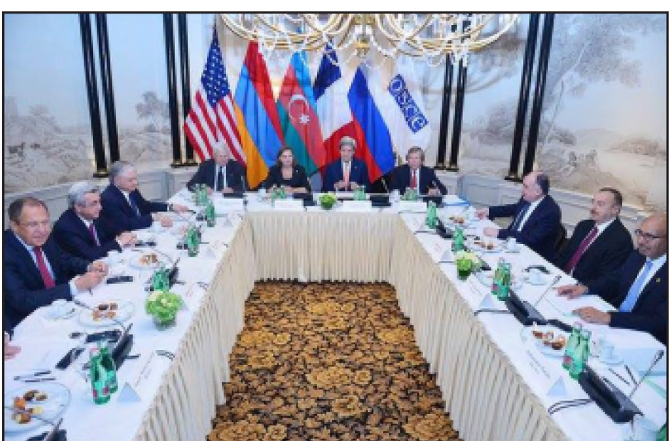
Սարգսեան- Ալիև հանդիպումը Վիեննայի մէջ, Լաւրովի եւ Քերրիի մասնակցութեամբ

Մայիս 16-ի Սերժ Սարգսեան- Իլհամ Ալիև հանդիպումէն յետոյ, Միացեալ Նահանգներու պետական քարտուղար ձոն Քերրին, Ռուսաստանի արտաքին գործոց նախարար Սերէյ Լաւրովը եւ Ֆրանսիայի եւրոպական հարցերով պետական քարտուղար Արլեմ Դեզիրը յայտարարեցին, թէ հետագայ ընթացքներուն վտանգը նուա-