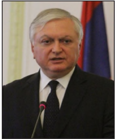
Հայաստանի արտգործնախարար Էդուարդ Նալբանդեան

Լաւրովի փաստաթուղթ, առաջարկութիւններ գոյութիւն չունեն, «Ինտերֆաքս»-ի հետ գրոցում յայտարարել է Հայաստանի արտգործնախարար Էդուարդ Նալբանդեանը՝ մեկնաբանելով Ռուսաստանի արտգործնախարարի յայտարարութիւնները դարաբաղեան հակամարտութեան փուլային կարգաւորման առաջարկութիւնների վերաբերելով: