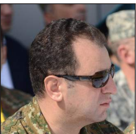
Պաշտպանութեան նոր նախարար Վիգէն Սարգսեան

Հայաստանի պաշտպանութեան նախարար Սէյրան Օհանեանի նոր կառավարութեան կազմէն հեռացնելու մասին տարածուող լուրերը իրականութիւն դարձան: