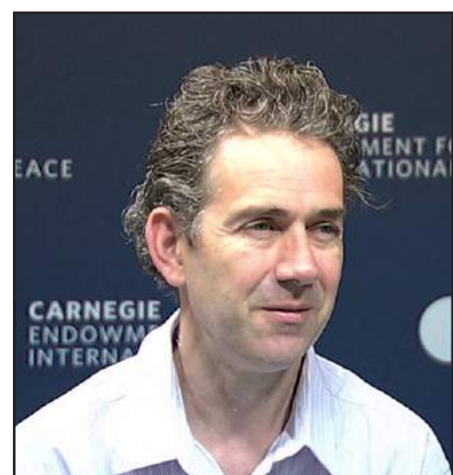
Փորձագետ Թոմաս Տը Վաալ

«Ատրպէյճանը մուտք կը գործէ փոփոխութիւններու եւ անկայունութեան ժամանակաշրջան», - համոզուած է Կովկասի խնդիրներով զբաղող ամենահեղինակաւոր արեւմտեան փորձագէտներէն մէկը՝ Թոմաս տը Վաալը: «Քարնեգի» հիմնադրամի կազմին վրայ գետեղուած ծաւալուն յօդուածին մէջ վերլուծաբանը կը նկատէ. - «Նաւթային աղմուկը, որ խթանեց տնտեսութեան աճը, ամրապնդեց պետականութեան հիմքերն ու թոյլ տուաւ Ատրպէյճանին նոր ձեւով հանդէս գալ միջազգային ասպարէզին մէջ, աւարտած է»: