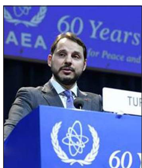
Պերաթ Ալ Պայրաք

Թուրքիոյ ուժաբանութեան երիտասարդ նախարարը, որ նախագահ Թայյպ էրտողանի փեսան է, առաջին անգամը չէ, որ կը բարձրաձայնէ Հայկական աթոնակայանը փակելու անհրաժեշտութեան մասին: Անցեալ ապրիլին, երբ խումբ մը ցուցարարներ կը բողոքէին Թուրքիոյ մէջ նոր աթոնակայաններ կառուցելու նախագիծը, Պերաթ Ալ Պայրաքը ցուցարարներուն կոչ ըրած էր