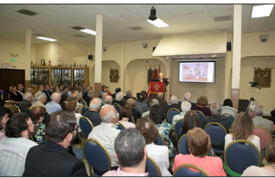
Տեսարան մը դասախօսական երեկոյէն

Ս. Դ. Հնչակեան Կուսակցութեան Արևմտեան Ամերիկայի Քաղաքական դիւանի կազմակերպութեամբ տեղի ունեցաւ հրապարակային ասուլիս մը՝ «Թուրք յառաջադէմ մտաւորականութիւնը եւ Հնչակեան Կուսակցութիւնը» նիւթին շուրջ: