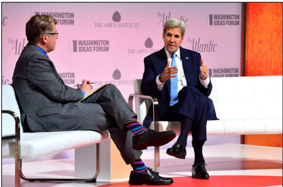
Պետական քարտուղար ճոն Բերրի կը խօսի միջազգային հարցերու մասին

Միացեալ Նահանգներու արտաքին քաղաքական գերատեսչութեան ղեկավարը խոստովանեցաւ, որ Լեռնային Ղարաբաղի սառեցուած հակամարտութեան կարգաւորման, առաջիմ, յստակ ճանապարհ չի տեսներ: Այս մասին պետական քարտուղար ճոն Բերրին յայտարարեց՝ ելոյթ ունենալով Աբեյնի հիմնարկի եւ «Աթլանթիկ» պարբերականի կողմէն Ուաշինկթընի մէջ կատարուող ամենամեայ համաժողովին: Ամերիկեան դիւանագիտութեան առաջնահերթութիւններուն նուիրուած իր ելոյթի ընթացքին Քերրին ընդգծեց որ, Միացեալ Նահանգները երբեք այնքան ներգրաւուած չէ եղած միջազգային քաղաքականութեան մէջ, որ-