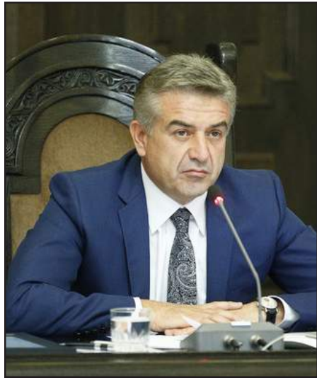
ՀՀ վարչապետ Կարէն Կարապետեան

Վարչապետ Կարէն Կարապետեանը ընդունած է Հայաստանի արդիւնաբերողներու եւ գործարարներու միութեան (ՀԱԳՄ) անդամներուն: