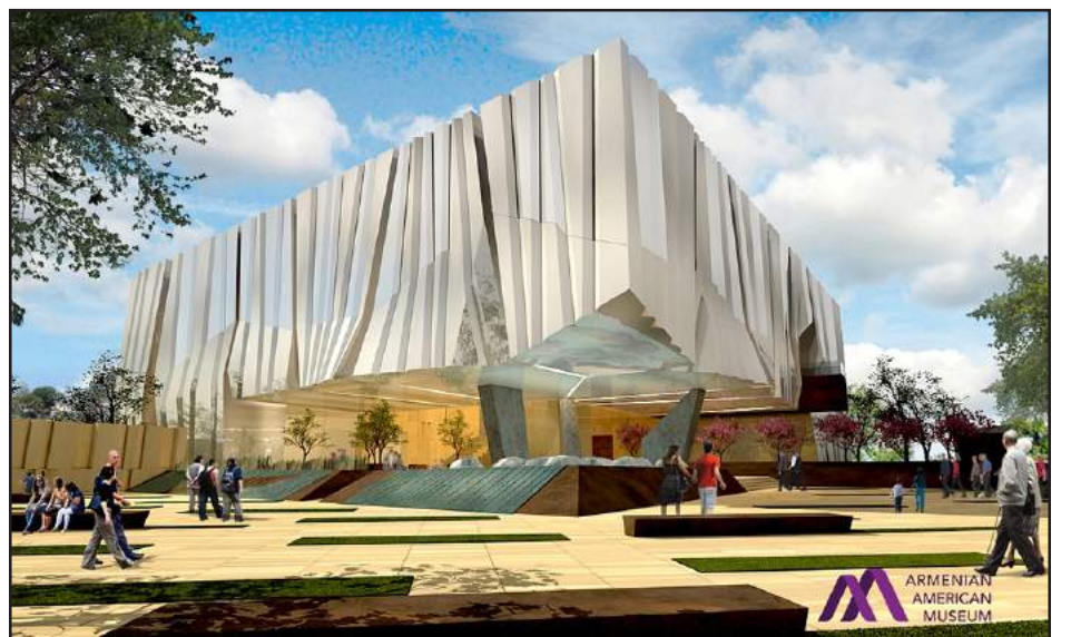
Հայ-Ամերիկեան Թանգարանի արտաքին նախագիծը

Շուրջ երեք տարիներ առաջ Լոս Անճելոսի մօտ Հայաստանի Հանրապետութեան աւագ հիւպատոս Տիար Գրիգոր Յովհաննիսեանի նախաձեռնութեամբ կազմուեցաւ Մեծ Եղեռնի 100-ամեակի ոգեկոչման համազարգութեան մարմին մը: Այս համախմբուածի նպատակն էր Հայոց Ցեղասպանութեան 100-ամեակը նշել պատշաճ շուքով եւ բարձր մակարդակով: Սոյն Համահայկական Մարմինն իրենց մասնակցութիւնը բերին 18 կազմակերպութիւններ, Արեւմտեան Ամերիկայի Հայկական չորս յարանուանութիւններու առաջնորդներ, ազգային աւանդական երեք կու-