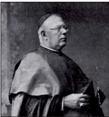
Քարտինալ ԱՆԿԵԹՕ Մարիա ՏՈԼՉԻ

Վատիկանի գաղտնի արխիվներուն մէջ հետազոտութիւն իրականացնող Վալենթինա Վարդուհի Կարախանեանը հաւաքագրած է տեղեկութիւններ այն մասին, թէ ինչպէս Հռոմի Պենետրաթոս XV Պապի նուիրակը տեղեկացած է Հայոց ցեղասպանութեան մասին եւ փորձած է դադարեցնել զայն: Հետազոտողը Rome Reports-ին պատմած է, որ պատրաստուող գրքի գլխաւոր դերակատարներէն է Հռոմի Պապի ներկայացուցիչ, քարտինալ Անկէթո Մարիա Տոլչի, որ Հայոց ցեղասպանութեան տարիներուն փորձած է ռազմականացնել Կոստանդնուպոլսոյ դիւանագիտական ջոկատը, դատապարտած է կատարուող դէպքերն ու թէպէտ առանց յաջողութեան, հասած է նոյնիսկ մինչեւ սուլթանը: