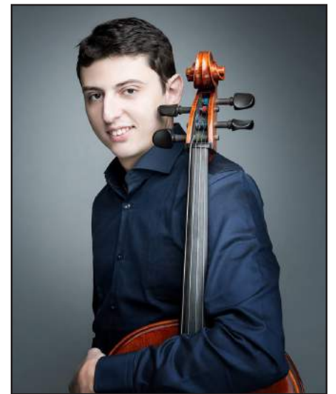
Generation Artists Scheme.