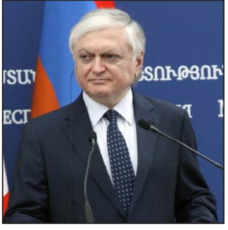
Հայաստանի արտաքին գործոց նախարար Էդուարդ Նալպանտեան

«Համաձայն ենք նրանց հետ, որ հրադադարի խախտումներն անընդունելի են: Համաձայն ենք, որ պէտք է անվերապահ իրականացուեն վիճարկում եւ Սան-Փեթերպուրկում ձեռք բերուած պայմանաւորուածութիւնները, ներառեալ, ինչպէս նշում են համանախագահները՝ հնարաւորինս կարճ ժամանակահատուածում ներդրուի միջադէպերի հետաքննութեան մեխանիզմը: Եռանախագահ երկրները բազմիցս են նշել, թէ որ կողմն է մերժում մեխանիզմի ներդրումը, հետեւաբար, հենց այդ կողմի վրայ է ընկնում միջադէպերի եւ գինադադարի խախտումների ողջ պատասխանատուութիւնը: Նման մեխանիզմը հնարաւորութիւն կ'ընձեռնի, ինչպէս համանախագահներն են ասում, ձեռք բերուել փոխադարձ մեղադրանքներին: Թէեւ, երբ ատրայեյճանական տիւերասանթը վնասագրեւծում է հայկական դիրքերում, բոլորի համար առանց մեխանիզմի էլ պարզ է, թէ ով է յարձակուել», - ըսած է Հայաստանի արտաքին գործոց նախարար Էդուարդ Նալպանտեան: