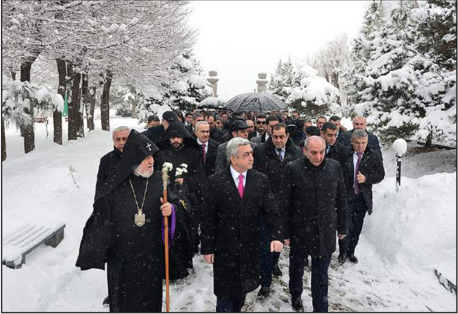
Սերժ Սարգսեանի ու Բակո Սահակեան, ընկերակցութեամբ ամենայն հայոց կաթողիկոսին կ'այցելեն Եռաբլուրի պանթոն

Յունուար 28-ին նշուեցաւ Հայոց բանակի կազմաւորման 25-ամեակը: Այս առթիւ, Հայաստանի եւ Արցախի հանրապետութիւններու բարձրաստիճան պատասխանատուները, գլխաւորութեամբ նախագահներ՝ Սերժ Սարգսեանի ու Բակո Սահակեանի, ընկերակցութեամբ ամենայն Հայոց Գարեգին Բ. կաթողիկոսին, այցելեցին Եռաբլուրի պանթոն, ուր չարզանքի տուրք մատուցեցին հայրենիքին համար զոհուածներու յիշատակին: Հայկական բանակի կազմաւորումի 25-րդ տարեդարձին առթիւ տեղի ունեցաւ նաեւ պարզեւտրումի հանդիսութիւն: Հանրապետութեան նախագահ Սերժ Սարգսեան շնորհաւորեց զինուորները՝ իրենց տօնին առթիւ: Ան հաստատեց, որ հայրենիքի սահմանները պաշտպանած են քաջ եւ նուիրուած հայորդիները: «Մենք շնորհակալ ենք ձեր կատարած հսկայական աշխատանքին համար, որ կը կոչուի ծառայութիւն: Առաջին հերթին մենք պէտք է ոգեկոչենք այն անմահները, որոնք այսօր կը պարզեւտրուին յետմահու: Մենք կը կանգնինք հերոսներ դաստիարակող ծնողներու կողքին», ըսաւ նախագահը: