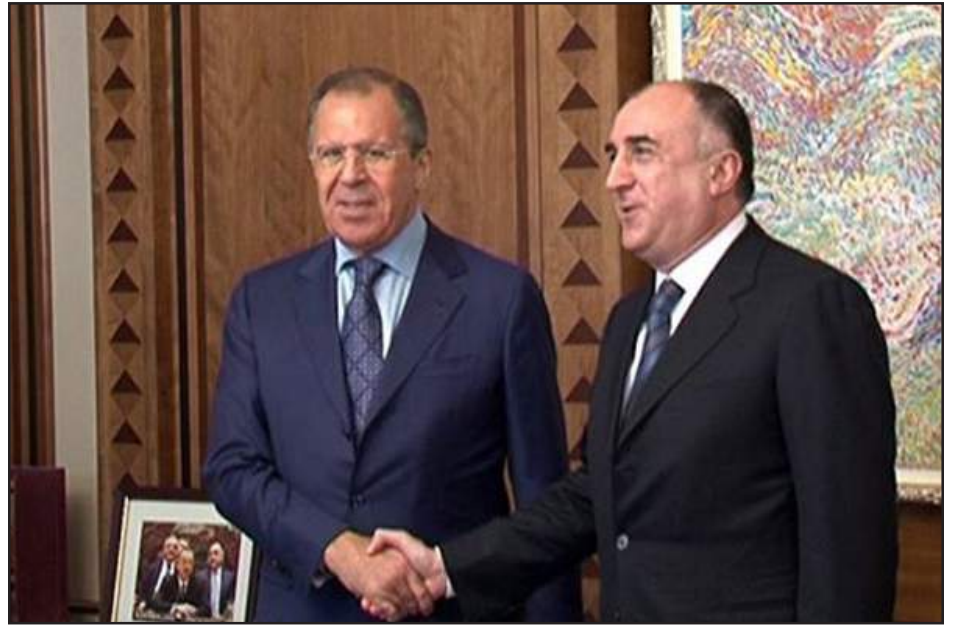
Լավրովի եւ Մամէտիարով միջեւ կայացած հանդիպումներէն մէկուն ընթացքին

Ատրպէյճանի արտաքին գործոց նախարար Էլմար Մամէտիարով բարձրաձայնած է Ռուսի արտաքին գործոց նախարար Սէրգէյ Լավրովի հետ կայացած հանդիպման արդիւնքն իր դժգոհութիւնը: Հանդիպումը, որ կայացած էր Մոսկուայի մէջ, Մամիտիարովին լաւատեսութիւն չէ ներշնչած: