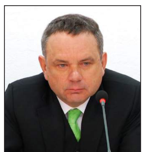
Ֆրանսայի դեսպան Ժան-Ֆրանսուա Շարփանթիէ

Անոր խօսքով, նոր համաձայնագիրը «կարեւոր թէ՛ Հայաստանի, թէ՛ Եւրամիութեան տեսանկիւնէն»: Ֆրանսայի դեսպանը տեղեկ չէ՝ արդեօք մօտ ապագային հնարաւոր է Հայաստանի քաղաքացիներուն համար ԵՄ երկիրներ մուտքի վիզայի անհրաժեշտութեան չեղարկում, ինչպէս եղաւ Վրաստանի պա-