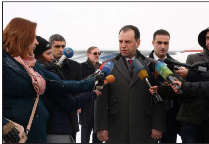
Պաշտպանութեան նախարար Վիգէն Սարգսեան

Որոշուած է նաեւ, որ ՀՀԿ նախընտրական շտապը պիտի ղե-