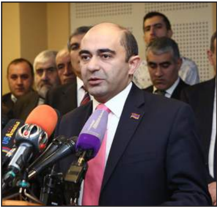
«Լուսաւոր Հայաստան» կուսակցութեան առաջնորդ Էտնոն Մարուքեան

«Ելք» դաշինքը Փետրուար 14-ին կայացած ներքին քուէարկութեան անմիջապէս յետոյ հրապարակեց յառաջիկայ խորհրդարանական ընտրութիւններուն իր համամասնական ցուցակի առաջին եռեակի անունները: Ըստ այդ՝ դաշինքի ցուցակը կը գլխավորէ «Լուսաւոր Հայաստան» կուսակցութեան առաջնորդ Էտնոն Մարուքեան, երկրորդ հորիզոնականին է «Հանրապետութիւն» կուսակցութեան առաջնորդ Արամ Մարգարեան, ցուցակի երրորդ տեղն է «Քաղաքացիական պայմանագիր» կուսակցութեան վարչութեան անդամ Նիկոլ Փաշինեան: