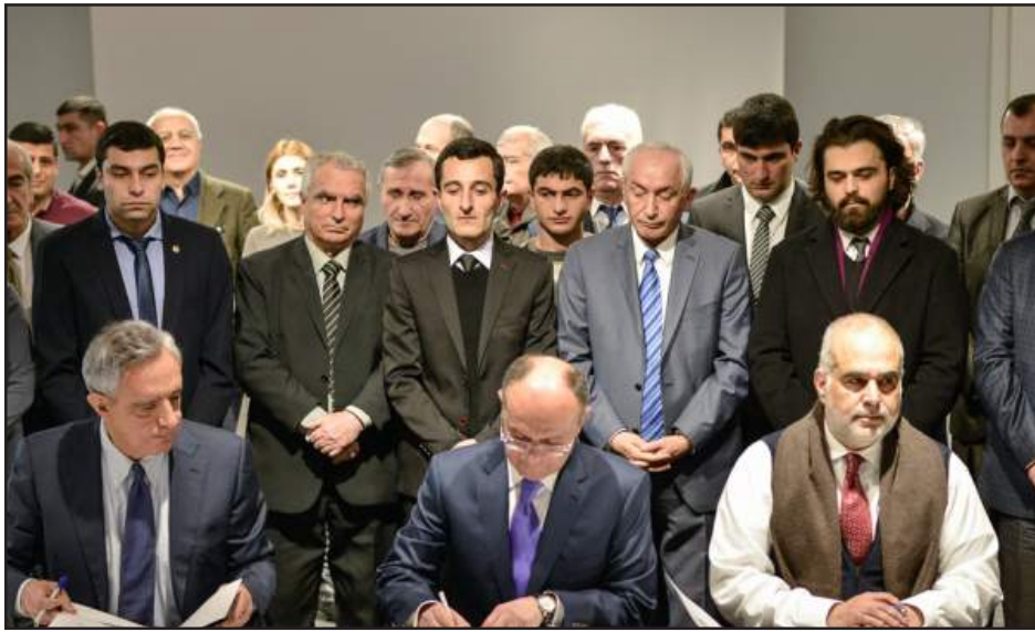
Րաֆֆի Յովհաննիսեան, Վարդան Օսկանեան եւ Սէյրան Օհանեան կը ստորագրեն ընտրական դաշինքի ստեղծման մասին փաստաթուղթը

Փետրուար 13-ին տեղի ունեցաւ «Ժառանգութեան» առաջնորդ Րաֆֆի Յովհաննիսեանի, «Համախմբում» կուսակցութեան նախագահ Վարդան Օսկանեանի ու Պաշտպանութեան նախկին նախարար Սէյրան Օհանեանի մասնակցութեամբ ընտրական դաշինքի ստեղծման մասին փաստաթուղթի ստորագրումը: