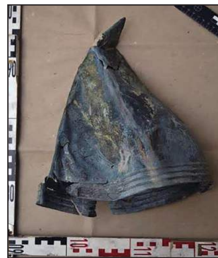
the Museum of Fine Arts in Budapest. *****

Urartu, also known as Kingdom of Van, was an Iron Age kingdom centered on Lake Van in the Armenian Highlands. It corresponds to the biblical Kingdom of Ararat.