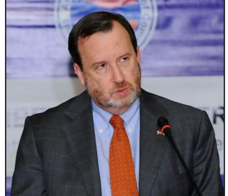
Միացեալ Նահանգներու դեսպան Ռիչըրտ Միլս

Ռիչըրտ Միլս նշած է. «Հայաստանին կաշառակերութեան դէմ