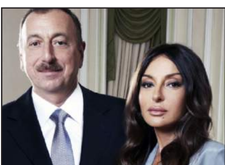
Ատրպէյճանի նախագահ Իլհամ Ալիեւ եւ իր առաջին փոխնախագահ՝ Մեհրիբեան

Ատրպէյճանի նախագահ Իլհամ Ալիեւը իր կնոջը՝ Մեհրիբեան Ալիեւային նշանակել է երկրի առաջին փոխնախագահ: Հրամանագրի տեքստը տեղադրուած է Ատրպէյճանի նախագահի պաշտօնական կայքէջում: