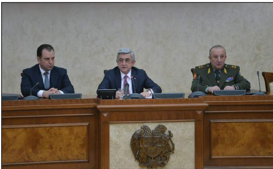
ՀՀ նախագահ Սերժ Սարգսեան ՁՈՒ ղեկավար կազմի հաւաքի ժամանակ

Լեւոնային Ղարաբաղի խնդրի խաղաղ կարգաւորման ուղղութեամբ տեղի ունեցող բանակցութիւններուն մէջ որեւէ ճեղքում արձանագրելու հիմք այս պահին ես չեմ տեսներ: Այս մասին, 20 Փետրուարին, ՀՀ ՁՈՒ ղեկավար կազմի հաւաքի ժամանակ իր ելույթին մէջ նշած է ՀՀ նախագահ Սերժ Սարգսեանը: