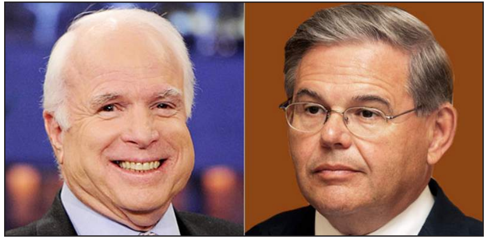
Ծերակուտականներ ճոն Սըք Քէյն եւ Բապըթ Սեննետեզ

14 ծերակուտականներու ստորագրութեամբ նախագահ Տանըլտ Թրամբին Թուրքիոյ վերաբերեալ նամակ ուղարկուած է, ուր կոչ կ'ընեն աւելի խիստ դիրքորոշում որդեգրել պաշտօնական Անգարայի հանդէպ: