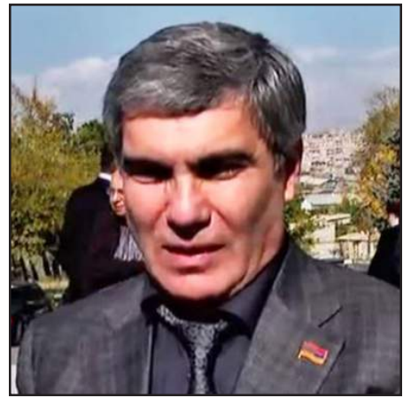
«Հանրապետութիւն» կուսակցութեան առաջնորդ Արամ Սարգսեան

Հարցին, թէ այսօր իշխանութեան մէջ կա՞ն մարդիկ, որոնք կապ ունին այդ ոճրագործութեան հետ, Արամ Սարգսեան պատասխանած է. - «Մեղքը պէտք է որոշի դատարանը: Հակառակ դէպքում՝ հանրութիւնը, հասարակութիւնն արդէն հետեւութիւն արել է, մեղաւորներին գտել է ու ինձ էլ ասում է՝ «որ ուժեղ տղայ լինէիր, պիտի դնէիր ու ճակատից կիւլլէիր»: Ես էդ մօտեցման կողմնակիցը չեմ, որովհետեւ պետութեան ու պետականութեան հիմնական բաղադրիչը նա է, որ մեղաւորին ու անմեղին որոշում է դատարանը: Եւ այս առումով կան հարցեր, շատ-շատ