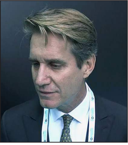
ԵԱՀԿ Մինսքի խումբի ամերիկացի նախկին համանախագահ Մեթիու Պրայզ

Ըստ անոր, իսկապէս Մինսքի խումբին մէջ ԱՄՆ համանախագահի պաշտօնի կրճատումը անխօսեմ եւ նոյնիսկ՝ վտանգաւոր քայլ է, քանի որ այն կրնայ դատարկութիւն ստեղծել, ինչի արդիւնքով