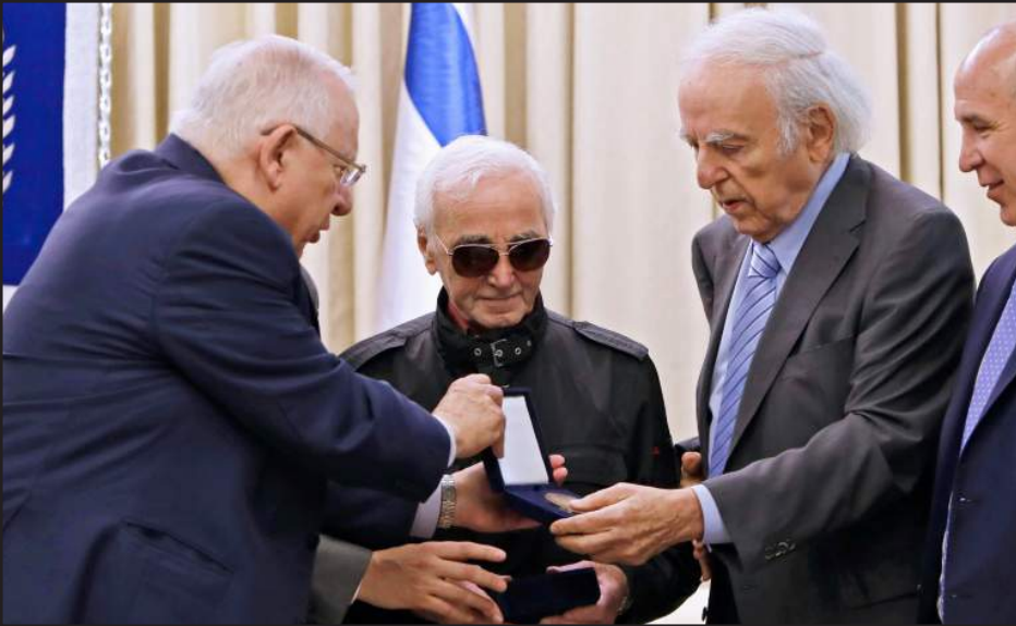
«Ռաուլ Վալենպերկի» անուան միջազգային մրցանակը կը յանձնուի Շարլ Ազնաուրին

Երուսաղէմի մէջ Իսրայէլի նախագահի նստավայրին մէջ կայացած է Շարլ Ազնաուրի եւ անոր ուղեկցող ընտանիքի անդամներին հանդիպումը նախագահ Ռոուվէն Ռիվլինի ու Ռաուլ Վալենպերկի անուան միջազգային հիմնադրամի ղեկավարութեան հետ: