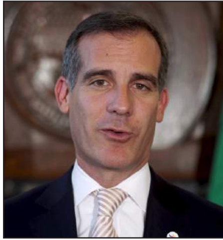
Կեանքը: Եկէք աջակցենք մեր եղբայրներին եւ քույրերին Արցախում՝ միանալով Մարաթոնին»:

«Բերքառատ Արցախ, այս խորագիրն է կրում «Հայաստան» Համահայկական Հիմնադրամի այս տարուայ Հեռուստամարաթոնը: Մարաթոնը, որն անցկացվելու է Նոյեմբերի 23-ին, նպատակաուղղուած է Արցախում հորերի հորատմանը, նոր ոռոգման ցանցի կառուցմանը եւ արեւային էներգայի կայանների տեղադրմանը: