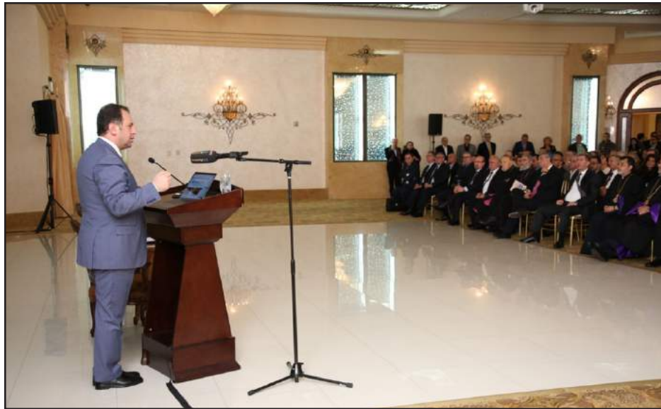
Հայաստանի պաշտպանութեան նախարար Վիգէն Սարգսեան ելոյթ կ'ունենայ ԱՄՆ Արեւմտեան Թեմի Առաջնորդարանէն ներս

Նոյեմբեր 13-ին Հայաստանի Հանրապետութեան պաշտպանութեան նախարար Վիգէն Սարգսեան կարճատեւ այցելութեամբ այցելեց Լոս Անճելըս: Երեկոյեան նախարարը հիւրընկալուեցաւ ԱՄՆ Արեւմտեան Թեմի Առաջնորդարանէն ներս, ուր Հայկական կազմակերպութիւններու ղեկավարներու եւ համայնքային գործիչներու հետ հանդիպուէն ետք Վիգէն Սարգսեան, համայնքի մեծաթիւ ներկայացուցիչներու առջեւ հանդէս եկաւ ծաւալուն ելոյթով, որու ընթացքին ան անդրադարձաւ հայկական բանակի արդիականացման ծրագիրներուն: Պաշտպանութեան նախարարը, մասնա-