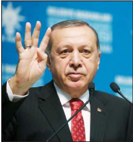
Թուրքիոյ նախագահ էրտողան

Վլատիմիր Փութին Սերժ Սարգսեանին յանձնած է ռուս յայտնի նկարիչ Միխայիլ Վրուպելի «Դեւը եւ հրեշտակը թամարի հոգին հետ» կտաւը, որ Հայաստանէն գողացուած էր 1995 թուականին: Հայաստանին այդ նկարը փոխանցելու մտադրութեան մասին Ռուսաստանի նախագահը յայտնած էր այս տարուայ Մարտին՝ Մոսկուայի մէջ հայ գործընկերոջ հետ հանդիպման ժամանակ: