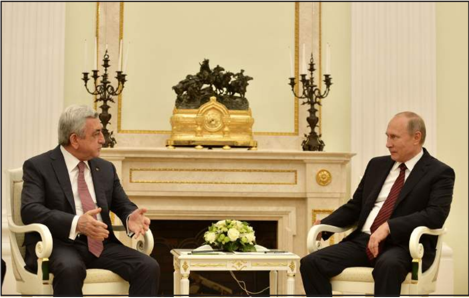
Նախագահներ՝ Սերժ Սարգսեան եւ Վլատիմիր Փութին Քրեմլինի մէջ կայացած հանդիպումի ընթացքին

Հայաստանի եւ Ռուսաստանի նախագահներ Սերժ Սարգսեանը եւ Վլատիմիր Փութինը անցեալ շաբաթ Քրեմլինի մէջ քննարկած են զարաբաղեան կարգաւորման գործընթացը: