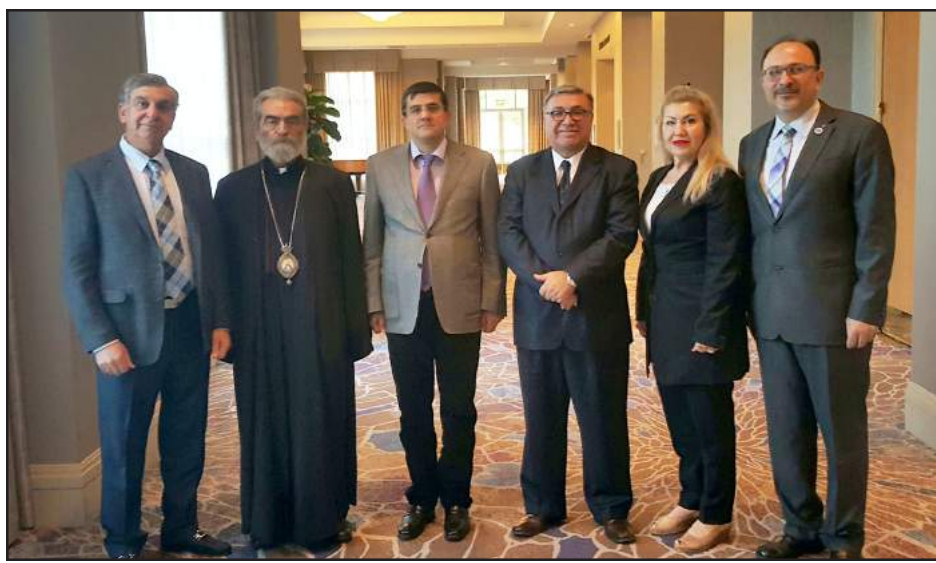
ՍԳՀԿ ներկայացուցիչները Արայիկ Յարութիւնեանի եւ Պարգեւ Արք. Մարտիրոսեանի հետ

Մասնակցելու համար Հայաստանի Համահայկական Հիմնադրամի տարեկան թեյեթոնին, Հարաւային Քալիֆորնիա ժամանած է Արքայի պետական նախարար (վարչապետ) Արայիկ Յարութիւնեանը: Այս առթիւ, ան Լոս Անճելըսի եւ Ֆրեզնոյի մէջ շարք մը հանդիպումներ կ'ունենայ համայնքային տարբեր կառույցներու ներկայացուցիչներուն հետ: