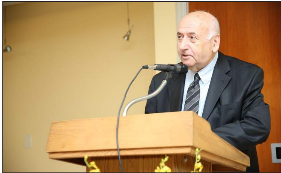
Դոկտոր փրոֆեսոր Արտեմ Սարգսեան

Դոկտոր Սարգսեանի գրական ժառանգութիւնը ներկայացրեց Տիար Վահան Բահարեան