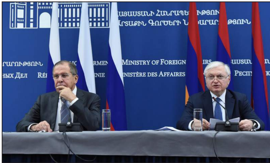
Սերկէյ Լաւրով եւ Էտուարտ Նալպանտեան Երեւանի մէջ կայացած մամուլի ասուլիսի ընթացքին

Ռուսաստանի արտաքին գործոց նախարարի Սերկէյ Լաւրով յայտարարեց, որ Ղարաբաղեան Խնդիրը բարդ է, եւ բանակցութիւնները շուտ պիտի չաւարտին: Երեւանի մէջ Հայաստանի արտաքին գործոց նախարար Էտուարտ Նալպանտեանի հետ համատեղ ասուլիսի ժամանակ Լաւրով յայտարարեց. «Բաբուի մէջ կայացած ասուլիսին արդէն նշած ենք, որ Ղարաբաղեան Խնդիրի կարգաւորման բոլոր բաղադրիչները առկայ են: Բաղադրիչները ներառուած են բազմաթիւ փաստաթուղթերու մէջ, որոնք 2007-էն, 2009-էն, 2011-էն ի պահ յանձնուած էին ԵԱՀԿ գլխաւոր քարտուղարին: Այդպիսով այդ բաղադրիչները ամբողջութեամբ են, որպէս ԵԱՀԿ Մինսքի խումբի համանախագահներու առաջարկներ, անոնք սեղանին են՝ իրենց ամբողջութեան մէջ»: