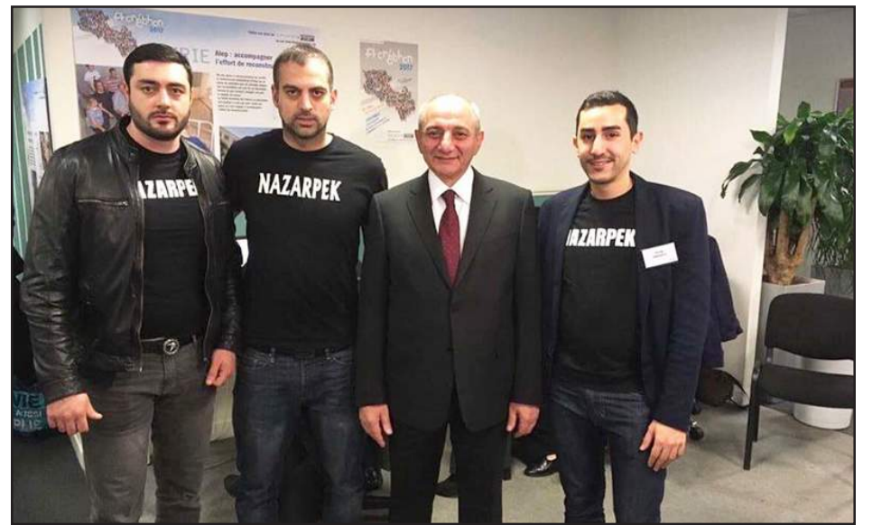
SDHP Nazarpek Youth Organization representatives with Artsakh president Bako Sahakian during the Phonethon

PARIS — Over 1.23 million Euros have been raised at the annual European Phonethon organized by Armenia Fund, held in France November 15-19.