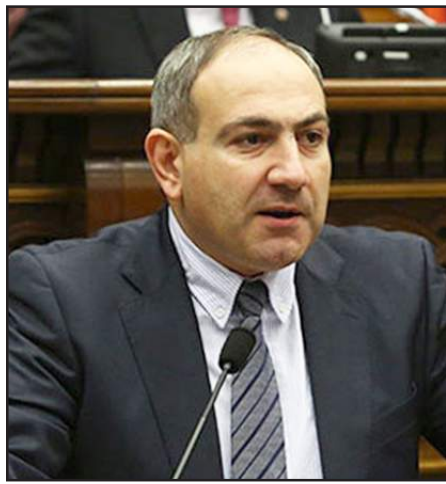
«ԵԼ» խմբակցութեան ղեկավար Նիկոլ Փաշինեան

Փաշինեան աւելցուցած է, որ ինչ-որ առումով սա վճռական ճակատամարտն է: Նախորդը ծուղակ եղած է, եւ այն ուժերը, որոնք մտած են այդ ծուղակի մէջ, իրենք կը յայտարարեն, որ այսօր ի վիճակի չեն կազմակերպել պայքար: