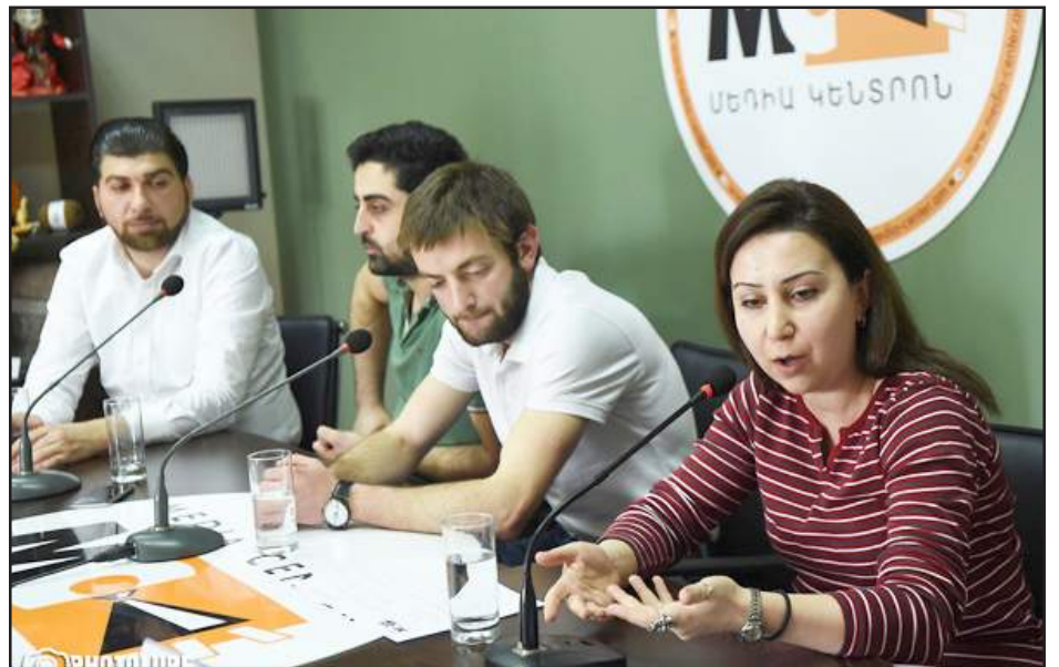
«Սերժիր Սերժին» նախաձեռնութեան անդամները ասուլիսի ընթացքին

«Սերժիր Սերժին» նախաձեռնութեան անդամները «Մետախ կեդրոն»-ի մէջ քննարկած են Սերժ Սարգսեանի վերարտադրութեան դէմ պայքարի յետագայ քայլերն ու նպատակները: