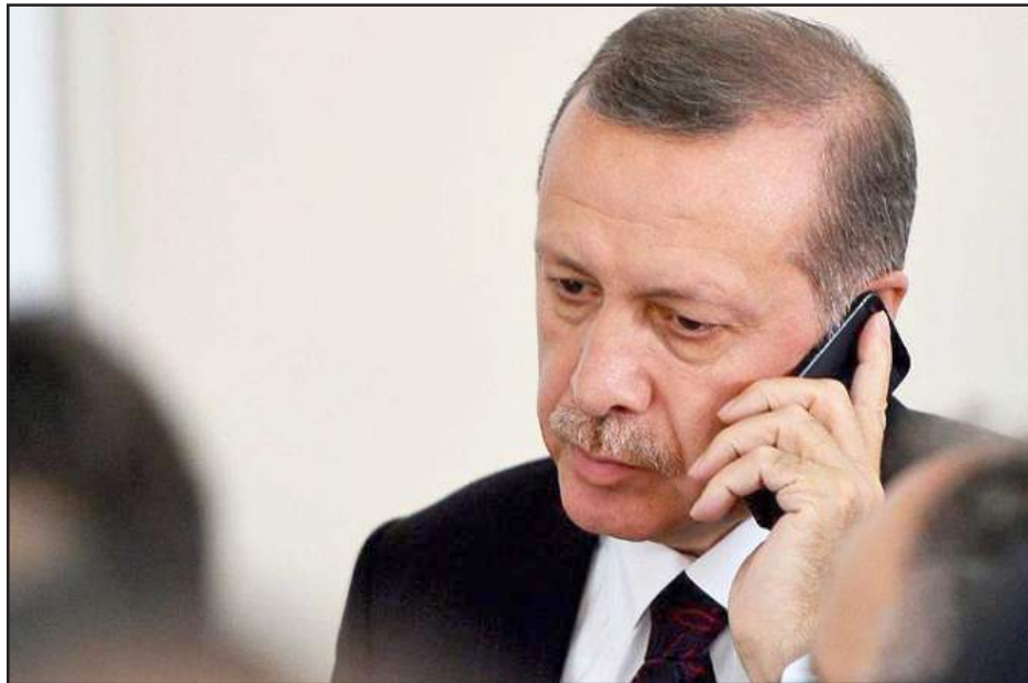
Թուրքիոյ նախագահ Ռեճեփ Թայէպ Էրտողան անձամբ հրահանգած է՝ Գերմանիոյ մէջ ցոյցեր կազմակերպել

Թուրքիոյ նախագահ Ռեճեփ Թայէպ Էրտողան անձամբ հրահանգած է, որ Գերմանիոյ մէջ բողոքի ցոյցեր կազմակերպուին՝ 2016 թուականի Յուլիանի Պոլսուտեսթակի մէջ Հայոց ցեղասպանութիւնը ճանչցող բանաձեւի ընդունման դէմ, գրած է գերմանական Der Spiegel-ը: