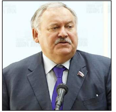
Ռուսաստանի Պետական Տուժարի պատգամաւոր Կոնստանդին Զատուլին

Հայաստանի դաշնակից Ռուսաստանի խորհրդարանի պատգա-