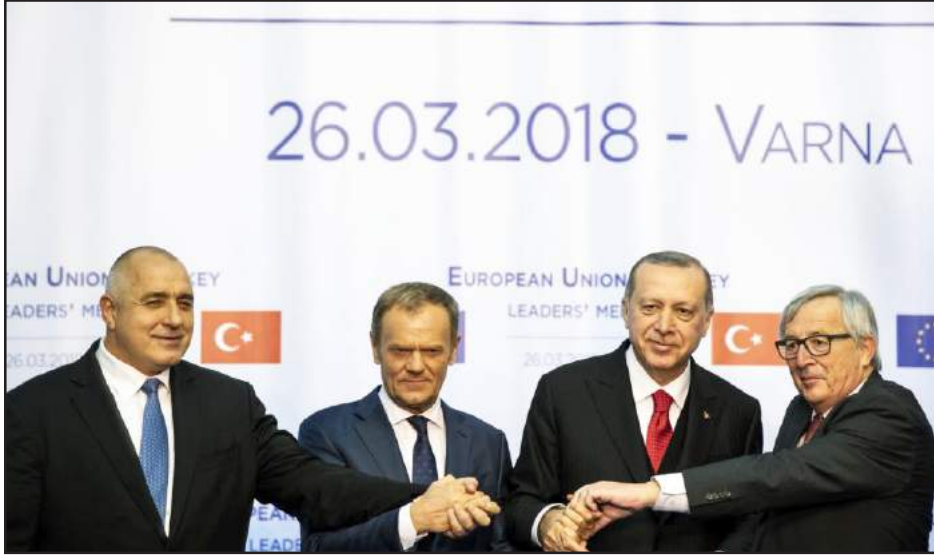
Թուրքիոյ նախագահի եւ Եւրոպական Միութեան ղեկավարներու հանդիպումը Վարնայի մէջ

Թուրքիոյ նախագահ Էրտողանի հետ դռնփակ հանդիպումէն վերջ Եւրոպայի խորհուրդի նախագահ Տոնալտ Տուսկը հրապարակաւ յայտարարած է, որ տարածայնութիւնները բաւական շատ են՝ Թուրքիոյ մէջ մարդու իրաւունքներու պաշտպանութեան մինչեւ Թուրքիական բանակի ներխուժումը Սուրիա: