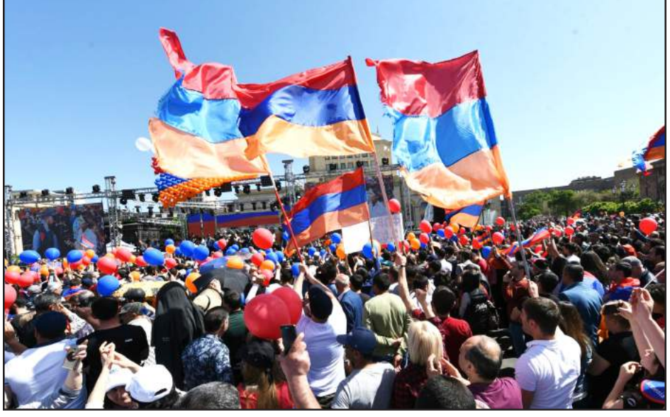
Մայիս 1-ին՝ ժողովուրդը Հանրապետութեան հրապարակին վրայ

Ազգային ժողովին ՀՀ վարչապետի ընտրութեան քուէարկութե-