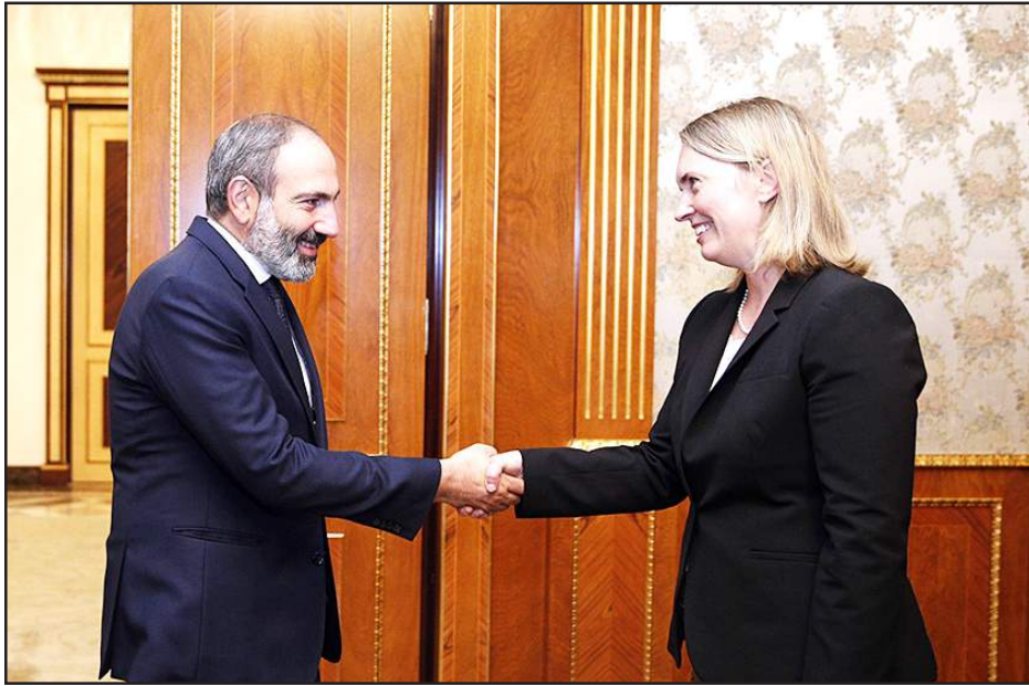
ԱՄՆ պետքարտուղարի փոխտեղակալ Պրիճիթ Պրինկ եւ վարչապետ Նիկոլ Փաշինեան հանդիպումի ընթացքին

Եւրոպայի եւ Եւրասիոյ հար- ցերով ԱՄՆ պետքարտուղարի փոխ- տեղակալ Պրիճիթ Պրինկը 27-28 մայիսին այցելած էր Հայաստան՝ հանդիպումներ ունենալու նոր կա- ռավարութեան եւ քաղաքացիական հասարակութեան հետ, հաղորդած է Հայաստանի մէջ Միացեալ Նա- հանգներու ղեսպանութիւնը: