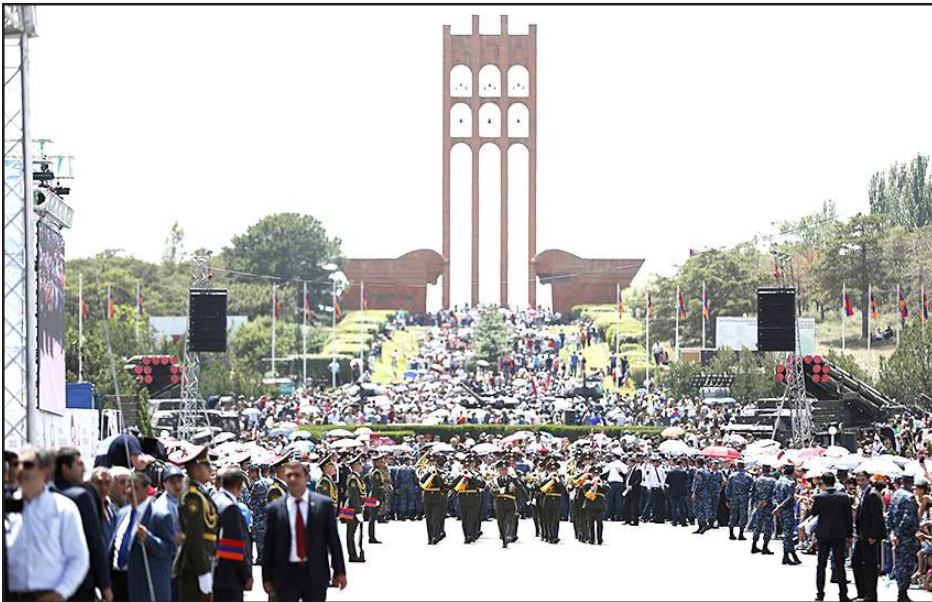
Շարունակուած էջ 1-էն

մում ընդգրկուեց որպէս լիարժէք միութենական հանրապետութիւն: Եւ միայն այս կարգավիճակի շնորհիւ էր, որ Հայաստանը կարողացաւ անցնել դուրս գալ ԽՍՀՄ կազմից եւ ստանալ միջազգայնօրէն ճանաչուած անկախ երկրի կարգավիճակ: Ասել է թէ՛ Առաջին Հանրապետութեան հիմնադրումը պսակուեց Երրորդ Հանրապետութեան հռչակմամբ, փառաւորուեց Արցախեան պատերազմում մեր ժողովրդի տարած յաղթանակով եւ աշխարհահռչակուեց ոչ բռնի, թաւաշէն, ժողովրդական յեղափոխութեամբ: Եւ ահա հայ ժողովուրդը, Հայաստանի քաղաքացին այսօր տօնում է Առաջին Հանրապետութեան 100-ամեակը: Եւ հայ ժողովուրդը, Հայաստանի քաղաքացին ապրում է քաղաքացիական պատմութեան ամենափառապանծ էջը, երբ երկրում հաստատուած է ժողովրդի անշրջելի իշխանութիւն: Եւ այլեւս երբեք, այլեւս երբեք ոչ ոք չի համարձակուի բռնանալ ժողովրդի կամքի վրայ, այլեւս երբեք որեւէ մէկը չի համարձակուի ժողովրդին նուաստացնել ընտրակաշառքի, վարչական հարկադրանքի կամ որեւէ այլ միջոցով: Հայ ժողովրդի վերածնունդն ու թռիչքը կասեցնելու, ժողովրդի յոյսն ու լաւատեսութիւնը կոռուպցիայի ու ամենաթողութեան մէջ խեղդելու ցանկացած փորձ, ցանկացած փորձ կ'արժանանայ ջախջախիչ հակահարուածի: Եւ Հայաստանի Հանրապետութեան յաղթական քաղաքացին այլեւս երբեք թոյլ չի տայ