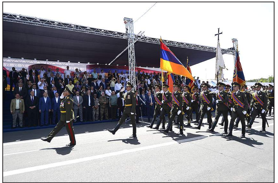
Շքերթին մասնակցող Հայկական բանակի ստորաբաժանումներէն մէկը

Հայաստանի վարչապետը այցելած է Թիֆլիսի Ս. Գէորգ եկեղեցին, ուր խանդավառ ընդունելութեան արժանացած է: «Այն յաղթանակը, որ ժողովուրդը արձանագրեց Երեւանի մէջ, նաեւ ձերն է», այս առթիւ ըսած է Փաշինեան: