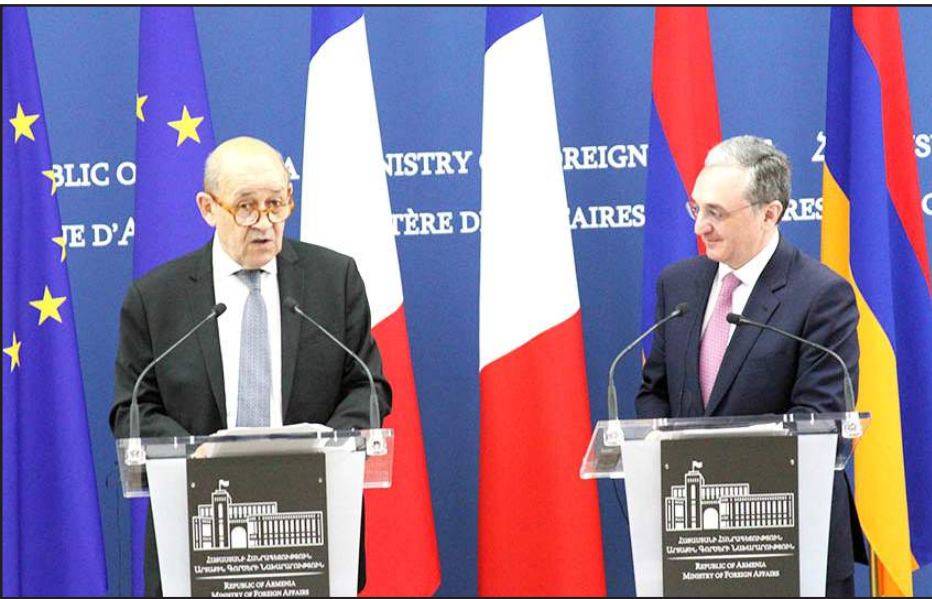
Ֆրանսայի եւ Դաշնակցանի արտաքին գործոց նախարարները մամուլի ասուլիսի ընթացքին

ԵԱՀԿ Մինսկի խումբի համա- նախագահ Ֆրանսայի արտաքին գործոց նախարար Ժան-Իւ Լը Տրի- անը Երեւանի մէջ յայտարարած է, որ Ղարաբաղեան հակամարտու- թեան հարցով ո՛չ հաստատուած սահմանը, ո՛չ ուժի կիրառումը ընդունելի չեն: