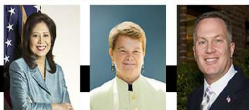
Hilda Solis for County Supervisor District 1 Sheila Kuehl for County Supervisor District 3 Jeff Prang for L.A. County Assessor