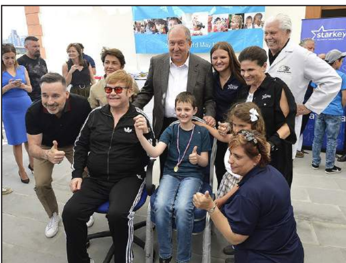
Բրիտանացի նշանաւոր երգիչ Էլթոն ճոն եւ նախագահ Արմէն Սարգսեան բժշկական կեդրոն այցի ընթացքին

Հայաստանէն հեռանալէ ետք Ինս- թ ա կ ր ա մ ի (Instagram) իր էջի վրայ գրառում կա- տարած է յայտնի բրիտանացի երգիչ էլթոն ճոն. «Հա- յաստանի մէջ շատ յուզիչ եւ ոգեշնչող փոփոխութիւններ տեղի կ'ունենան»: