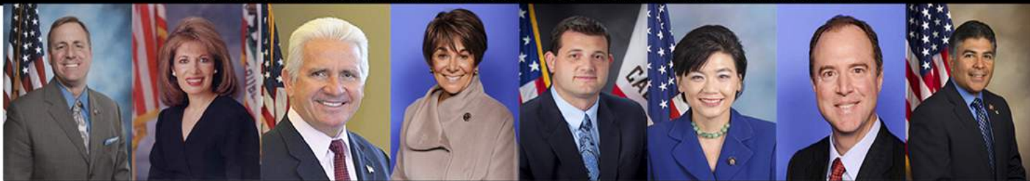
Jeff Denham CA - CD 10 Jackie Speier CA - CD 14 Jim Costa CA - CD 16 Anna Eshoo CA - CD 18 David Valadao CA - CD 21 Judy Chu CA - CD 27 Adam Schiff CA - CD 28 Tony Cardenas CA - CD 29