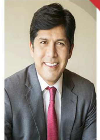
Kevin de León