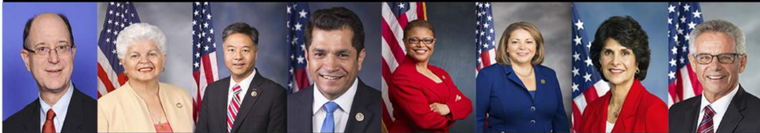
Brad Sherman CA - CD 30 Grace Napolitano CA - CD 32 Ted Lieu CA - CD 33 Jimmy Gomez CA - CD 34 Karen Bass CA - CD 37 Linda Sanchez CA - CD 38 Lucille Roybal-Allard CA - CD 40 Alan Lowenthal CA - CD 47