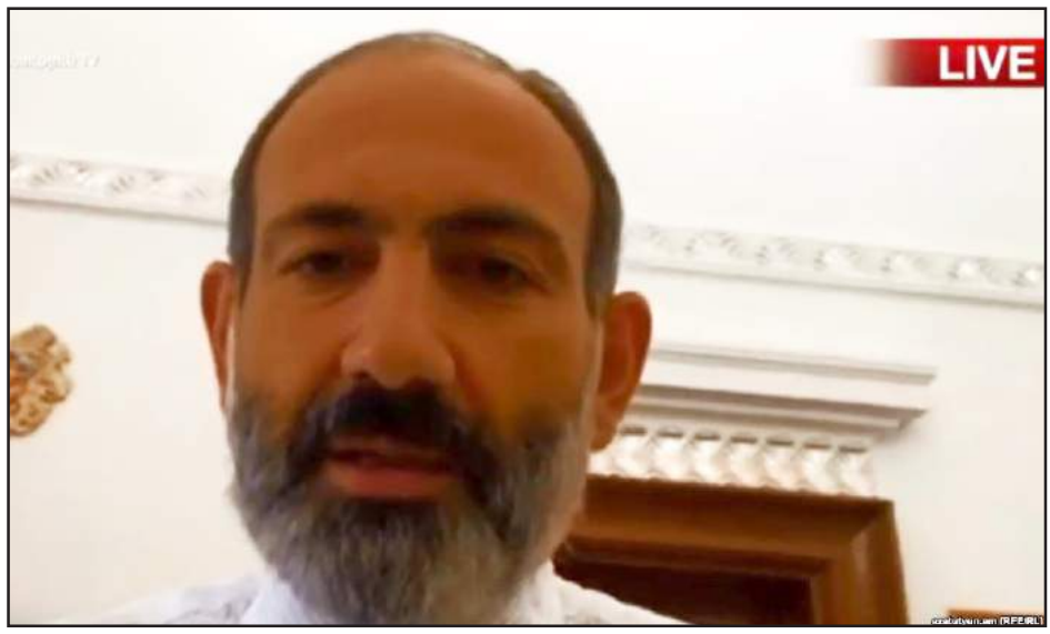
Նիկոլ Փաշինեան ֆէյսուքեան ուղիղ հեռարձակման ընթացքին

Վարչապետն ընդգծած է՝ Հայաստանի Հանրապետութեան մէջ օրինականութեան հաստատումն այլընտրանք չունի: «Այս ճանապարհը՝ օրինականութեան հաստատման ճանապարհն այլընտրանք չունի եւ բոլորը պատասխան են տալու իրենց արարքներին համար՝ Հայաստանի Հանրապետութեան օրէնսդրութեամբ սահմանուած կարգով եղանակներով եւ ձեւերով», - ըսած է վարչապետը՝ շարունակելով. - «Ուզում եմ նաեւ ասել, որ այս ողջ փրոցեսի (գործընթացի) ընթացքում մեր կառավարութիւնը, մեր իշխանութիւնը նոյնպիսի պատասխանատուութիւն է գտնուած անառջ՝ Հայաստանի պետականութեան առաջ, ժողովրդի առաջ, օրինականութեան առաջ եւ մենք նաեւ այս ողջ քաղաքական գործընթացը կազմակերպելու ենք ժողովրդից ստացած լիազօրութիւններին սահմաններում եւ այդ լիազօրութիւններին սահմանները չենք անցնելու ոչ մի պարագայում, որովհետեւ մենք չենք ուզում ուրիշների ապօրինութիւնները փոխարինել մեր ապօրինութիւններով, չենք