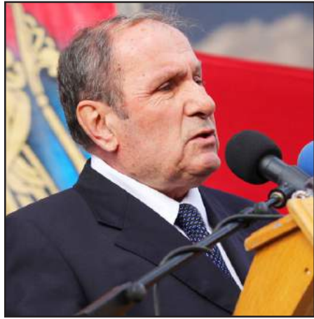
Հայաստանի առաջին նախագահ Լեւոն Տէր-Պետրոսեան

«10 տարի մենք նիւթեր ենք հաւաքել, գրքեր հրատարակել, ֆիլմեր նկարահանել, դիմել ենք միջազգային եւրոպական բոլոր կառույցներին, կազմել ենք հնարաւոր բոլոր յանցագործների ցուցակը: Մենք ունենք բոլոր ոստիկանների ցուցակը, որոնք կեղծ ցուցմունքներ են տուել, բոլոր դատախազների անունները, որոնք կեղծ մեղադրանքներ են ներկայացրել: Վերջին աշխատանքն արել ենք դեռեւս «Մարտի 1-ի» տասնամեակը լրանալուց առաջ: Փաստաթղթերի ժողովածուի հրատարակումից անմիջապէս յետոյ դրա օրինակներն ուղարկել ենք բոլոր շահագրգիռ կողմերին: Դա մի ամբողջ ժողովածու է, որը բաւական է «Մարտի 1-ի» գործը բացայայտելու համար: Նիւթն այնքան շատ է, որ ամբողջապէս ապացուցում է «Մարտի 1»-ի ոճրագործութեան նախապէս կազմակերպուած եւ իրագործուած լինելը», - նշած է Արամ Մանուկեանը: