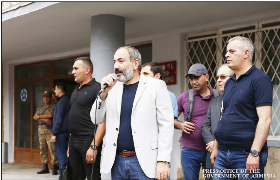
Վարչապետ Փաշինեան Տաւուշի մարզ իր կատարած այցելութեան ընթացքին

Յեղափոխութիւնը Հայաստանի մէջ ոչ միայն տնտեսական անկման չէ բերած, այլեւ յանգեցուցած է տնտեսական աշխուժութեան: Կառավարութեան նիստի ընթացքին անդրադառնալով առաջին կիսամեակի տնտեսական աշխուժութեան բարձր ցուցանիշին՝ յայտարարած է վարչապետ Նիկոլ Փաշինեանը: