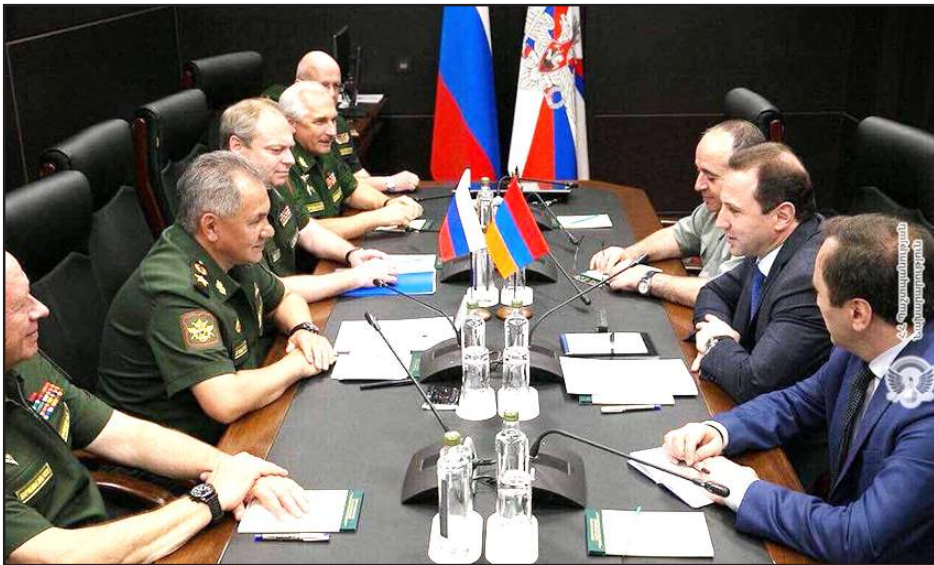
Դաւիթ Տօնոյեան- Սերկէյ Շոյկու հանդիպումը Մոսկուայի մէջ

ՀՀ պաշտպանութեան նախարար Դաւիթ Տօնոյեանը Մոսկուա կատարած այցի շրջանակէն ներս Օգոստոս 11-ին հանդիպում ունեցած է ՌԴ պաշտպանութեան նախարար, բանակի զօրավար Սերկէյ Շոյկուի հետ: