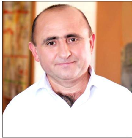
ավտորիտարիզմի փակուղում», պայքարողական անունը:

Յակոբեան այժմ կ'աշխատի իր երկու նոր գիրքերուն վրայ՝ «Հայ-թուրքական յարաբերութիւն-ները եւ Ատրպէյճանը 1917-1921 թթ». եւ «Հայաստանը 1988-ից յետոյ. Ժողովրդավարութեան եւ