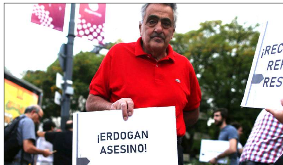
Արժանքինահայեր կը բողոքեն Թուրքիոյ նախագահի այցելութեան դէմ

Պուէնտո Ալբերտի մէջ կայացած տնտեսապէս ամ լինէն ուժեղ երկիրներու՝ G20-ի գագաթի ժողովի շրջանածիրէն ներս տեղի ունեցած մամլոյ ասուլիսի ժամանակ լրագրող մը, որ ինքզինք համարած է Հայոց ցեղասպանութեան զոհերու ծոռ, Թուրքիոյ նախագահ Ռեճէպ Էրտողանին հարց ուղղած է, թէ արդեօ՞ք ժամանակը չէ, որ Թուրքիան ընդունի հայերու դէմ իրականացուած ցեղասպանութիւնը: