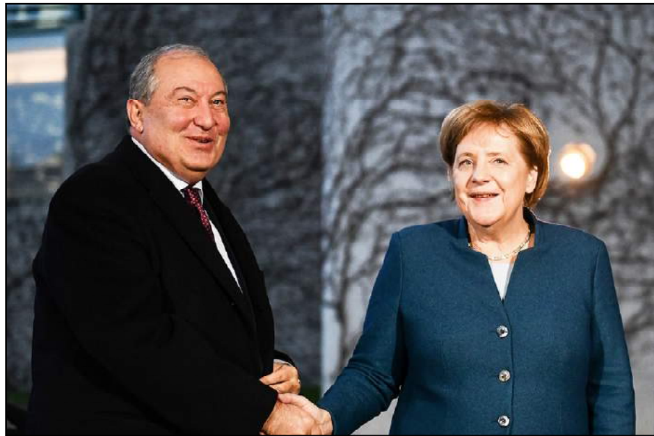
Հայաստանի Գաղութային Արմէն Սարգսեանի եւ Վարչապետ Անկէլա Մերքելի հանդիպումը

Գերմանիոյ Դաշնային Հանրապետութեան վարչապետի նստավայրին մէջ Նոյեմբեր 28-ին կայացած է Հայաստանի նախագահ Արմէն Սարգսեանի եւ վարչապետ Անկէլա Մերքելի հանդիպումը: Ինչպէս կը տեղեկացնէ ՀՀ նախագահի մամուլի վարչութիւնը, ողջունելով Հայաստանի Հանրապետութեան նախագահի պաշտօնական այցը Գերմանիոյ Դաշնային Հանրապետութիւն՝ վարչապետ Անկէլա Մերքել ըսած է, որ շատ լաւ յիշողութիւններ ունի Հայաստան կատարած իր վերջին այցէն: Ան նշած է, որ յատկապէս տպաւորուած է «Թումո» ստեղծարար արհեստագիտութիւններու կեդրոնով, եւ այժմ գերմանական կողմը կը քննարկէ համագործակցութեան հնարաւորութիւնները: «Հայաստանը Գերմանիան կը դիտարկէ որպէս քաղաքական եւ տնտեսական կարեւոր գործընկեր ու բարեկամ երկիր», - ըսած է նախագահ Սարգսեան եւ նշած, որ ուրախ է կրկին հանդիպելու եւ