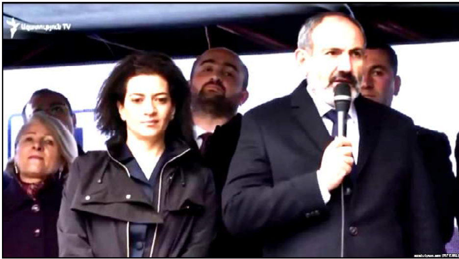
Նիկոլ Փաշինեան ելոյթ կ'ունենայ քարոզարշաւի ընթացքին. կողքին տիկինը՝ Աննա Յակոբեան

«Իմ քայլը» դաշինքի նախընտրական քարոզարշաւի ընթացքին վարչապետի պաշտօնակատար Նիկոլ Փաշինեան խօսած է տնտեսութեան զարգացման իրենց ծրագիրներուն մասին: Բացի այդ ծրագիրներէն, խօսած է նաեւ ներքաղաքական հարցերու մասին, անդրադարձած է Հանրապետական պատգամաւոր Արամ Յարութիւնեանը անձեռնմխելիութենէ զրկելու Ազգային ժողովի նիստի տապալման, եւ այն մեկնաբանութիւններուն, թէ Արամ Յարութիւնեանը այս օրերուն կալանաւորելու եւ անձեռնմխելիութենէ զրկելու իշխանութեան քայլը պայմանաւորուած է նախընտրական քարոզարշաւով: Այս մասին, չստիպալէս, խօսած էր Դաշնակցութեան համամասնական ցուցակը գլխաւորող Արմէն Ռուստամեանը, այն որակելով որպէս նախընտրական քարոզչութեան շրջանակէն ներս բեմականացում: