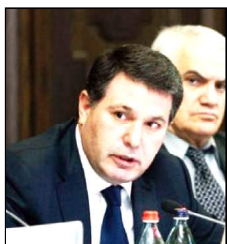
Ազգային ժողովի պատգամաւոր Արամ Յարութիւնեան

«Միաժամանակ քրէական գործով տուեալներ են ձեռք բերուել այն մասին, որ փաստացի Արամ Յարութիւնեանին են պատկանում Երեւան քաղաքի մի քանի հասցէներում գտնուող առանձնատուն, բնակարաններ, Հանրապետութեան հրապարակի յարակից տարածքում