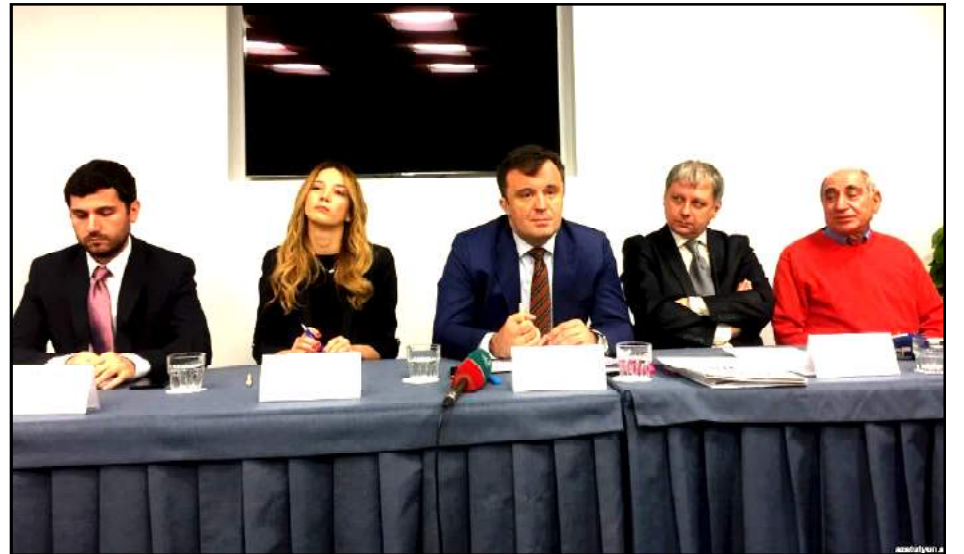
Եւրոպացի դիտորդներու մամլոյ ասուլիսը Երեւանի մէջ

«Մենք հաճելիօրէն զարմացած էինք, որ այս նախընտրական քարոզարշաւը շատ խաղաղ կ'ընթանար, հաշուի առնելով այն հանգամանքը, որ փոփոխութիւնները եղած էին