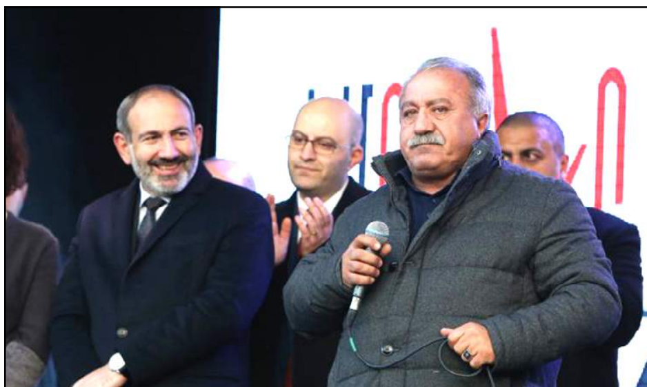
Սասուն Միքայէլեան ելոյթ կ'ունենայ ընտրարաշաւի ընթացքին կողքին Նիկոլ Փաշինեան

Համաձայն Հայաստանի Կեդրոնական ընտրական յանձնաժողովի հրապարակած արդիւնքներուն, 1287 տարածքային թեկնածուներէն ամենաշատ քուէ ստացած է «Իմ քայլէն» Սասուն Միքայէլեանը՝ 31 հազար 739, ամենաքիչը՝ Օեկ-էն Աննա Մելիքբեկեանը՝ 6 ձայն: