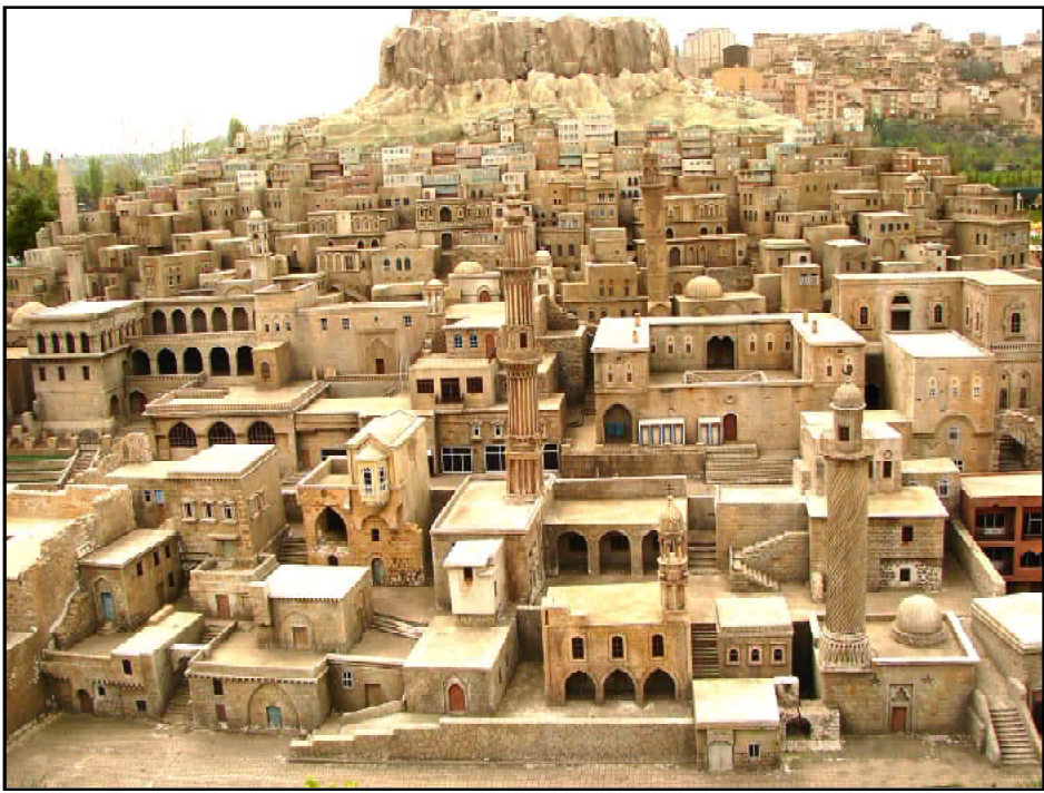
Մարտին հին քաղաք

Անոնց միակ պաշտօնը պիտի ըլլար իրենց բնակած շրջաններուն մէջ կողոպուտի եւ ջարդի մասնակցիլ»: Հայր Եասենթ Սիմոն կ'եզրակայնէ. «Պետական կարգադրութեամբ՝ ջարդ մը կը պատրաստուէր. քրիստոնեայ ժողովուրդը այս առաջին դասը քաղեց իր չարաղէտ բոլոր հետեւանքներով»: Կառավարութիւնը «Գաղտնի Կոմիտէ» անունով կառուց մը ստեղծեց 1915-ի Յունուարին: Անոր գլուխը ներքին գործոց նախարար Թալատին էր, իսկ առաջին տեղակալը՝ Տիգրանակերտի վալիին՝ Ռաշիտ պէյը: Այս գաղտնիքը յուշագրող Հայր Եասենթ թուրք բարձրաստիճան սպայէ մը իմացած էր: Գաղտնի կազմակերպութեան անդամները պատրաստ պէտք էր ըլլային որեւէ հրաման գործադրելու: Անաստողները պիտի պաշտօնագրակուէին կամ մահուամբ պատժուէին: «Հայրենիքի դաւաճանները պէտք է պատժուին», կ'ըսէին թուրքերը: Այս ըսելով, անոնք քրիստոնեաները եւ մասնաւորաբար հայերը նկատի ունէին: Հայոց դէմ գործադրուածը հալածանք եւ