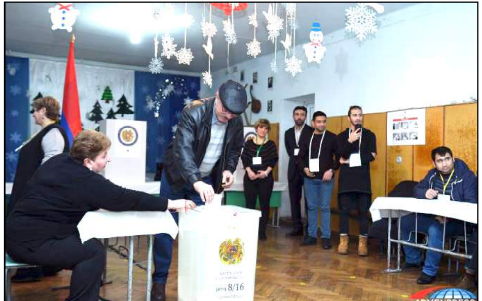
Ընտրական տեղամասերէն մէկուն մէջ՝ ժողովուրդը կը մասնակցի քուէարկութեան

Հայաստանի Կեդրոնական Ընտրական Յանձնաժողովի հրապարակած նախնական արդիւնքներու հիման վրայ, «Իմ Քայլը» դաշինքը ստացած է 884 հազար 456 ձայն կամ ձայներու 70,43%-ը, ԲՀԿ՝ 103 հազար 824 ձայն կամ ձայներու 8,27%-ը, ԼՀԿ՝ 80 հազար 024 ձայն կամ ձայներու 6,37 %-ը: Նախկին իշխող հանրապետական կուսակցութիւնը (ՀՀԿ) չէ