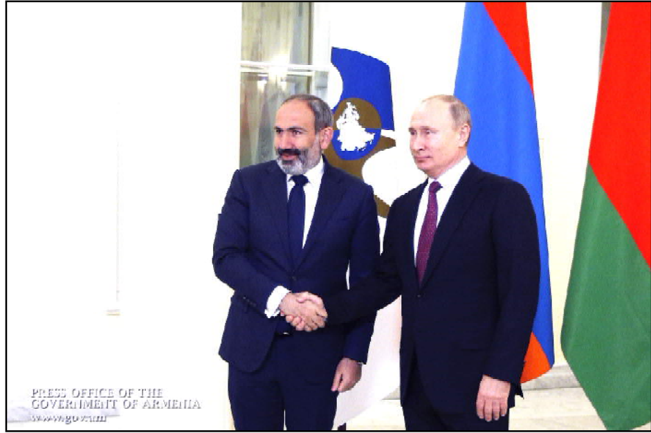
Նախագահ Փութին Փաշինեանին կը յանձնէ Եւրասիական Տնտեսական Միութեան Նախագահութիւնը