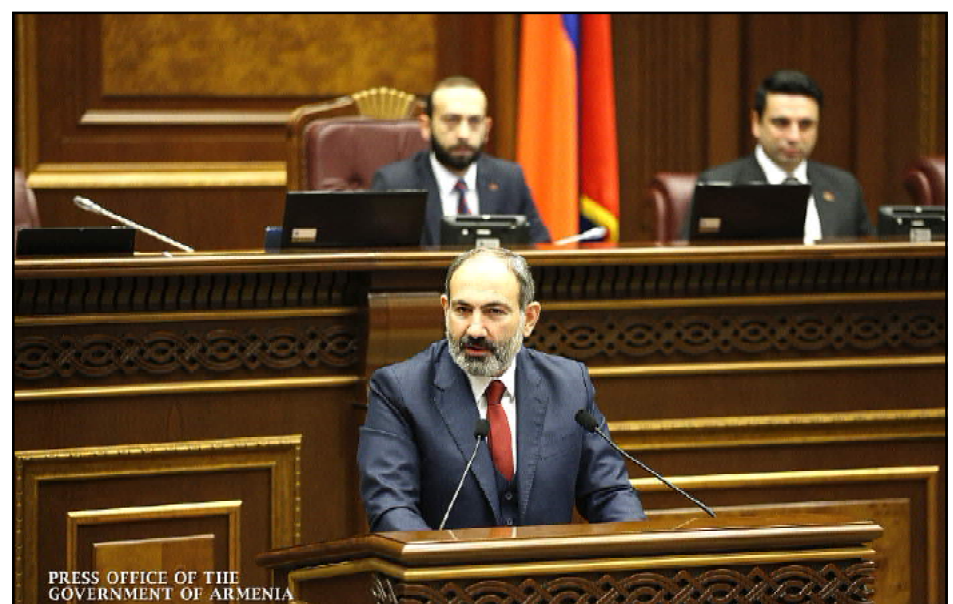
Նիկոլ Փաշինեան ելոյթ կ'ունենայ Ազգային ժողովէն ներս՝ կառավարութեան ծրագիրը ներկայացնելու ժամանակ

«Մեզ համար չափազանց կարեւոր է, որպէսզի Արցախը ունենայ վճռորոշ նշանակութիւն սեփական ճակատագրի որոշման գործում», - յայտարարած է Հայաստանի վարչապետ Նիկոլ Փաշինեանը՝ Ազգային ժողովէն ներս կառա-