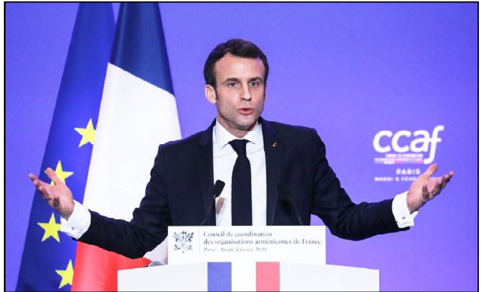
Նախագահ Մաքրոն ելոյթ կ'ունենայ Ֆրանսայի հայկական կազմակերպութիւններու խորհուրդի ճաշկերոյթի ընթացքին

Միջոցառման ժամանակ Ֆրանսայի նախագահը նաեւ յարգանքի տուրք մատուցեց Շարլ Ազնաւուրի յիշատակին: Աշխարհահռչակ շանտոնիէի որդին՝ Նի-