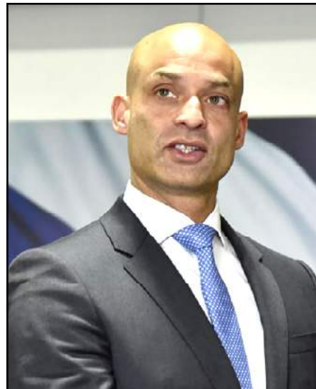
ՆԱԹՕ-ի Գլխաւոր քարտուղարի յատուկ ներկայացուցիչ ձէյմս Ապաթուրայ

ՆԱԹՕ-ի ներկայացուցիչը նաեւ նշած է, որ ՆԱԹՕ-ն կը յարգէ Հայաստանի Հանրապետութեան ընտրութիւնը՝ դաշնակիցներու հարցի վերաբերեալ: ձէյմս Ապաթուրայի խօսքով՝ խնդիր չկայ Եւրասիական տնտեսական միութեան