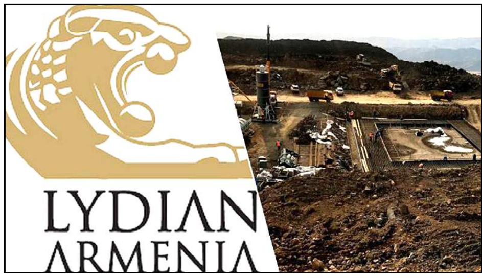
«Լիտիան Ինթըրնաշնլ Լիմիթըտ» ընկերութեան Ամուլսարի ոսկիի հանքը

«Լիտիան Ինթըրնաշնլ Լիմիթըտ» ընկերութիւնը յայտարարած է, որ Ամուլսարի ոսկիի ծրագրի ճանապարհներու շարունակական շրջափակման կապակցութեամբ Lydian UK Corporation Limited եւ Lydian Canada Ventures Corporation ընկերութեան դուստր կազմակերպութիւնները պաշտօնապէս տեղեկ պահած են ՀՀ կառավարութեան, Մեծ Բրիտանիոյ եւ Հիւսիսային Իռլանտայի Միացեալ Թագաւորութեան եւ ՀՀ կառավարութեան միջեւ Ներդրումներու խրախուսման եւ պաշտպանութեան պայմանագրի եւ Գանատայի կառավարութեան եւ ՀՀ կառավարութեան միջեւ Ներդրումներու խրախուսման եւ պաշտպանութեան պայմանագրի շրջանակներուն ՀՀ կառավարութեան հետ վէճերու առ-