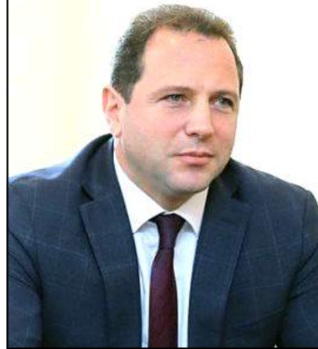
Հայաստանի պաշտպանութեան նախարար Դաւիթ Տօնոյեան

Մարտ 11-ին Ատրպէյճանական բանակը լայնածաւալ զօրա-