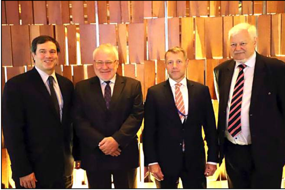
ԵԱՀԿ Մինսկի խմբի համանախագահները

ԵԱՀԿ Մինսկի խմբի համանախագահների վերջին յայտարարութիւնը, մեղմ ասած, մեծ աղմուկի պատճառ է դարձել հայկական հանրութեան շրջանում: Եւ յատկապէս ոգեւորուել են նախկին իշխանութիւնների ներկայացուցիչներն ու նրանց յարակից վերլուծաբանները: Եւ դա այն դէպքում, երբ այդ յայտարարութիւնից ամենաքիչը հենց նրանք պիտի ոգեւորուեն: Եւ ահա թէ ինչու: