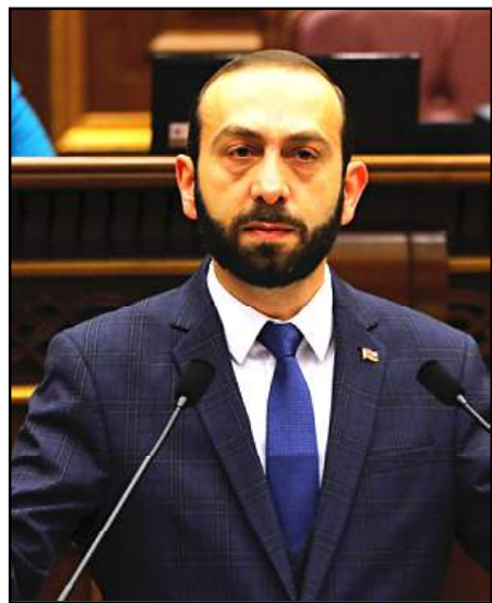
Ազգային ժողովի նախագահ Արարատ Միրզոյեան

«Իմ քայլը» խմբակցութեան Վահագն Յովակիմեանի խօսքով՝ կը հրաւիրեն թէ՛ խորհրդարանական, թէ՛ արտախորհրդարանական ուժերը: Յառաջիկային պիտի յտակցուի նաեւ ձեւաչափը՝ ուր եւ ինչպէս պիտի աշխատին: Ժամկէտներու սահմանափակում, ըստ