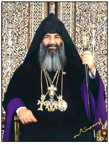
Պոլսոյ Հայոց պատրիարք Մերոպ արքեպիսկոպոս Մուրաֆեան

Քայլարշաւի մանրամասնութիւնները պիտի հաղորդուին յառաջիկայ շաբաթներուն: Լրացուցիչ տեղեկութիւններ կարելի է գտնել AGC-ի կայքէջին վրայ՝ www.March4Justice.com եւ կամ Armenian Genocide Committee-ի ֆէյսպուքեան էջով եւ կամ զանգահարելով (888) 924-1915: