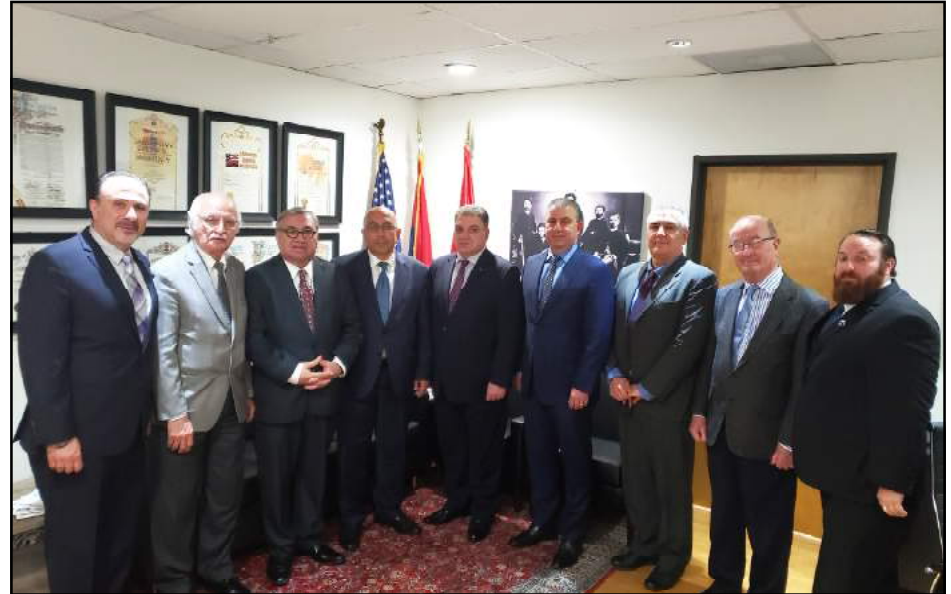
ՍԳՀԿ ներկայացուցիչները դեսպան Վահագն Մելիքեանի եւ հիւպատոս Արմէն Պայպուրդեանի հետ

Երեքշաբթի, Ապրիլ 9-ին, ՍԳՀԿ Կլենտէյլի գրասենեակը այցելեց Հայաստանի Արտաքին Գործոց Նախարարութեան գլխաւոր քարտուղար դեսպան Վահագն Մելիքեան: Անոր կ'ընկերակցէին Լոս Անճելոսի մէջ ՀՀ գլխաւոր հիւպատոս ղեկավար Արմէն Բայբուրդեան եւ խորհրդակցական Պր. Վարագդատ Պահլավունի: Հիւրերը ընդունուեցան Կուսակցութեան ներկայացուցիչներուն կողմէ, գլխաւորութեամբ՝ ՍԳՀԿ Կեդրոնական վարչութեան ատենապետ Տոքթ. Համբիկ Սարգսեանի: