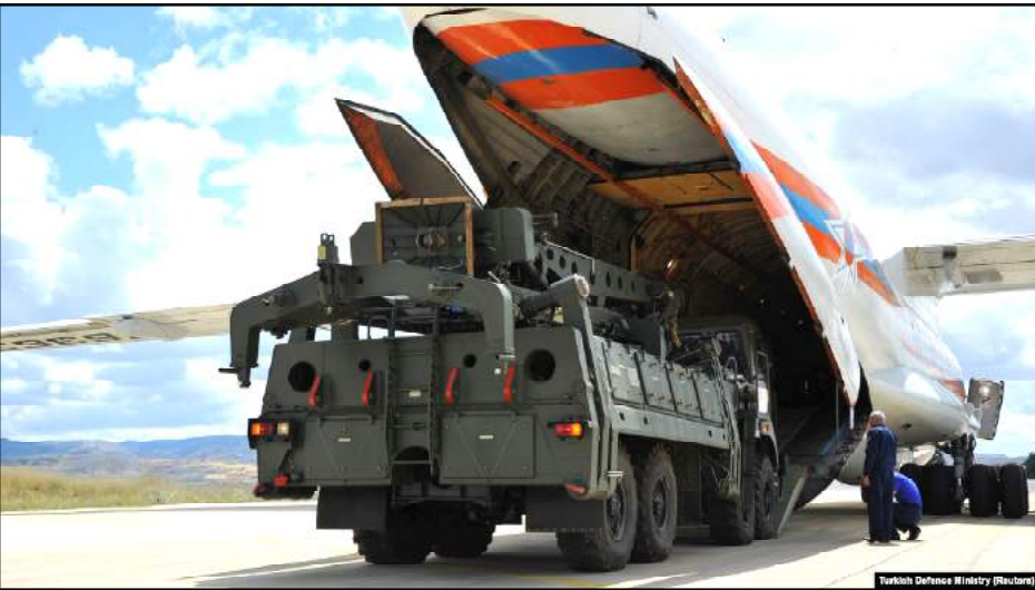
Turkish Defense Ministry (Reuters)

Երկրներն այդ կապուած են տնտեսական, հնարագործական կապերով, եւ դրանց խաթարումը կամ կանխարգելումը լուրջ հետեւանքներ կ'ունենայ երկու կողմերի համար էլ՝ ինչպէս պատժամիջոցների տակ գտնուող Ռուսաստանի, այնպէս էլ ԵՄ-ի եւ ԱՄՆ-ի հետ լուրջ խնդիրներ ունեցող Թուրքիայի: Անկախ փոխյարաբերութիւնների կարգավիճակից՝ տնտեսական համագործակցութիւնը երբեք չի ընդհատուի: Յիշեցնենք՝ ռուս-թուրքական գրեթէ բոլոր պատերազմների ժամանակ Ռուսաստան-Թուրքիա տնտեսական գործունէութիւնը հիմնականում չի կանխարգելուել եւ բնականոն շարունակուել է, իհարկէ այնքան, որքան որ հնարաւոր է եղել պատերազմական իրավիճակներում: Եթէ խնդրոյ առարկան փորձենք դիտարկել պատմութեան տեսանկիւնից, ապա Ռուսաստանը գրեթէ միշտ Թուրքիայի համար ունեցել է մահակի կարգավիճակ, իսկ վերջինս էլ եղել է այն պատենը, որը կանխարգելել է Ռուսաստանի ներթափանցումը Մերձավոր եւ Միջին Արեւելք, ինչպէս նաեւ բացարձակ հեգեմոնիան Սեւ ծովում: Այս տրամաբանութիւնից ելնելով՝ Ռուսաստանը Սիրիայում խաղաց մահակի իր