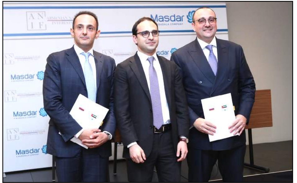
Կը ստորագրուի վերականգնող ուժանիւթի ոլորտին մէջ ներդրումներ իրականացնելու վերաբերեալ յուշագիր

«Հայաստանի պետական հետաքրքրութիւններու ֆոնտի» եւ արաբական «Մաստար» ընկերութեան միջեւ կնքուած է վերականգնող ուժանիւթի ոլորտին մէջ ներդրումներ իրականացնելու վերաբերեալ յուշագիր: Կողմերու նախնական գնահատմամբ՝ ներդրումներու ծաւալը պիտի կազմէ 500 միլիոն տոլար: