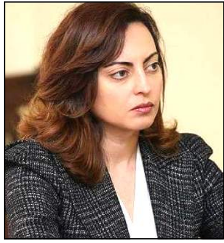
Ազգային ժողովի փոխնախագահ Լենա Նազարեան

ուած փաստաթուղթի՝ «Համաձայնութիւն ձեռք բերուած է, որ բոլոր պաշտօնավարող դատաւորներու ընդհանուր վեթիկը ոչ անհրաժեշտ, ոչ ալ օգտակար կ'ըլլայ»: