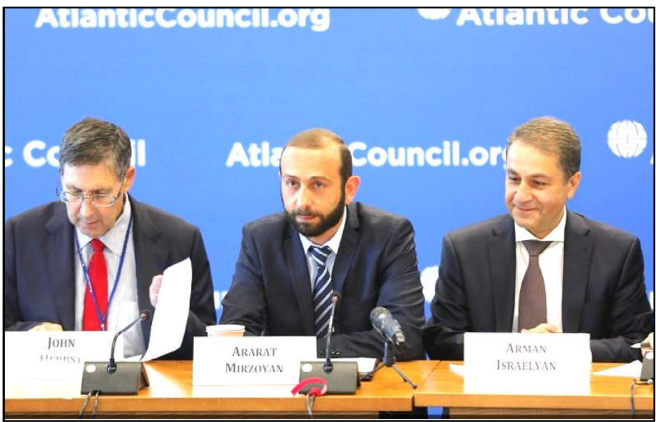
Հայաստանի Ազգային Ժողովի նախագահ Արարատ Միրզոյեան հանդէս կու գայ Atlantic Council կեդրոնէն ներս

ՀՀ ազգային ժողովի նախագահ Արարատ Միրզոյեան ԱՄՆ-ի գործընկերներուն տեղեկացուցած է, որ Հայաստանի տնտեսութիւնը վնասներ կը կրէ Իրանի դէմ պատ-