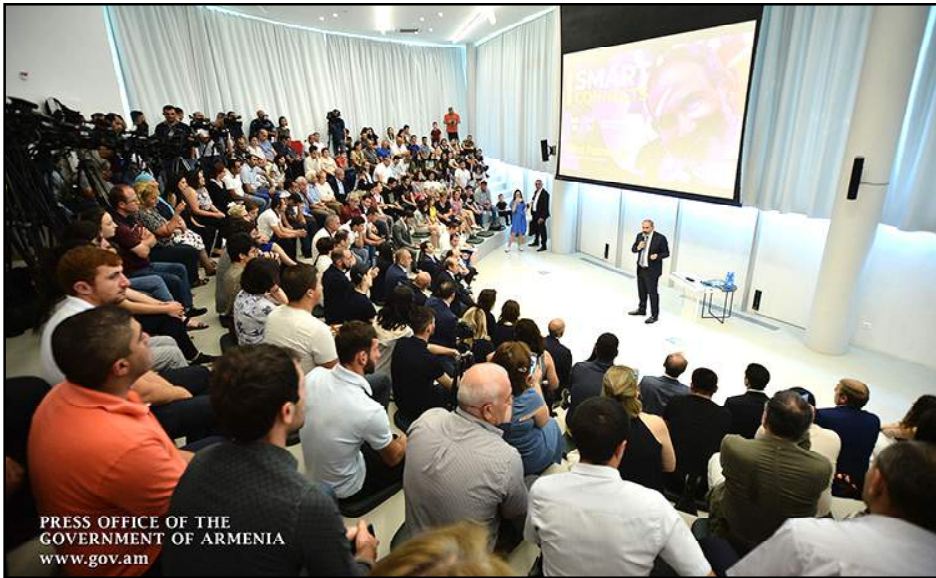
Վարչապետ Նիկոլ Փաշինեան ելոյթ կ'ունենայ Լոռիի մարզի «Սմարթ» կեդրոնէն ներս

Հայաստանի մէջ տեղի ունեցած յեղափոխութեան տնտեսական հիմքը այն մարդիկ են, որոնք դուրս եկած են «աւանդական օլիգարխիկ-փոստած տրամաբանութեան շրջանակներէն եւ ցուցաբերած են նախաձեռնութիւններ», Լոռիի մարզի «Սմարթ» կեդրոնէն ներս ըսած է վարչապետ Նիկոլ Փաշինեանը: