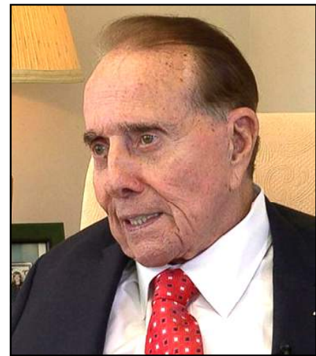
Համար Ռոպերթ Ճոզէֆ Տոսկը (ԱՄՆ) պարգեւատրել Պատուոյ շքանշանով», - ըսուած է ՀՀ նախագահի հրամանագրին մէջ:

«Հիմք ընդունելով վարչապետի միջնորդութիւնը՝ համաձայն Սահմանադրութեան 136-րդ յօդուածի, ինչպէս նաեւ «Հայաստանի Հանրապետութեան պետական պարգեւներու եւ պատուաւոր կոչումներու մասին» օրէնքի 5.3-րդ յօդուածի 1-ին մասի. Հայաստանի Հանրապետութեան կապերու վարչապետի հրամանագրով պարգեւատրելու մասին մէջ ներդրած աւանդի