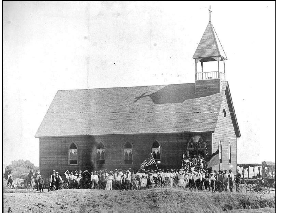
Old Yettem Church