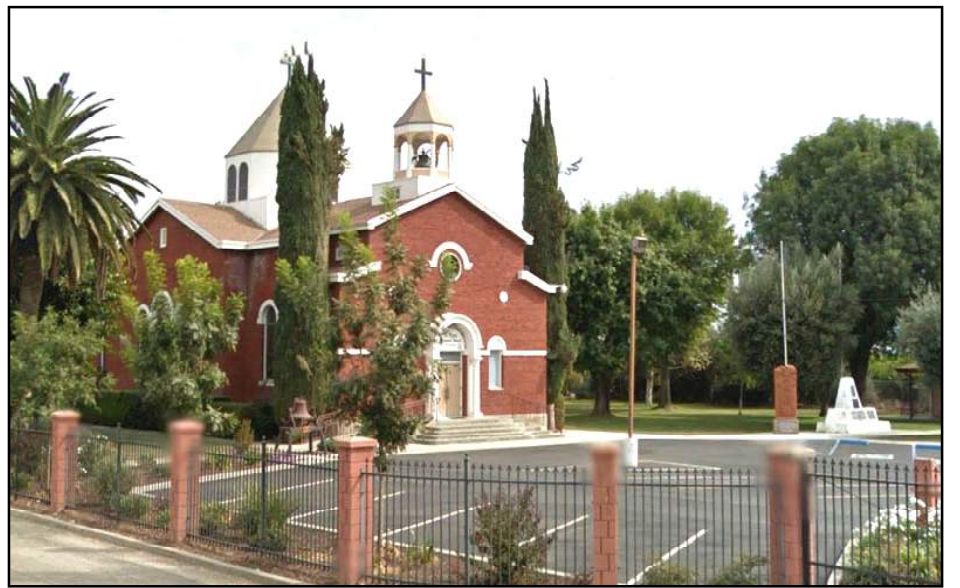
Yettem Church – side view – 2012

have been beautified with a Martyrs Memorial Monument, an Armenian Khachkar, and an Armenian Monumental Cross.