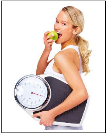
ալ առանց շաքարի պատրաստուած չիրի տեսակներ:

Ոչ մէկ խմորեղէն կամ հացի տեսակ: Եթէ քաղցրի պահանջ շատ կը զգաք, կրնաք պտուղ ուտել կամ