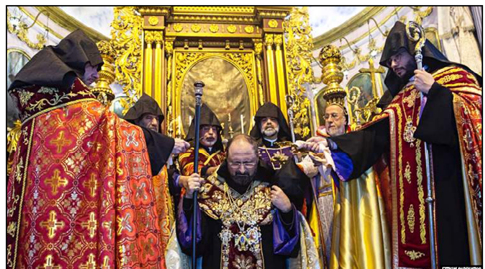
Պոլսոյ նորընտիր պատրիարք Սահակ եպս. Մաշալեանի գահակալութեան արարողութեան ընթացքին

Յունուար 11-ին, Պոլսոյ աթոռանիստ հայկական Սուրբ Աստուածածին Մայր տաճարին մէջ տեղի ունեցած է Պոլսոյ նորընտիր պատրիարք Սահակ եպս. Մաշալեանի գահակալութեան արարողութիւնը: