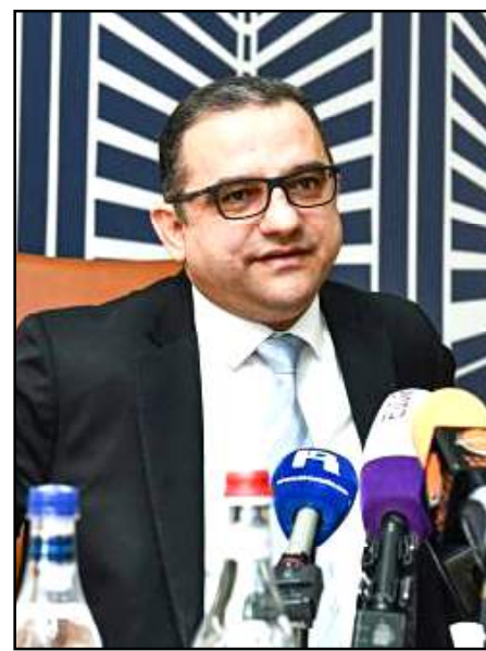
ՀՀ տնտեսութեան նախարար Տիգրան Խաչատրեան

«Մենք արդէն 11 ամիսների արդիւնքում ունենք 9 տոկոս արտահանման աճ: Դրանք շարունակուած են լինել այն ուղղութիւնները, որոնք տարեկանից առանձնանում էին որպէս արտահանման առաջատար ուղղութիւններ: Քոնեակի արտահանումն աճել է 26,7 տոկոսով, ծխախոտը՝ 9, պղնձի խտանիլթը՝ 16,8, շոքոլատի արտահանումը՝ 14,6, մրգային գինիները՝ 75 տոկոսով, խաղողի գինիները՝ 26 տոկոսով: Սրանք մի քանի ապրանքախմբեր էին, որոնք ընդգծուած առաջատար ազդեցութիւն են թողել ընդհանուր արտահանման աճի վրայ: Եւ մենք կանխատեսում ենք, որ տարուայ արդիւնքներով արտահանումը հանրագումարով կը լինի