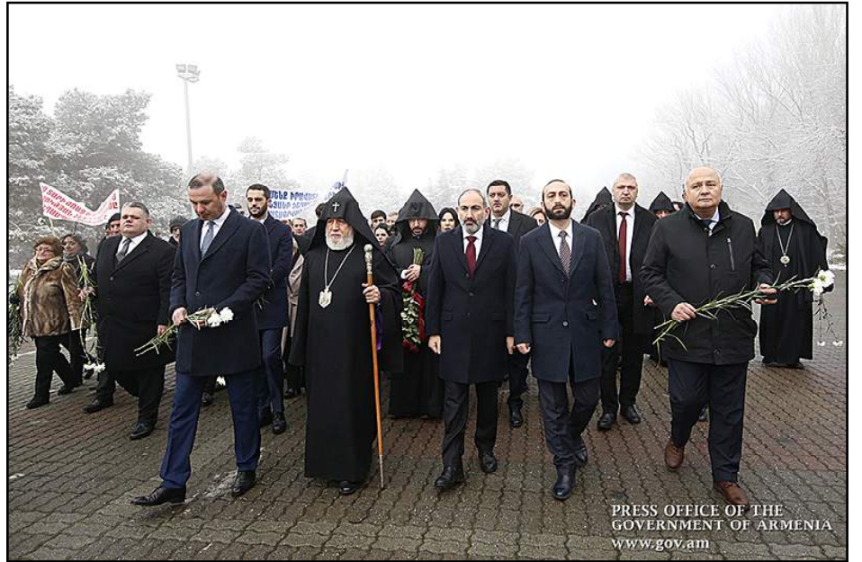
Պաքուի կոտորածներու 30-ամեակին առթիւ Հայաստանի քաղաքական եւ կրօնական առաջնորդները կ'այցելեն Ծիծեռնակաբերդի յուշահամալիր

«Դէպքերէն 30 տարի անց Ատրպէյճանի մէջ գոյութիւն չունի Պաքուի հակահայկական Չարդերու զոհերու հանդէպ որեւէ յարգանք եւ կարեկցանք: Այն սակաւաթիւ ձայները, որոնք քաջութիւն ունեցած են անգամ գրական ստեղծագործութիւններու մէջ յիշատա-