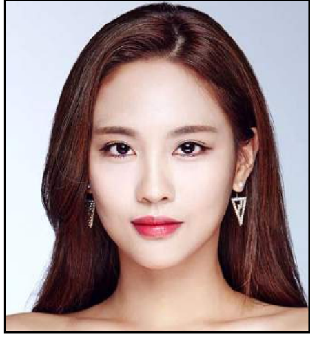
կ'օգտագործեն SPF միջոցներ:

Չինացի կանայք ուշադիր կերպով կը պաշտպանուին անդրմանիշակագոյն ճառագայթներէն: Անոնք