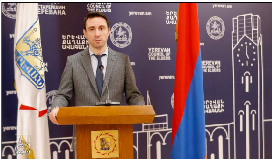
Երեւանի քաղաքապետ Հայկ Մարութեան

Համացանցի միջոցով կը շարունակուին ոչ ճշգրիտ տեղեկութիւններ շրջանառուելու, տարբեր պաշտօնեաներու երկիրը լքելու մասին: Խօսքը, այս անգամ, ՀՀ նախագահ Արմէն Սարգսեանի մասին է: Մամուլի մէջ տարածուած էին գրառումներ, թէ արտակարգ իրավիճակի պայմաններու մէջ վերջինս լքած է երկիրը: Ըստ «Արմէնփրէս»-ին, տեղեկութիւնը ստուգելու համար, Տեղեկատուութեան ստուգման կեդրոնը կապ հաստատեց Հանրապետութեան նախագահի աշխատակազմի հետ, որոնք յայտնեցին, որ Արմէն Սարգսեան չէ լքած երկիրը եւ այժմ կը գտնուի իր աշխատասենեակը: