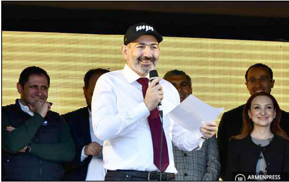
Նիկոլ Փաշինեան «Այո»-ի ճակատի քարոզարշաւի ընթացքին

«Այո»-ի ճակատի քարոզարշաւի ընթացքին, Գորիսի մէջ վարչապետ Նիկոլ Փաշինեան յայտաբարեց, որ աւելի քան 40 միլիոն տոլարի չարաշահման տեղի ունեցած է, որը կ'առնչուի նախկին իշխանութիւններու օրօք բանակի համար անպիտան գինամթերքի գնման: «Սերժ Սարգսեանի իշխանութիւնը 42 միլիոն տոլար տուել են՝ գէնք են առել, էդ գէնքը չի աշխատում, ընդհանրապէս ոչ մի բանի պիտանի չի, մետաղի ջարդոն է՝ ընդամէնը մետաղի ջարդոն: 42 միլիոն տոլար են տուել էդ մարդիկ: Էդ գէնքը ոչ մի բանի պիտանի չի՝ դա գէնք էլ չի, դա անհասկանալի... Հիմա քրէական գործ է յարուցուած՝ թող Սերժ Սարգսեանը զայս արա պատասխանը տայ», - ըսաւ Փաշինեան: