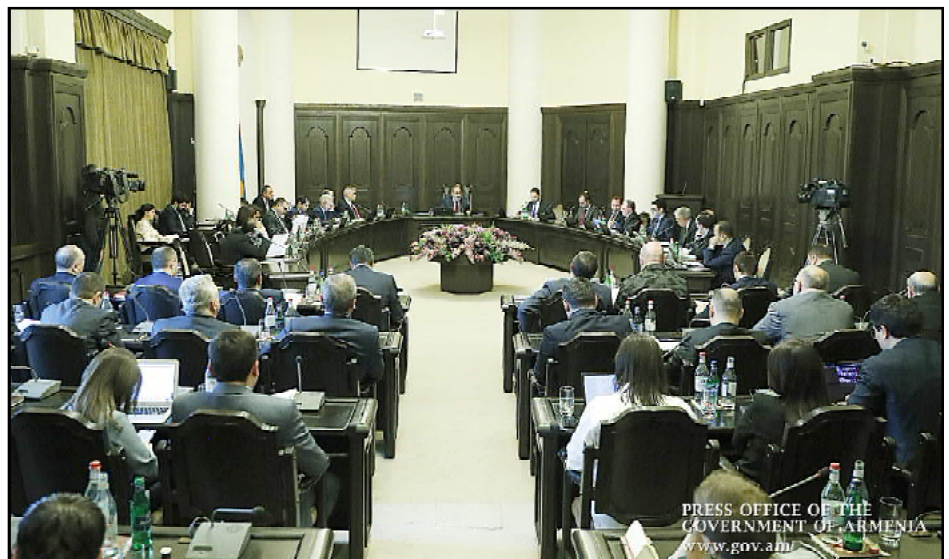
Հայաստանի կառավարությունը նիստի ընթացքին

Ան նշեց, որ գործընկերներուն, նաեւ Ազգային վարկատու ընկերությունեան հետ պայմանաւորուած են, որ հնարաւորութիւն կը տրուի մինչեւ վեց ամիս ժամկէտով փոխել վարկաւորման պայմանները, յետաձգել վարկի մա-