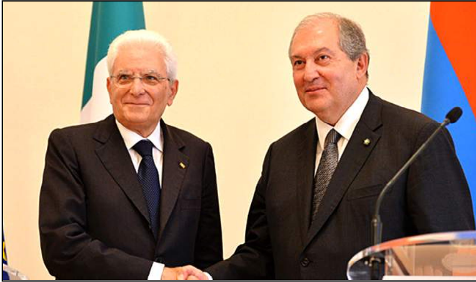
Նախագահներ Սերժիօ Մաթարելլա եւ Արմէն Սարգսեան

Հայաստանի Հանրապետութեան նախագահ Արմէն Սարգսեանը հեռախօսազրոյց ունեցած է Իտալիոյ Հանրապետութեան նախագահ Սերժիօ Մաթարելլայի հետ: Այս մասին յայտնած են ՀՀ նախագահի աշխատակազմի հասարակայնութեան հետ կապերու վարչութեան: