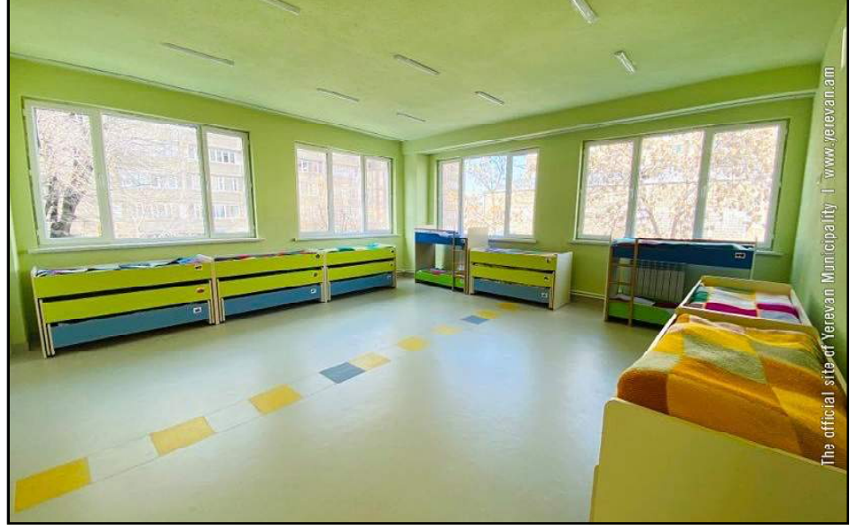
Երեւանի քաղաքապետարանի պիւտճով վերանորոգուած մանկապարտէզ

Նախկին իշխանութիւններուն օրով, տարբեր կազմակերպութիւններու օգտագործման յանձնուած Երեւանի մանկապարտէզները հերթաբար կը վերադառնան համայնքին: Թիւ 119 մանկապարտէզը վերադարձած է քաղաքապետարանին եւ հերթագրուած 100 երեխային 33-ը արդէն կը յաճախեն մանկապարտէզ: «Երկար տարիներ տարածքը յանձնուած էր «Հայ Յեղափոխական Դաշնակցութիւն» կուսակցութեան, որպէս գրասենեակ: Պայմանագիրը լրանալուց յետոյ Երեւանի քաղաքապետարանը պայմանագիրն այլեւս չէր կարգադրեց՝ հնարաւորութիւն տալով տասնեակ երեխաների մանկապարտէզ յաճախել: Խմբասենեակը, որը մօտ 140 քմ է, նորոգուել է քաղաքապետարանի պիւտճով: Այն նախատեսուած է կրտսեր խմբի երեխաների համար», - ըսաւ Երեւանի թիւ 119 մանկապարտէզի տնօրէն Նելլի Աղումեան: «Այն բոլոր տարածքները, որոնք համայնքից վերցրել են եւ օգտագործուում են, մենք պէտք է վերադարձնենք եւ օգտագործենք նպատակային: Այսինքն՝ մանկապարտէզներում պէտք է բացենք նոր խմբասենեակներ: Մեր հաշուարկներով այսօր շուրջ 250 նոր խմբասենեակ բացելու անհրաժեշտութիւն կայ, որպէսզի կարողա-